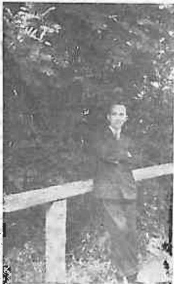
AUGUST CESAREC NA SAJMISTU U BRCKOVLJANIMA. U JEDNOM OD SLIJEDEĆIH NASTAVAKA OBJAVIT ČEMO FOTOGRAFIJU KUĆE I SOBIĆE NA TAVANU GDJE SE SAKRIVAO I GDJE SU SE SASTAJALI ČLANOVI CENTRALNOG KOMITETA KOMUNISTIČKE PARTIJE JUGOSLAVIJE.

August Cesarec je 1922. godine otputovao ilegalno u Sovjetski Savez da kao delegat Komunističke partije Jugoslavije prisustvuje četvrtom kongresu Komunističke internacionale. Prilikom svog boravka u Sovjetskom Savezu August Cesarec je usko surađivao sa pjesnikom Vladimirom Majakovskim koji je uređivao moskovski književni časopis »Lef«. U ovom časopisu je August Cesarec objavljivao prikaze napredne jugoslavenske književnosti pod naslovom »Lef u Jugoslaviji« a potpisivao se »Član komiteta August Cesarec«. Četvrti kongres komunističke internacionale održavao se nekoliko dana a 13. novembra 1922. godine kongresu je prisustvovao i Lenjin. Prilikom održavanja ovog kongresa Augusta Cesarca je primio i Lenjin kojega je upoznao sa političkim zbivanjima u Jugoslaviji. Borba je 1923. godine objavila i jedan napis Cesarca o ovom događaju: »Bilo je to 13. novembra 1922. na IV kongresu Komunističke internacionale. Žamori internacionala na svim jezicima, no nekako kao da je prigušen to žamor: tako se savladava gomila koja čuva