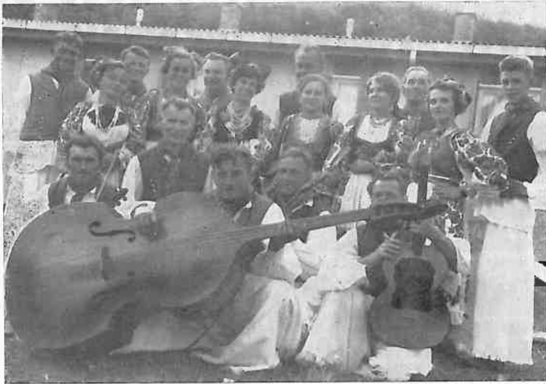
ČLANOVI FOLKLORNE SEKCIJE »SELJACKE SLOGE« LUPOGLAV