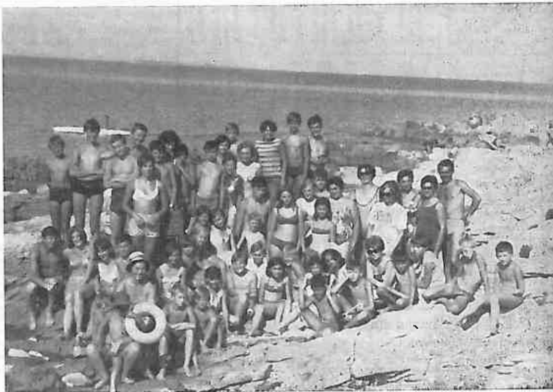
DRUGA SMJENA LJETUJE