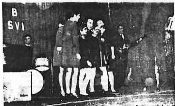
S REVIJE KAD BI SVI ...