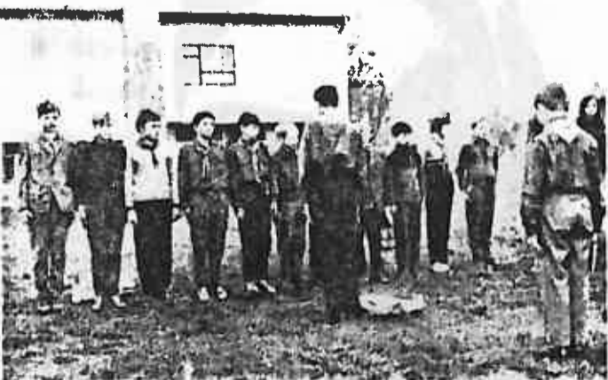
VOD IZVIĐAČA IZ SESVETSKOG KRALJEVCA PRILIKOM CITANJA REZULTATA TAKMIČENJA

U planu su zajednička savjetovanja i akcije za proljeće i ljeto 1968.