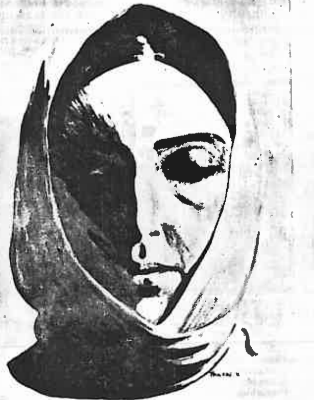
V. TRNSKI UVIJEK JE BILA SAMA ...