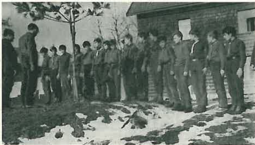
STROJ IZVIDAČA I PLANINKI ZA VRIJEME ČITANJA KONACNIH REZULTATA I POHVALA

Ujutro u 7 sati zviždalka. Znači: »Diži se, obući se i brzo na gimnastiku!« Natjecanje: tko će brže, tko najbrže i najbolje, čija će soba i čije uniforme na smotri biti najurednije. A poslije trkom na doručak, zatim sastanci, skijanje, ručak. Onda opet odmor, skijanje, užina, pjesme, večera, ples ili drugarsko veče. I tako svaki dan. Da li da vam pričam o drugarskim večerima, o šaljivim takmičenjima, o tome kako smo pjevali svaku večer, da li da vam pričam o noćnoj uzbuđi i o Zrinku koji je ostao spavati, o tome kako je drugarica Vera pala niz snježnu padinu za vrijeme uzbuđe, o prvoj ljubavi, o stidljivim porukama i pozdravima, o šaljivim zid-