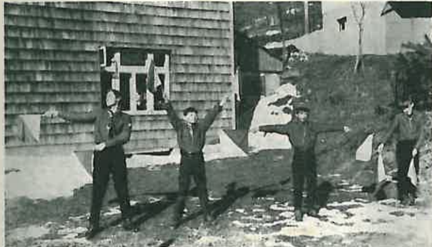
IZVIDAČKA SIGNALIZACIJA — IZVIDAČI ZASTAVICAMA IZRAZAVAJU RIJEČ HURA I POZDRAVLJAJU CITAOCE »DUGOSELKE KRONIKE«

Načelnik je organizirao dvije zabavne večeri s raznolikim programom, a angažirao je i ostale grupe, tako da je harmonija drugarstva bila na visini.«