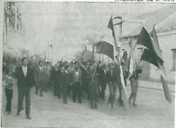
BORCI U DEFILU

blemima sudjelovalo 17 delegata i gostiju, dokazuje da je već mnogo ra- nije stvoren dobar preduvjet za ko- risnu društvenu aktivnost SUBNOR-a.