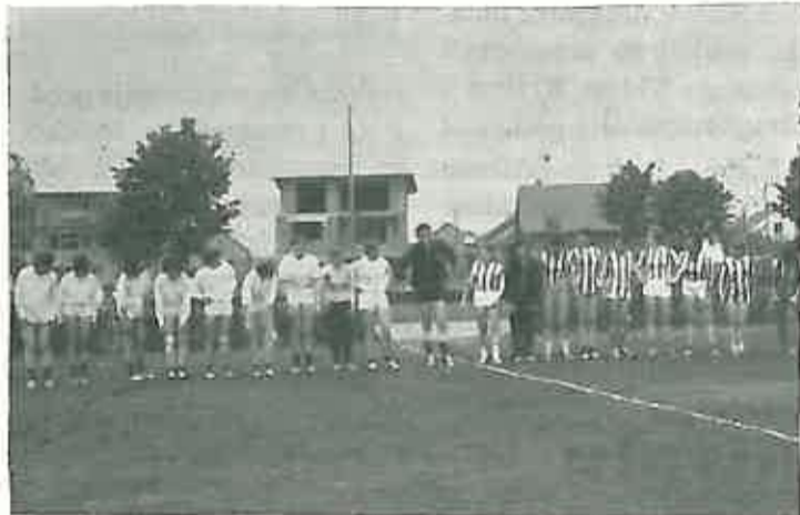
DERBI UTAKMICA IZMEĐU »JEDINSTVA« DUGO SELA I OMLADINSKOG SPORTSKOG KLUBA SESTVETE