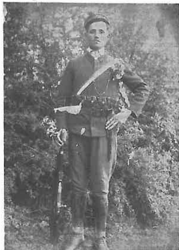
VOĐA ODREDA POBUNJENIH SELJAKA BACEK PAVAO U UNIFORMI ZANDARA KOJEGA JE RAZORUŽAO I SKINUO. PREKO RAMENA VIDI SE HRVATSKA ZASTAVA. UMRO 1927. GODINE OD TESKIH POSLJEDICA MUCENJA U ZATVORU.