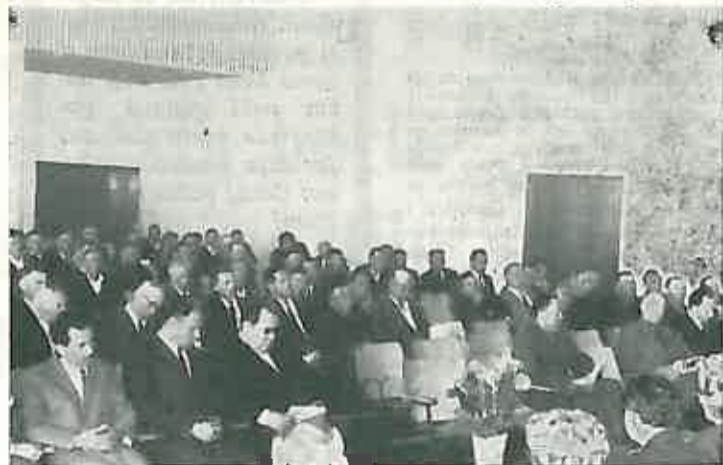
DELEGATI I GOSTI NA SKUPŠTINI SAVEZA UDRUŽENJA BORACA NOR-a

— članovi Općinskog komiteta SKH-a 4 — članovi Općinskih odbora društ. polit. organizacija 47