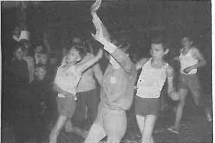
UČESNICI TRKE STIZU NA CILJ