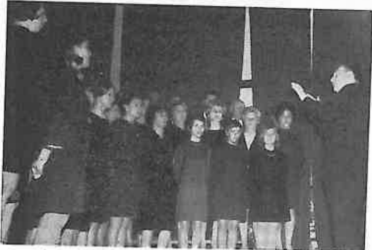
KULTURNO UMJETNIČKI PROGRAM ZAPOČEO JE PJEVAČKI ZBOR PJESMOM »HEROJ TITO«. PORED OVE PJESME IZVEDENO JE JOS 7 ZBORSKIH KOMPOZICIJA.

Općinski komitet Saveza omladine Dugo Selo organizirao je 24. svibnja ove godine svečanu akademiju u čast Dana mladosti.