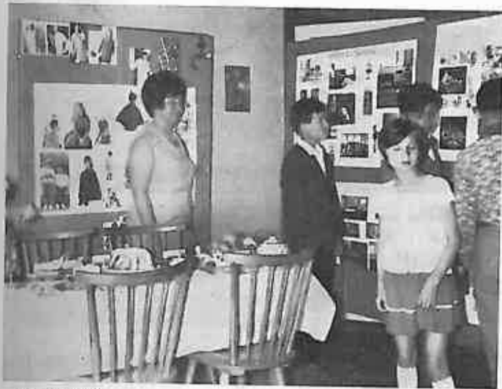
DIO IZLOŽBE PRIKAZUJE SERVIRANJE, SAVREMENO STANOVANJE I ODIJEVANJE