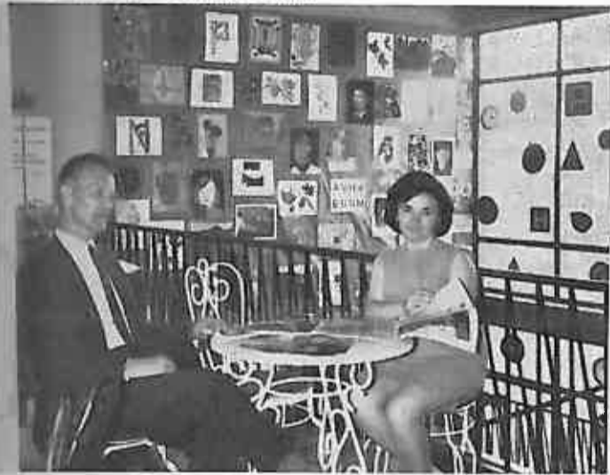
DETALJ SA IZLOŽBE