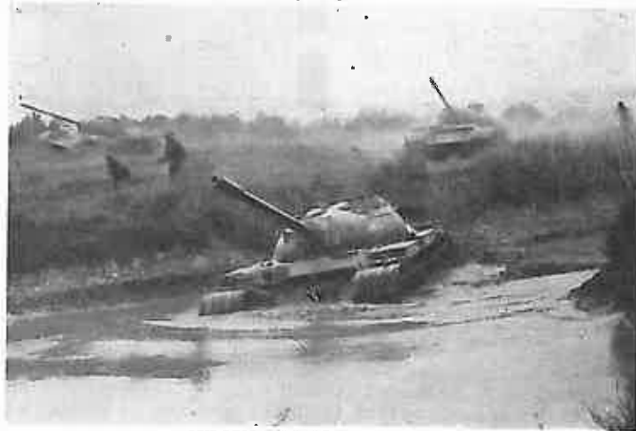
OKLOPNE JEDINICE U NAPADU

nema slobodnog zemljišta. Pješadija je krenula na „juris“, i tako, pred sobom čistila sve ono što nije mogla uništiti artiljerija i tenkovi. A kad su u borbu stupile i raketne jedinice još više je sve oživilo. Dolinom su