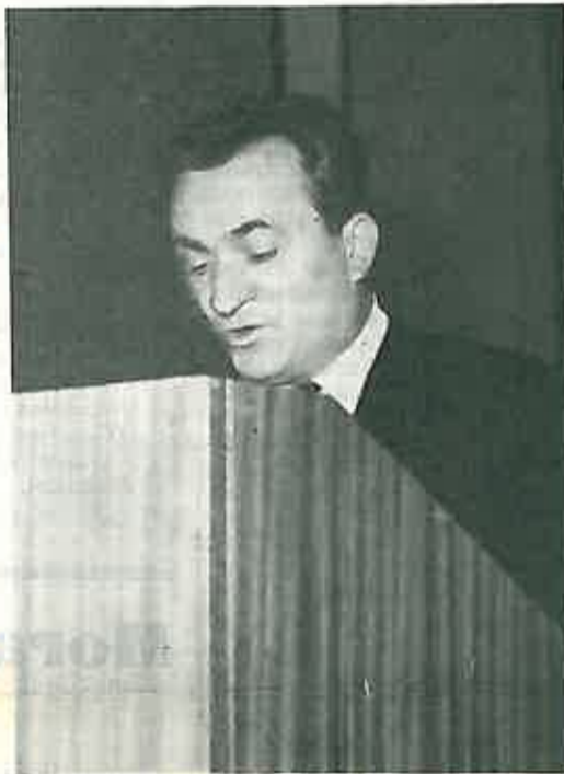
SREĆKO BIJELIĆ GOVORI KOMUNISTIMA DUGOSELJSKE KOMUNE

Član Izvršnog komiteta CK SKJ drug SREĆKO BIJELIĆ posjetio je 30. svibnja 1968. općinu Dugo Selo. Tom prilikom obišao je gradilište Šljuncare u Nartu, Institut za oplemenjivanje bilja u Rugvici i pogone »Agrokombinata« u Božjakovini, te se upoznao s problemima i perspektivama razvoja tih radnih kolektiva.