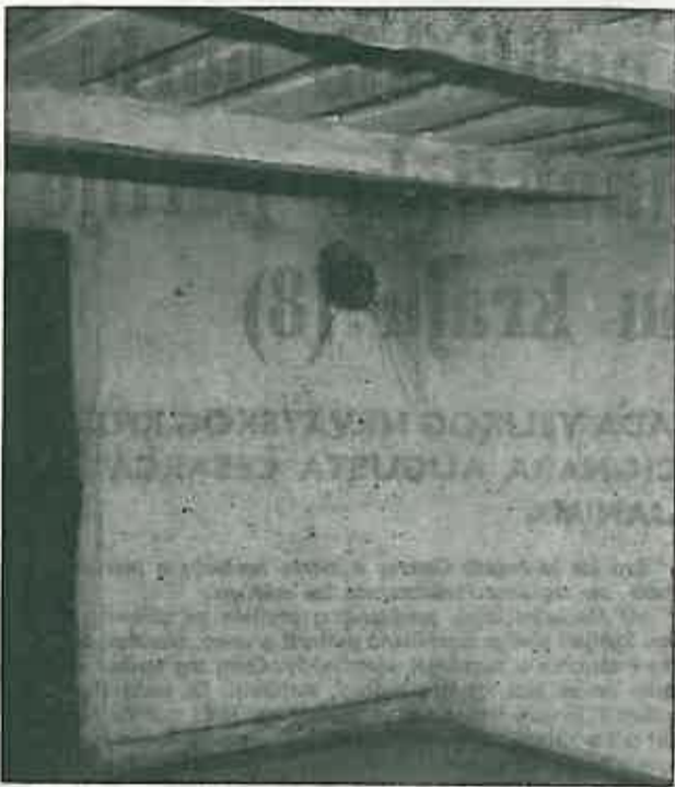
OVAKO DANAS IZGLEDA SOBICA NA TAVANU KUĆE BROJ 27 U BRCKOVLJANIMA GDJE JE ŽIVIO I PISAO AUGUST CESAREC I GDJE SU SE SASTAJALI ČLANOVI CK KP JUGOSLAVIJE.

Koristeći svoja ranija urednička iskustva, Cesarec je želio da list oprijimi što više karakter društvenog glasila, kako bi se u neprijed osujetila nastojanja policije da ga zabrani. Zato je list i počeo izlaziti, s datumom od 1. listopada 1932. godine, pod nazivom »Glas Trešnjevke« tjednik za komunalna, socijalna i kulturna pitanja zapadne periferije (...). Od 14. siječnja 1933. list obuhvaća probleme i ostalih predgrađa, te nakon provedene ankete sa čitocima, mijenja naslov i izlazi kao »Glas, tjednik za komunalna, socijalna i kulturna pitanja periferije«. Cesarec je u ovom listu objavio svoju pripovijest »Na gradskoj tržnici«. Cenzura je svakog tjedna zabranjivala pojedine stupce, stranice i napokon čitave brojeve lista. Pod kraj prve godine izlaženja »Glas«, redakcija i njezini brojni saradnici bili su