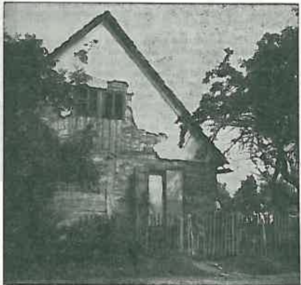
U OVOJ KUĆI U BRCKOVLJANIMA KBR. 27 ŽIVIO JE I RADIO AUGUST CESAREC. GORE NA TAVANU VIDE SE DVA PROZORA GDJE JE STANOVAO I PISAO SVOJA ZNACAJNA DIJELA I GDJE SU SE SASTAJALI ČLANOVI CENTRALNOG KOMITETA KP JUGOSLAVIJE.