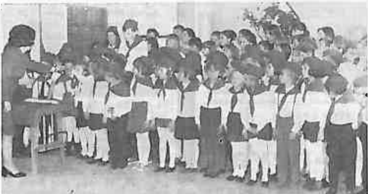
SVEČANI TRĒNUTAK — POSTAJEMO PIONIRI

I zaturbi pionirska truba, zabubnjaše bubnjevi. Jedan