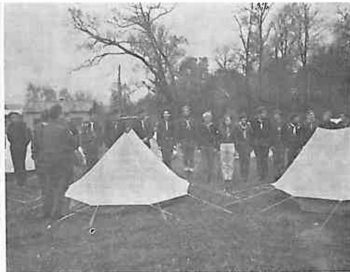
STARJESINA DRAGO KARAS VRSI SMOTRU DIJELA ODREDA IZVIDACA U PODIGNUTOM PRIHVATNOM LOGORU ZA EVAKUACIJU STANOVNIŠTVA