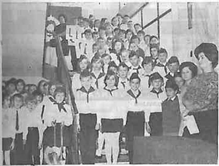
PIONIRI PRED ZAKLETVU

pionir dođe preda me i reče: »Druže načelnice, daci prvog razreda su spremni da polažu zakletvu! Nakon tih riječi u