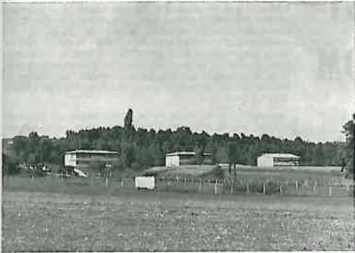
Pogled na zavod

Zavod poziva sve socijalne i društvene radnike da pomognu našoj djeci, da se još više svi zajedno založimo u radu kako bismo izvršili našu humanu misiju za zadovoljstvo djece, roditelja i društvene zajednice.