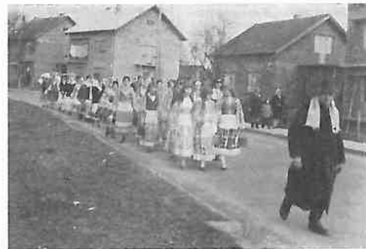
Oborovski Novaki sa nošnjom i ženskim koscima upotpunili su šarenilo karnevalske povorke.