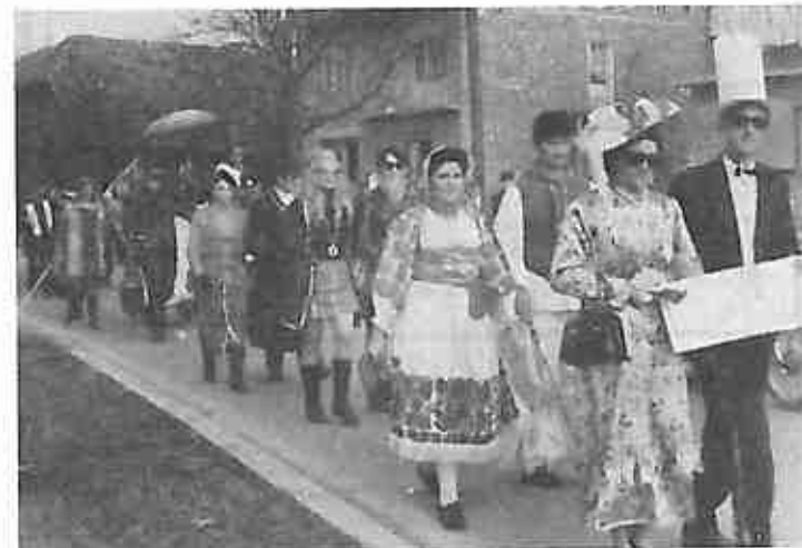
Ne može se reći da Oborovo sa svojom svadbom i izgranicima iz raja nije bilo impozantno. Međutim, ipak je to znatno ispod onog što Oborovo može dati.