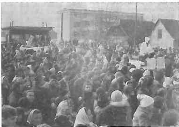
Prepun prostor ispred sajmišta u Dugom Selu, na kome se stilo nekoliko hiljada ljudi, sam za sebe najbolje govori o tome kako je publika prihvatila karnevalsku povorku.

sudac, posebno zbog toga što nisu bile sve propozicije unapred dovoljno razrađene i objašnjene, a isto tako i žiri se u potpunosti nije držao propozicija, jer je očito da nije glasao za jednu tačku nekog sela, već za selo u cjelini uzevši u obzir sve tačke koje je to selo predstavilo kao npr. Ivanja Rijeka, Lupoglav.