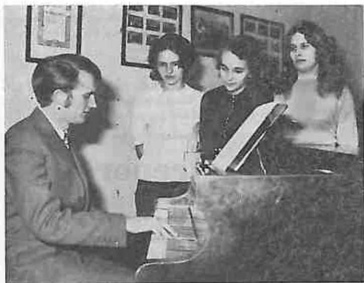
U dvorani kina »Preporod« održana je 5. III 1971. godine priredba u čast Dana žena. Učestvovali su učenici Osnovne škole »Stjepan Bobinec-Šumski«.

Ostali smo s njima do kraja probe — i vjerujte — nije nam žao!