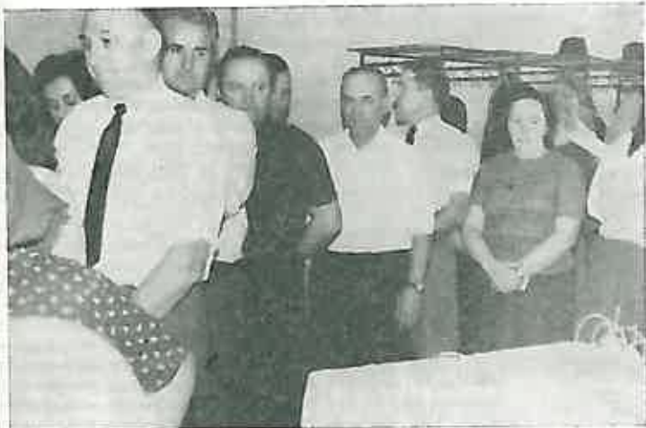
Grupa redovnih davaoca čeka na davanje krvi