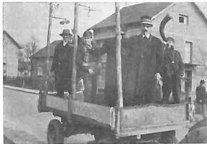
Lupoglav je bio najmasovniji. Teme su im bile veoma aktuelne. Radio-stanica Dugo Selo koju su demonstrirali Lupoglavci cijelo vrijeme povorke davala je šaljive vijesti iz naše općine. Vjerojatno je i to odlučilo da prema ocjeni žirija Lupoglav osvoji drugu nagradu. Na slici uspjela ironija javne rasvjete u Lupoglavu i Prečecu, gdje su pored sijalica na stupovima jedino sredstvo za osvjetljavanje puteva »lampaši«.