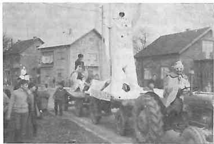
Prvo nagrađena je Ivanja Rijeka. To selo je učestvovalo s nekoliko veoma uspjelih tačaka. Na slici usporedba današnjice gdje istovremeno egzistiraju i astronauti koji lete na mjesec i drveni plug.