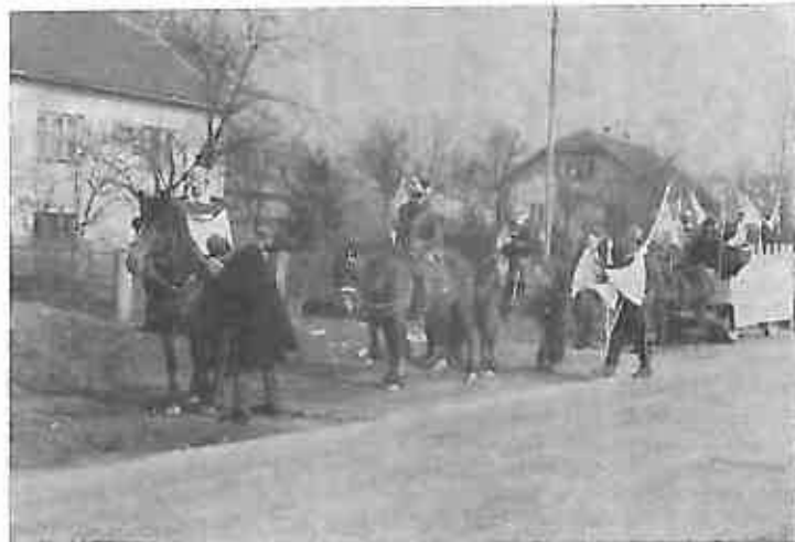
Nikola Subić Zrinski sa svojim vojnicima i zarobljenim turčinom osvojio je treću nagradu Rugvičkom Crncu. Neposredno je da je ta grupa bila najljepše obučena, najdotjeranija. Tema im nije bila toliko aktuelna, ali mislim da treba jače pozdraviti nego što je to učinio žiri, nastojanje Rugvičkog Crncu da vanjskom izgledu dađe takav efekt, da bi se ta maska mogla pojaviti veoma dobro primljena u bilo kojem gradu. Mislim da Dugoselski fašnik treba upravo tom vanjskom izgledu posvetiti i kod drugih grupa mnogo više pažnje.