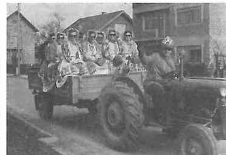
Zene Okunščaka prikazale su lijepu našu posavsku nošnju. Istina malo su ju karikirale, modernim taškama i tamnim naočalama. Kakve su bile cipele ili opanci nismo vidjeli zbog visokih stranica prikolica.