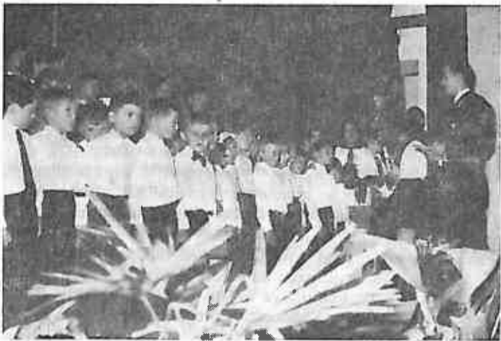
Poaganje pionirske zakletve