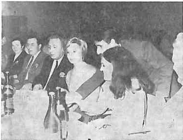
»Uzvanici za vrijeme proslave»