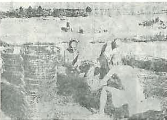
Izmučeni i izgladnjeli zatočenici pleću košare — jedan od blažih formi robovskog rada u Jasenovcu.

obrtom bio sam potpuno zbunjen i tek poslije prvog zaprepaštenja mogao sam kroz njegovo ricanje i čudne animalne zvukove da razumijem kako govori: