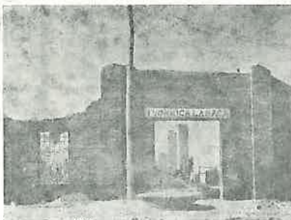
Takozvana lančara — predratna tvornica lanaca u Jasenovcu, zgrada u kojoj su deseci hiljada izmučenih, gladnih i prozeblih zatočenika bez konca i kraja radili pod krvničkim nadzorom ustaša.

— Doktore, k'o boga te molim, pomoz mi! Ja znam da sam kukavica i ne mogu sam sebi ove muke prekratiti jednim hicem iz revolvera. Ni klanje, ni mučenje, ni najsvireplija zlostavljanja logoraša više mi ne pomažu; ne pomaže mi više ni ispovijest, ni molitva logorskog bratra Brekala; ne pomaže ni razvrat sa ženama, ni piće, ni orgijanje do besvijesti; ništa mi više ne pomaže.