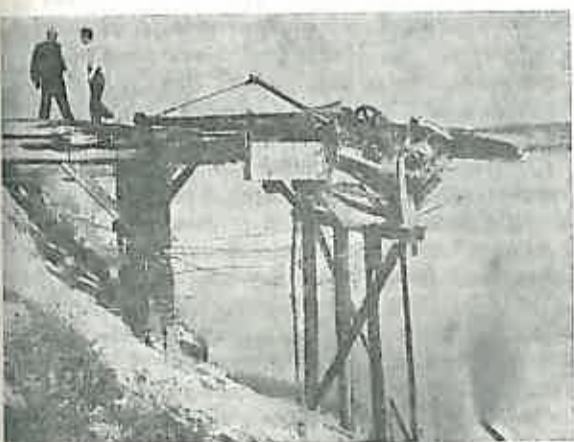
Takozvani granik — stara dizalca na obali Save, jedno od mjesta užasa u Jasenovcu na kojem su ustaše nožem i batom pobili hiljade zatočenika, a leševe bacili u Savu.

Poslije ove čudovišne ispovijesti, Žile je najednom umukao, unazvjereno se zagledao negdje u daljinu, sav se ukočio i tako jedno vrijeme ostao kao neka skamenjena figura. A zatim su mu se počeli nepravilno trzati mišići na licu; očima je počeo