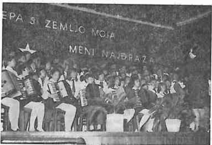
Zbor osnovne škole »Stjepan Bobinac — Sumski« za vrijeme prijema u pionirsku organizaciju malih prvaka.