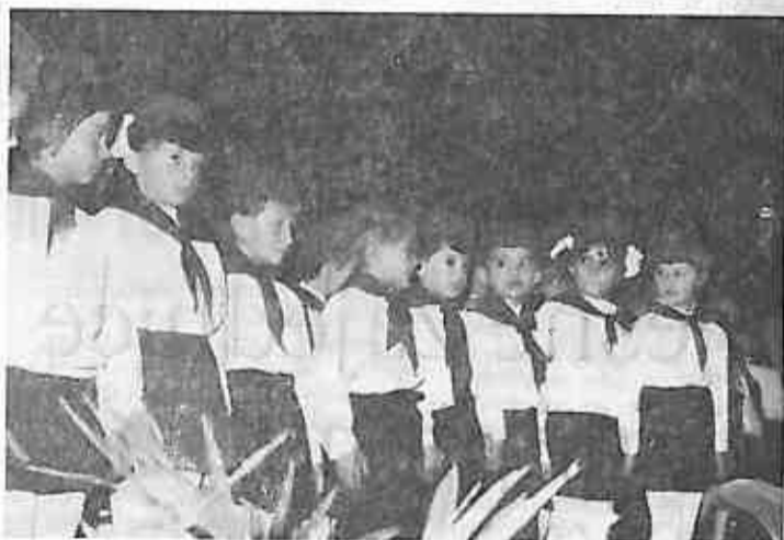
Pioniri Osnovne škole nakon položene zakletve