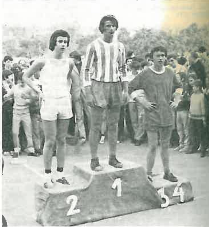
5. Konkurencija omladinaca do 18 godina.