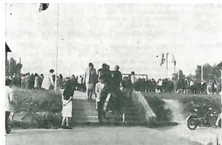
2. Predstavnici društvenih organizacija odlaze na polaganje vijenaca palim borcima.