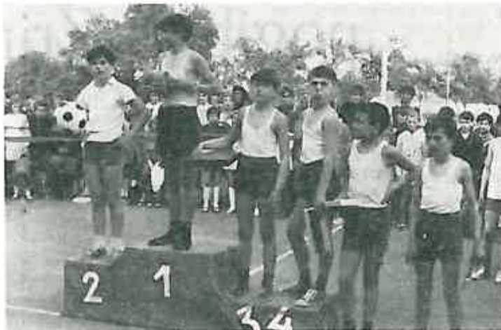
7. i 8. U konkurenciji đaka Osnovnih škola Dugo Selo i Rugvica.