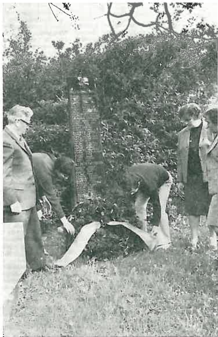
3. Polaganje vijenaca pred spomenik palim borcima NOR-a.

Kao i svake tako i ove godine tradicionalnom Trkom oslobođenja proslavljen je dan oslobođenja Dugog Sela.