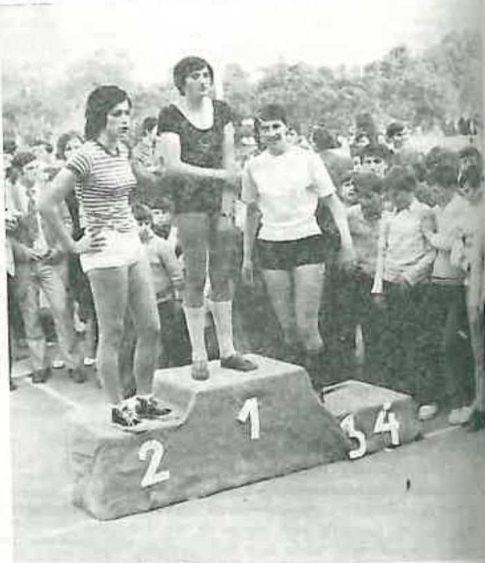
6. Plasman u konkurenciji omladinki