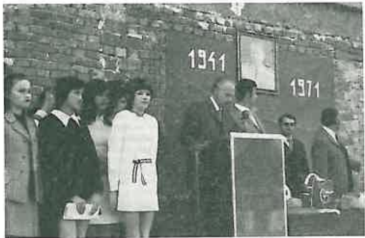
1. Predsjednik Skupštine općine Dugo Selo otvara Trku oslobođenja Dugog Sela