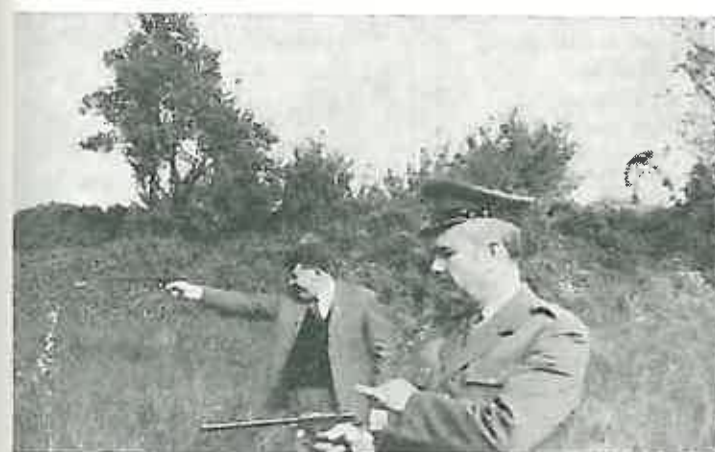
Na vatrenoj liniji ekipa D. Selo

Svake godine pa i ove, radnici Stanice javne sigurnosti iz Dugog Sela, Sesveta i Zeline a u povodu svoga praznika organiziraju razna sportska takmičenja.