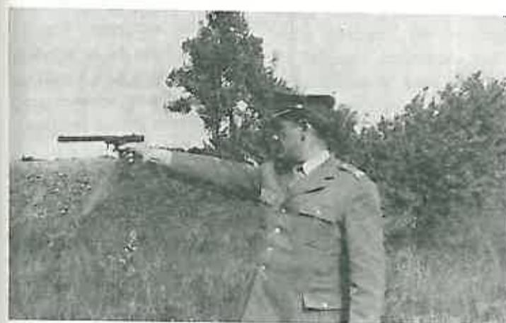
Na vatrenoj liniji član ekipe D. Selo