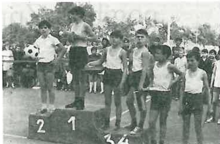
7. i 8. U konkurenciji đaka Osnovnih škola Dugo Selo i Rugvica.