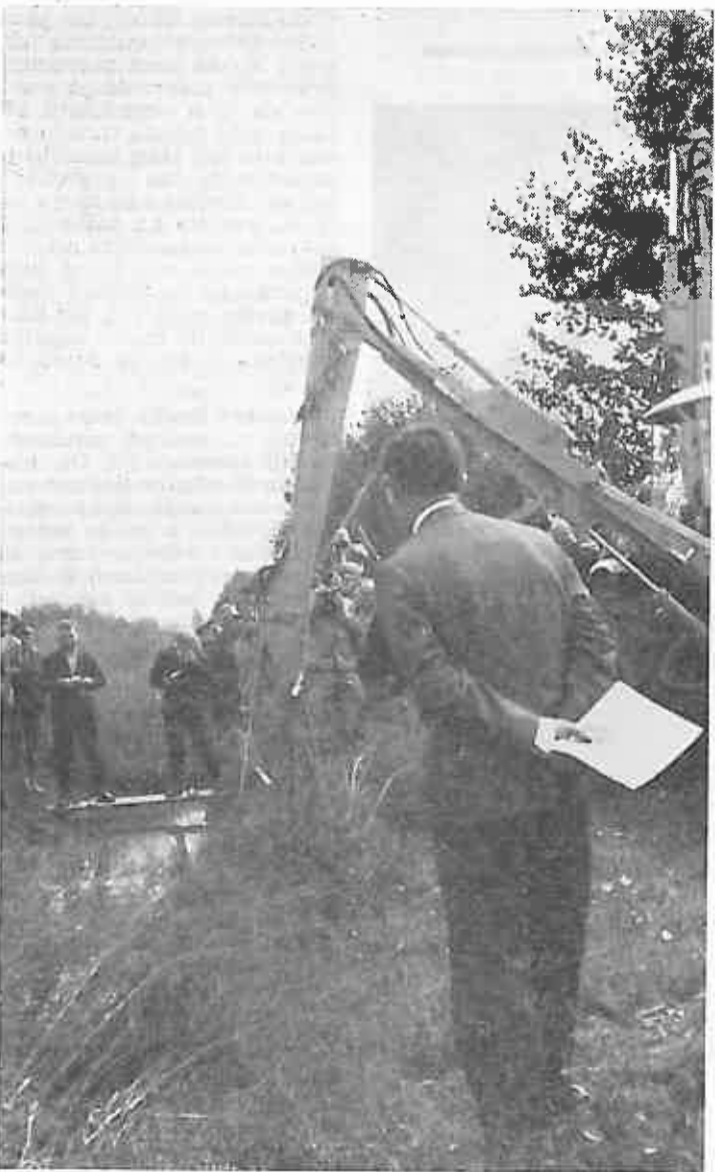
Demonstracije u Brodskom Stupniku sa priključkom za čišćenje pokosa od rastlinja

Svake godine kod izrade godišnjih operativnih planova Vodna zajednica „Gornja Lonja“ Dugo Selo surađuje sa mjesnim zajednicama na cijelom području na kojem kao takova djeluje. Ovdje neće biti riječi o suradnji po tom pitanju, već o suradnji o nekim konkretnim akcijama za koje su zainteresirane sve mjesne zajednice. Naime radi se o tome, da Vodna zajednica nastoji sa svojom stručnom službom i organom upravljanja koliko je to u mogućnosti sa financijske strane da unaprijedi i tehničku stranu kako bi zadovoljila momentalne potrebe stanovništva na cijelom području. Pored već postojeće opreme za odvodnju ova zajednica nabavila je jedan novi stroj za tehničko čišćenje postojećih objekata i održavanje istih (čišćenje graba, kanala itd.) Riječ je o jednom holandskom rješenju o jednom stroju koji se priključuje na traktor »Zetor« koji se na njega pričvršćuje i vrši sve radove koji se odnose na uređenje i čišćenje uličnih i poljskih graba to jest odvodnje. Ovaj stroj može se lijepo vidjeti na priloženim fotografijama na izvođenju radova u Mjesnoj zajednici Ježevu.