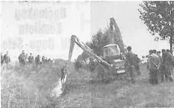
Demonstracije u Brodskom Stupniku sa priključkom za čišćenje pokosa kanala