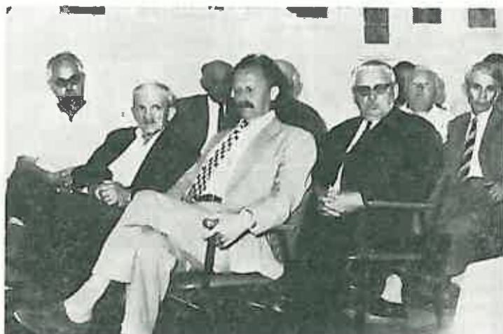
Učesnici i odlikovani na svečanosti prilikom predaje odlikovanja