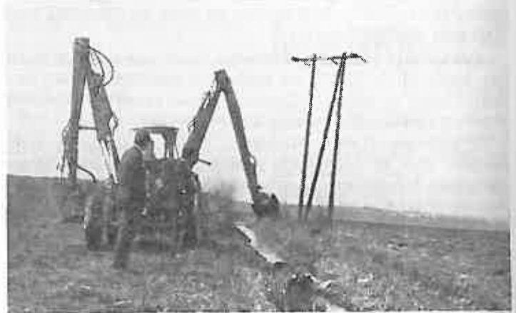
Demonstracije održane u Dugom Selu kod Duge Lazine sa kašikom za iskop zemlje i mulja, te sa košarkastom kosilicom za košenje šaša i silenog rastlinja. Demonstraciju je održala Vodna zajednica Dugo Selo.