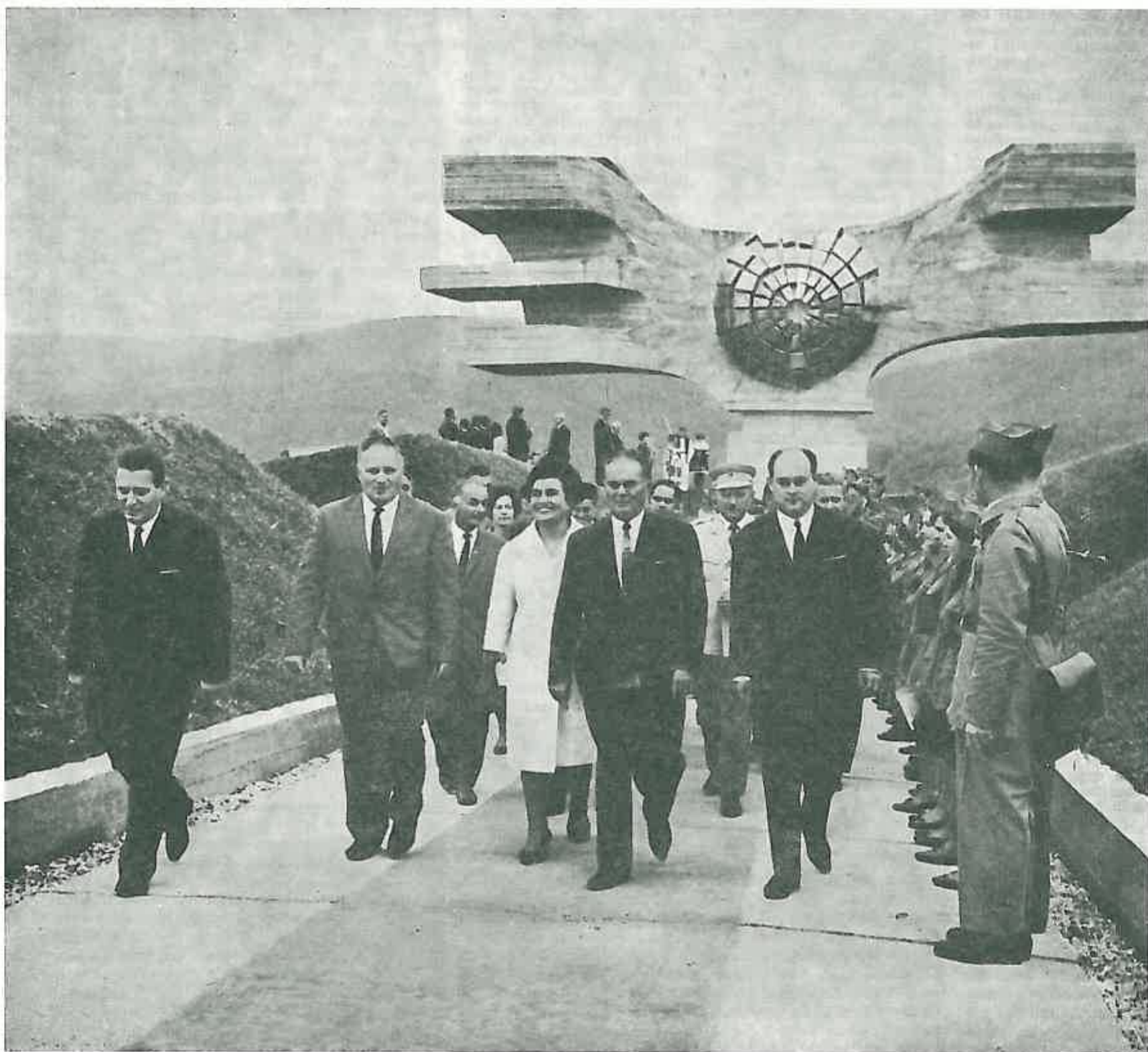
Spomenik Narodne revolucije u Podgariću