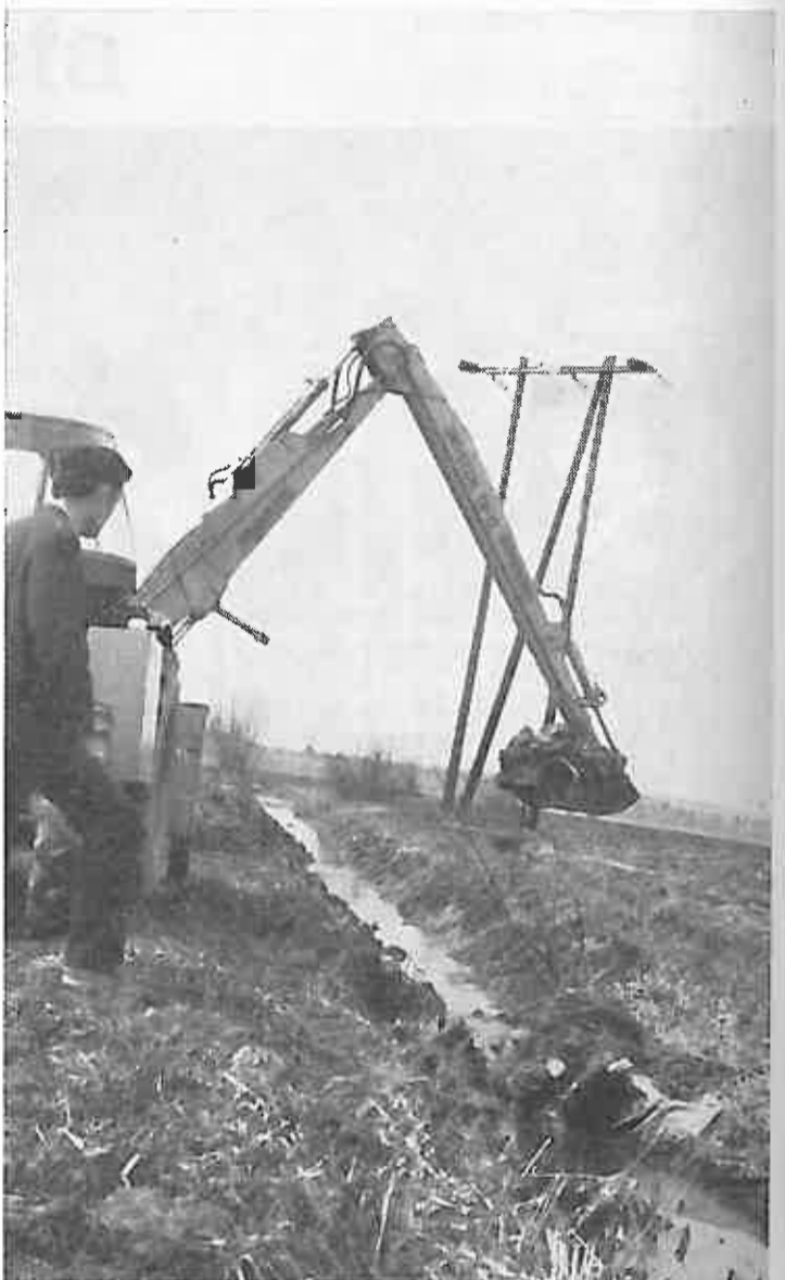
Demonstracije održane u Dugom Selu kod Duge Lazine sa kašikom za iskop zemlje. Demonstraciju je održala Vodna zajednica Dugo Selo.