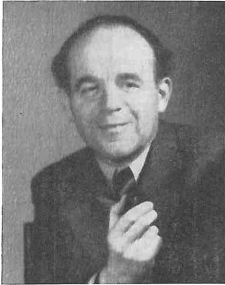
Hrvatski književnik i borac Slavko Kolar. Ovu sliku mi je poklonila njegova supruga Milica nekoliko dana prije svoje smrti

završava Više gospodarsko učilište u Križevcima. Kolar u to vrijeme seli po potrebi službe iz mjesta u mjesto i to iz Božjakovine u Petrinju iz Petrinje u Zagreb gdje je bio vještbenik zemaljske vlade od 1915. do 1919. godine, kada je kao stipendista poslan u Francusku na specijalizaciju u voćarstvu i vinogradarstvu.