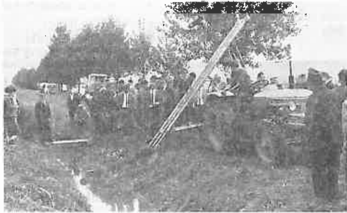
Demonstracije sa rezačem obala, održane u Brodskom Stupniku, a kojima je pored predstavnika vodoprivrednih organizacija prisustvovao i konstruktor iz Holandije.