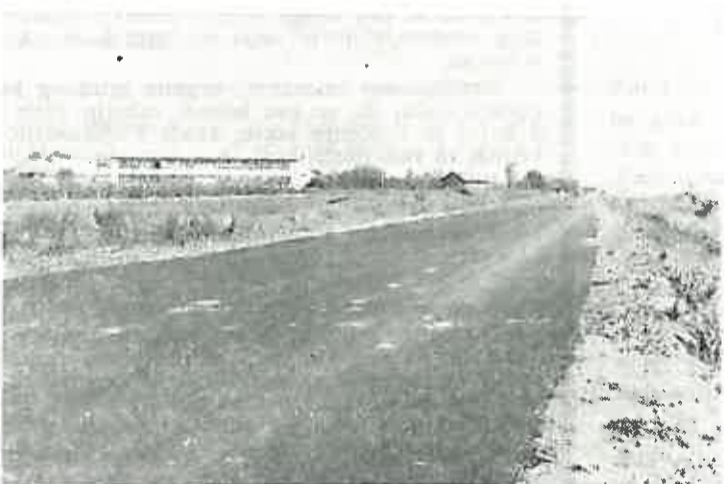
Konačno gotova Oborovska cesta do sela Preseka. Oborovci očekuju nastavak izgradnje.