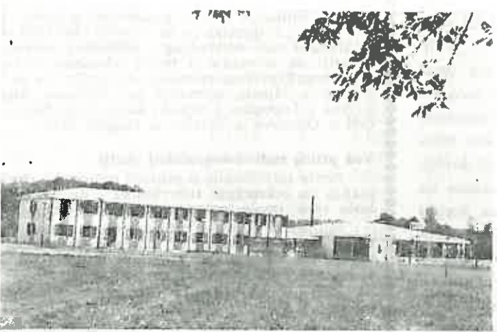
Unutarnji dio filmske dvorane Osnovne škole »Stjepan Boblnac Šumski« u Dugom Selu. Na slici se vidi samo prilazni hodnik dvorane, koja je u završnoj fazi