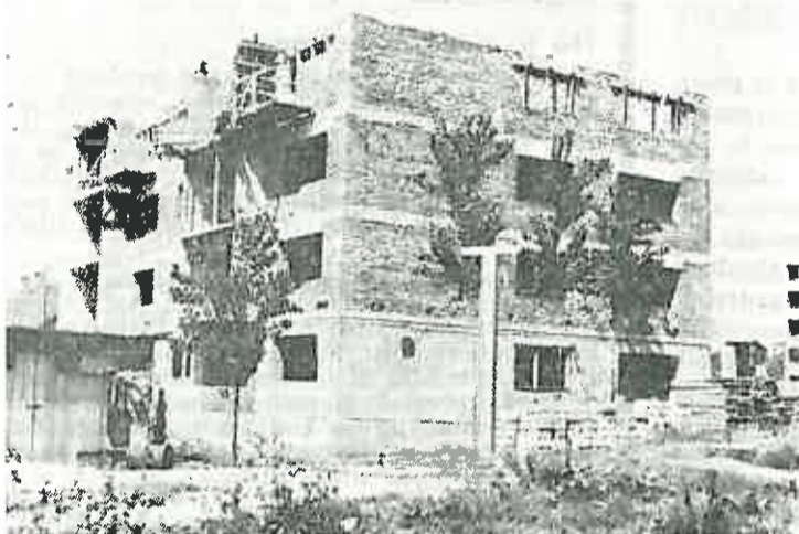
Stambena trokatnica u Cobovićevoj ulici koja se izgrađuje za poduzeće »Gorica«. Predviđeno je 14 stanova veličine 55 m 2 . Ukupna vrijednost zgrade 250.000.000 st. din.