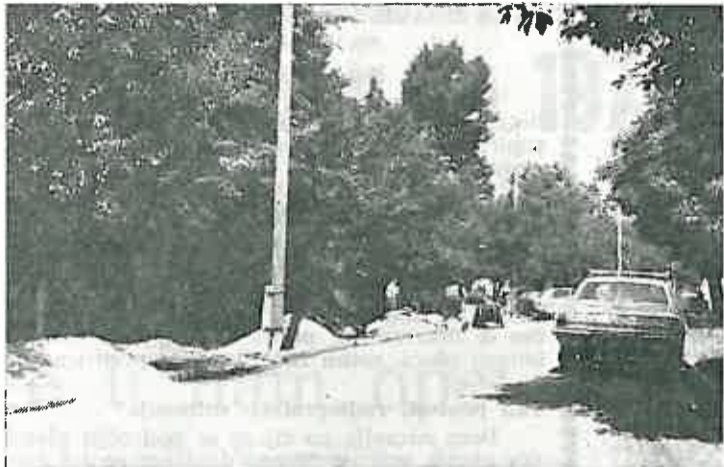
Komunalno poduzeće »Progres« Dugo Selo, izgrađuje nogostup u Cobovićevoj ul. Investicija za izgradnju iznosi cca 65.000,—