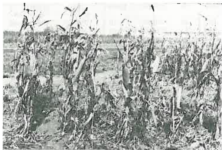
Kukuruz Instituta za oplemenjivanje bilja nakon nevremena.

sirati za protugradnu obranu koja je bila prošle godine zamisljena, ali je baš od dijela Posavine i njezinih birača propala jer nisu bili zainteresirani. Nakon ovoga nevremena svakako je procjena da je učinjeno mnogo više štete nego bi iznosili troškovi protugradne obrane, koji prema prošlogodišnjoj kalkulaciji nisu