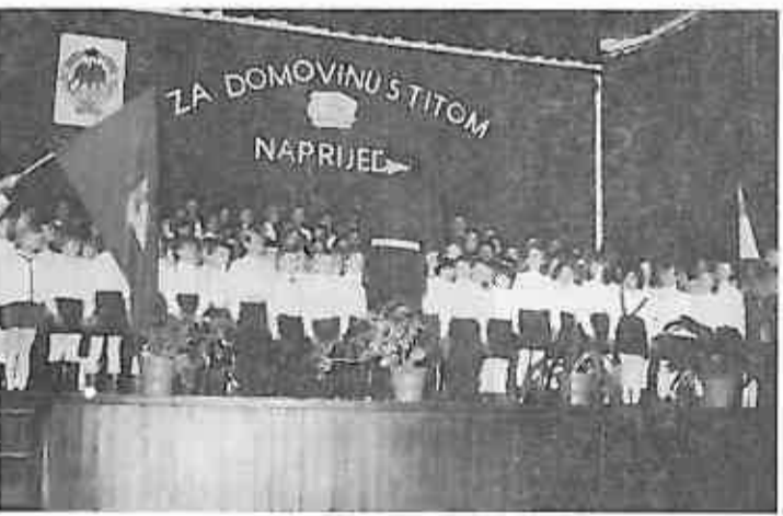
Polaganje svečane zakletve