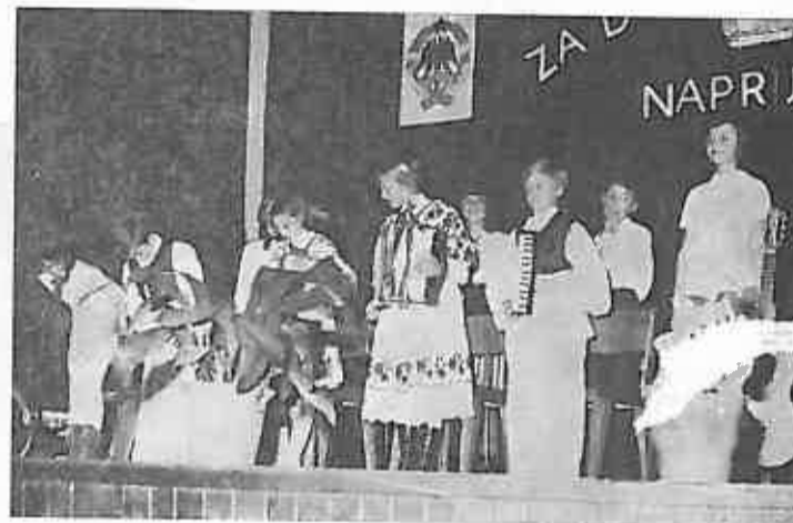
Nastup muzičke grupe Osnovne škole »Stjepan Bobinec-Sumskić«