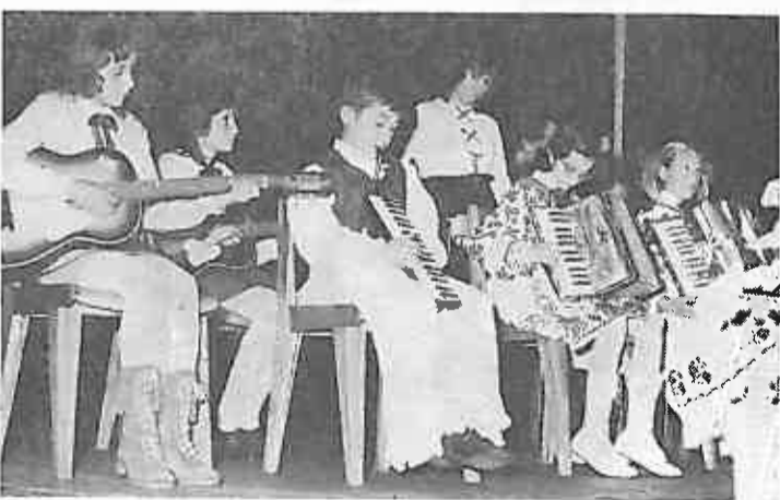
Učenici četvrtih razreda odavirali su pjesmu »Zeleni se gaj« i »U gori raste zelen bora«