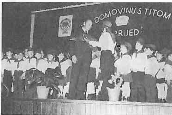
Održavši govor malim pionirima direktor Osnovne škole Dugo Selo, primio je buket crvenih karanfila u znak zahvalnosti