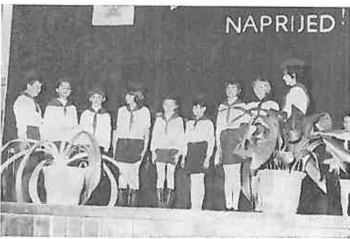
Grupna recitacija učenika trećih razreda