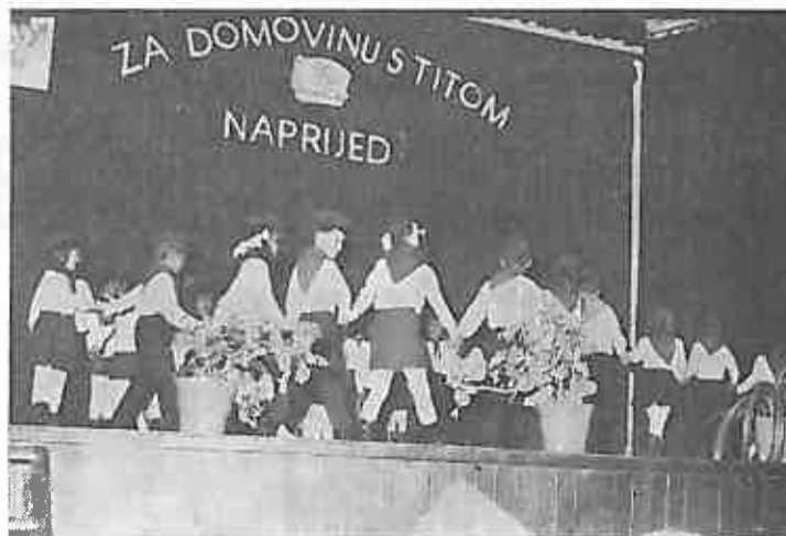
Učenici trećih razreda izvode kolo »Pioniri maleni«