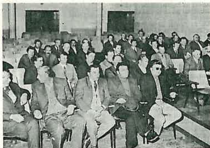
Gotovo kompletan rezervni starješinski kadar prisustvovao je svečanosti