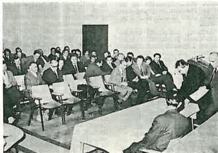
Sudionici svečane sjednice u čast 20. obljetnice SRVS u Dugom Selu