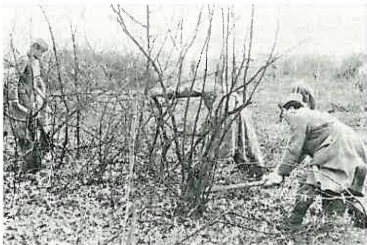
Zbunje je brzo nestajalo pod zamasima sjekira...