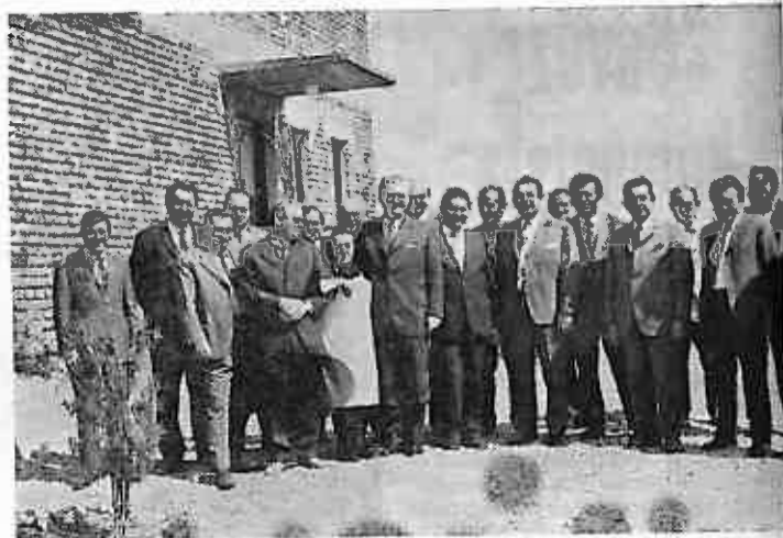
Sudionici svečanog otvorenja lupoglavke veterinarske ambulante — 7. travnja 1973.

svima koji u nju gledaju da ju privedu svrsi, jer je lijepa, zračna, moderno sagrađena i sa malim investicijama useljiva. Često prigovarano i tražimo slobodne prostore a prostor nam se nudi. Vjerujemo da ovakvog prostora ima i u drugim mjestima iako je Lupoglav kao najveće selo poznato po tome da su