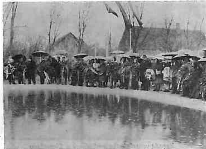
Polaganje vijenaca u spomen palim borcima