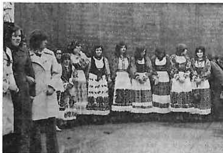
Omladinke Posavine u narodnim nošnjama