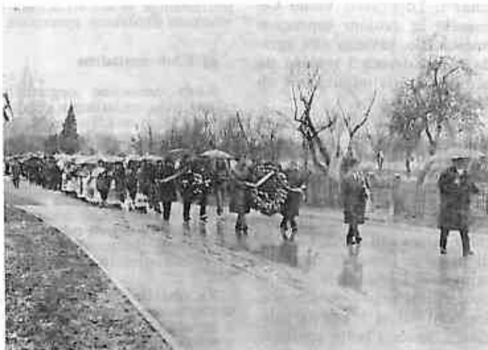
Duga povorka kretala se prema kosturnici palih boraca