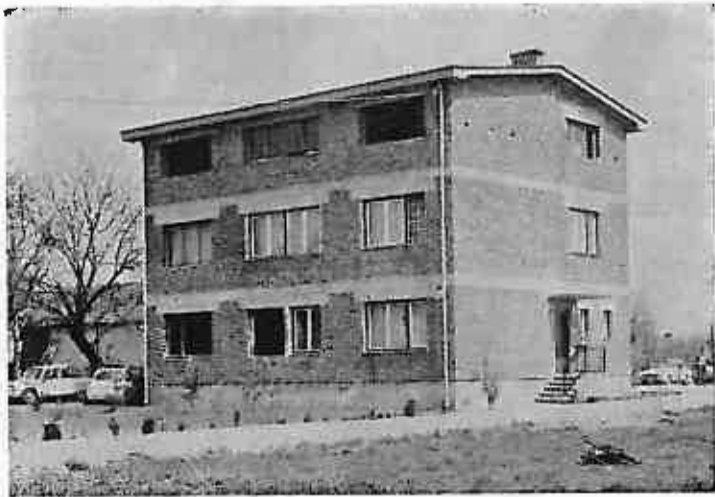
Zgrada veterinarske ambulante u Lupoglavu