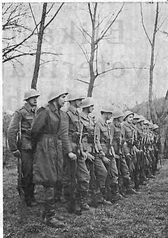
Počasni vod pripadnika JNA na svečanosti