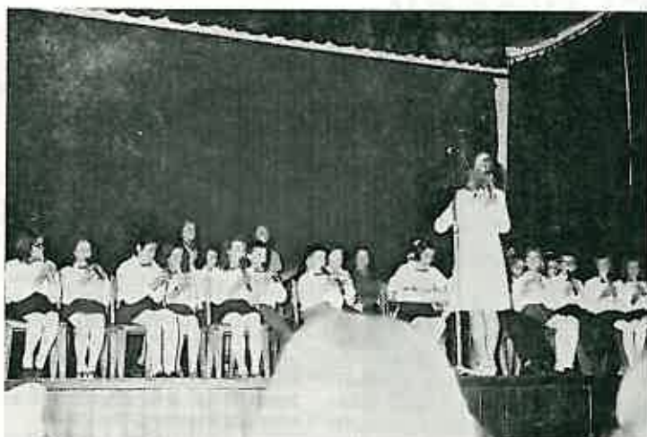
Mali glazbenici — instrumentalisti Osnovne škole »Stjepan Bobinec — Šumski« svirali su vrlo efektivno pod rukovodstvom svoje nastavnice