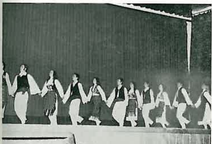
Folklorna sekcija Osnovne škole iz Dugog Sela izvela je na svečanoj akademiji popularnu narodnu igru pod nazivom »Glamoč«