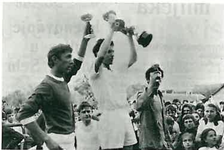
Trojica prvoplasiranih trkača u trci na 3000 m