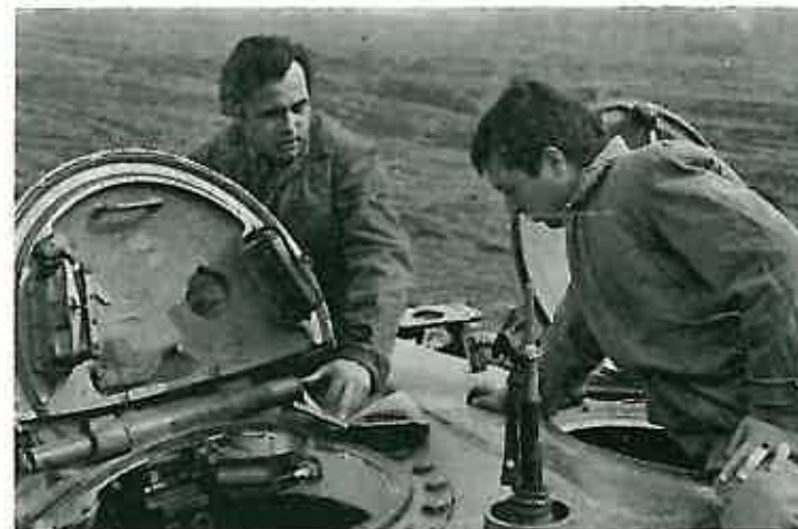
Obuka na licu mjesta: »Zar nisam bio u pravu?! Vidiš što piše u priručniku...!«