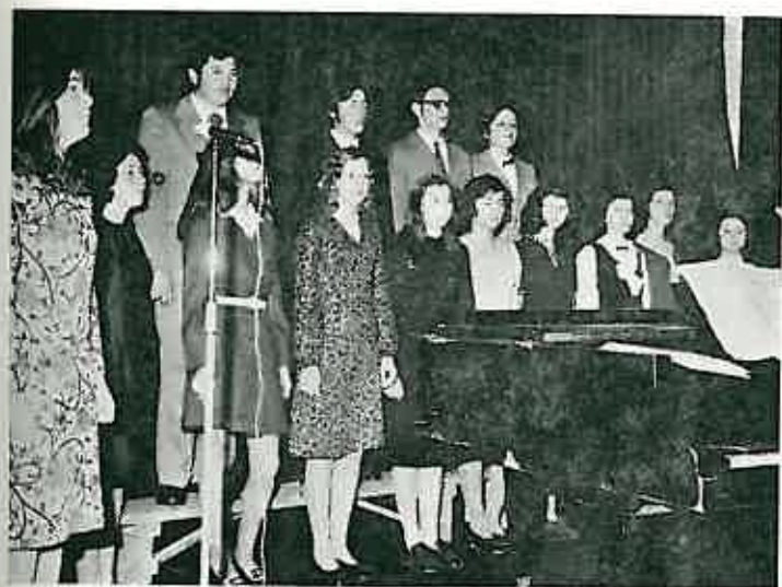
Solistička pjevačka grupa Kulturno — prosvjetnog društva »Preporod« iz Dugog Sela na prvosvibanjskoj svečanoj akademiji