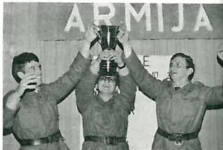
»SMB« trojka nije skrivala radost zbog pobjede na kvizu

— Moglo je biti i bolje da smo bili spremniji u prvim etapama. Trema je naš veliki malar, i to nas je dosta dugo pratilo; oslobodili smo se pri kraju kad je već bilo kasno da učinimo više od ovoga. Toliko smo željeli prvo mjesto i to nam se u neku ruku osvetilo, naime, bili smo pod tim dojmom i to nam se u neku ruku osvetilo. Moja škola ima priliku da iduće godine popravi plasman, ali mislim da nisam neskrumna ako kažem da je treće mjesto isto tako velik uspjeh u dosta jakoj konkurenciji. Trebalo bi u idućem kvizu uvести eliminiranje ekipa od samog početka, nešto kao kup sistem, pa neka ostanu dvije u finalu u borbi za naslov naj-