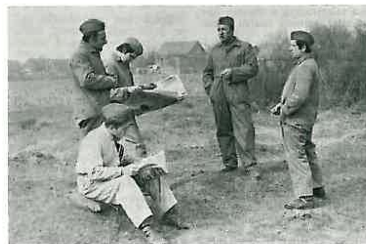
»Deset minuta voljno!« Ovaj predah za vrijeme napornih vježbi rezervistima je došao kao naručen...