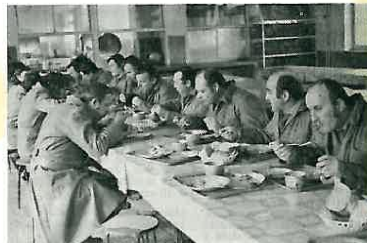
Ručak u trpezariji nakon napornog radnog dopodneva odlično je prijao