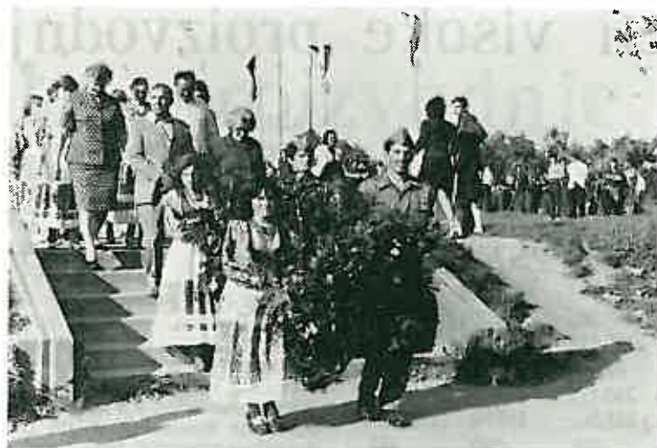
Polaganje vijenaca u čast palih boraca

Članovi kluba trebaju svakog petka do 18 sati donijeti golubove natjecatelje pred Takmičarsku komisiju s popisom u knjizi (obrazac 1).