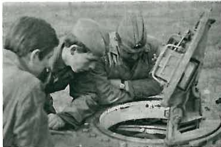
Rezervisti su s velikom pažnjom pratili rad posade u »utrobi« tenka