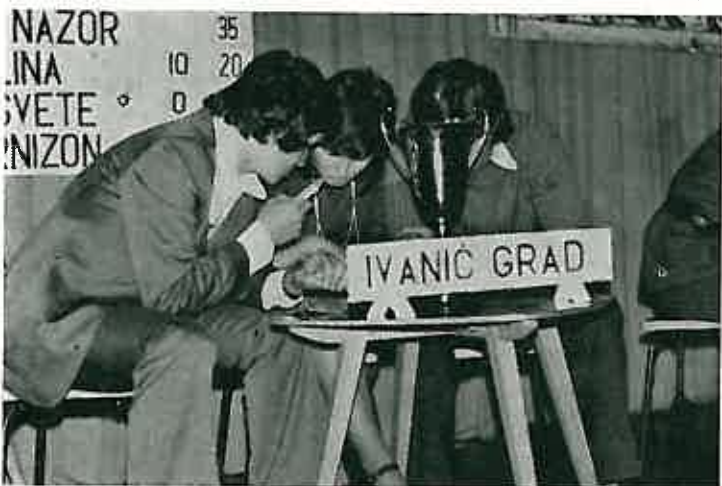
Članovima ekipe iz Ivanić-Grada »za dlaku« je izmaklo prvo mjesto

Poresni organ nakon primitka porezne prijave od obveznika po stvarnom prihodu donosi rješenje o razrezu poreza koje se temelji na podacima iz porezne prijave. Međutim, poresni inspeksijski organi u toku godine za koju se vrši oporezivanje, a i nakon toga vrše kontrolu i ispituju točnost navoda u poreznoj prijavi i ako utvrde da su usmeni podaci netočni donosi se novo rješenje o razrezu poreza s time da primjenjuju novčane kazne koje nisu baš male.