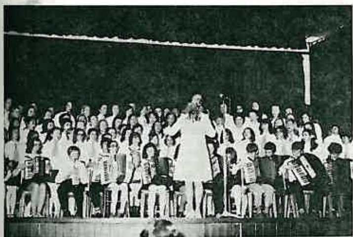
Veliki vokalno — instrumentalni zbor Osnovne škole »Stjepan Bobinec — Šumski« oduševio je sudionike svečane akademije u Dugom selu svojom uvježbanošću