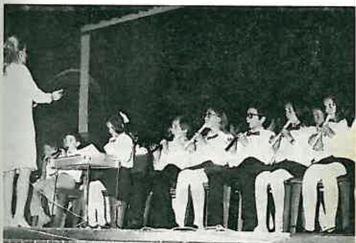
Na prvosvibanjskoj svečanoj akademiji imala je vrlo zapažen nastup i instrumentalna sekcija Osnovne škole »Stjepan Bobinec — Šumski« iz Dugog Sela