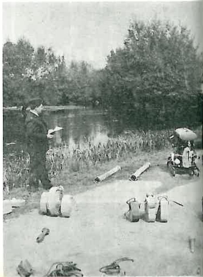
Detalj s jedne od uspješnih vatrogasnih vježbi na Crncu.

Mjesni komitet sastaje se prema potrebi, a najmanje jedanput mjesečno.