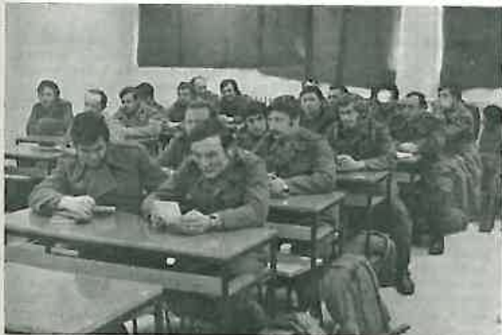
»Da se podsjetimo na neke teoretske stvari, pa ćemo onda s tenkovima na poligon...!«