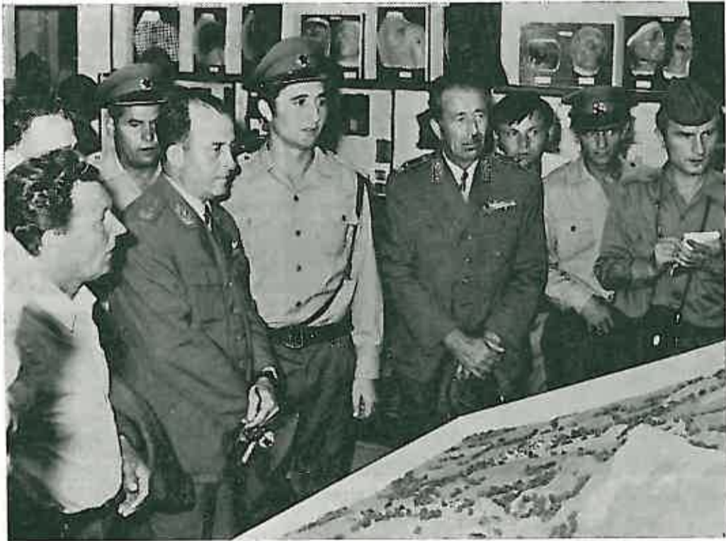
Gosti i uzvanici, u pratnji svojih domaćina, vojnika dugoselskog Garnizona, s velikim zanimanjem razgledali novoootvoreni ABH kabinet