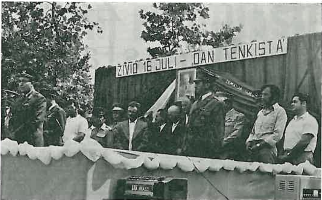
U povodu 16. srpnja — Dana tenkista čestitao je vojnicima dugoselskog Garnizona njihov praznik generalmajor FILIP JANDRIJEVIĆ