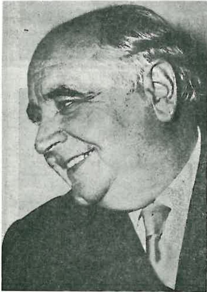
Suvremeni hrvatski i jugoslavenski književnik MIROSLAV KRLEŽA

Miroslav Krleža rođen je 1893. godine u Zagrebu, gdje je završio 4 razreda gimnazije, a zatim je pohađao Vojnu kadetsku školu u Pečuhu i Vojnu akademiju u Budimpešti. Godine 1912. bježi iz Vojne akademije i želio se priključiti srpskoj oslobodilačkoj vojsci, ali ga nisu primili tj. odbijen je pod sumnjom da je austrijski špijun. Već tih godina počinje objavljivati svoja velika djela.