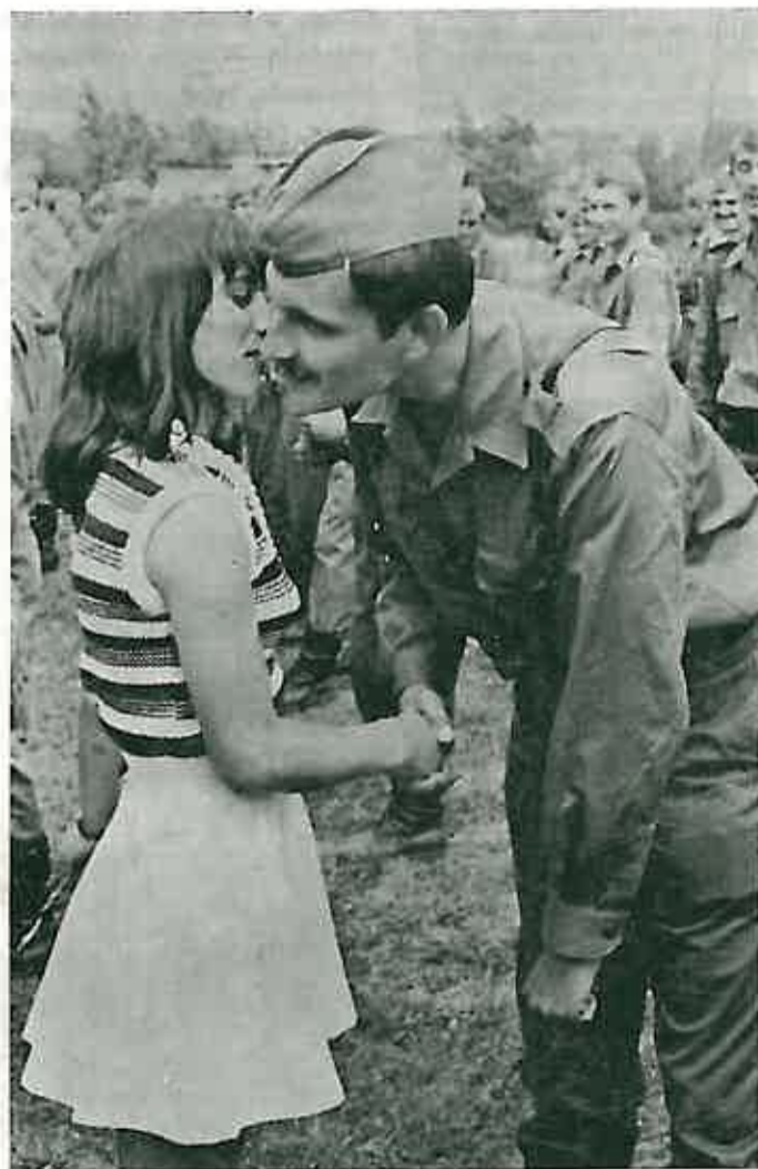
Iskreno djevojačko čestitanje uz crvene karanfile

DRUŠTVENO-POLITIČKE ORGANIZACIJE I SKUPŠTINA OPĆINE DUGO SELO UPUĆUJU VELIKE ČESTITKE GARNIZONU JNA I NJENOM KOMANDANTU POVODOM DANA TENKISTA