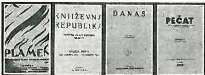
Naslovne stranice časopisa »Plamen«, »Književna republika«, »Danas« i »Pečat« koje je uređivao i izdavao Miroslav Krleža, koji su bili potpuno lijevo orijentirani i oko kojih su se okupljali mladi i napredni književnici

Krleža je primljen u Komunističku partiju 1920. godine, da bi 1939. godine bio isključen radi toga jer se protivio mnogim nazadnim stavovima na književno-teorijskom i filozofskom području. Borio se protiv dogmatizma u znanosti i umjetnosti i dostojanstveno branio slobodu umjetničkog stvaranja. Krleža je bio među rijetkima u međunarodnim razmjerima i u međunarodnom radničkom pokretu koji se kao član Komunističke partije od samog početka suprotstavio dogmatizmu. Krleža je vraćen u Partiju odmah po završetku revolucije.