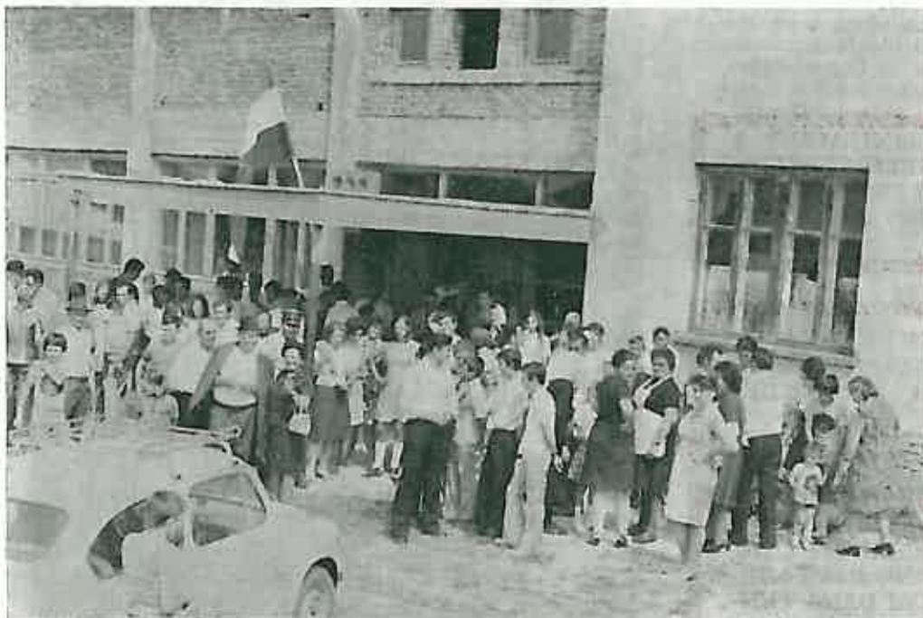
Na svečanom otvorenju Doma kulture okupio se velik broj mještana Lupoglava

Prema predviđanjima, ovoj svečanosti trebalo bi prisustvovati oko 100 uniformiranih vatrogasaca, što će sigurno zainteresirati ostale građane koji će svojim prisustvom uveličati svečanost. Nakon službenog dijela nastavit će se narodno veselje.