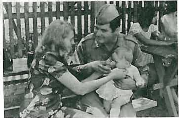
Tata vojnik — na trenutak u krugu svoje obitelji

— Ne mogu to opisati: čini mi se tako kao da smo ja i