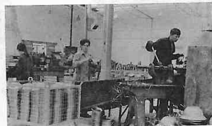
SLIKA BR. 2