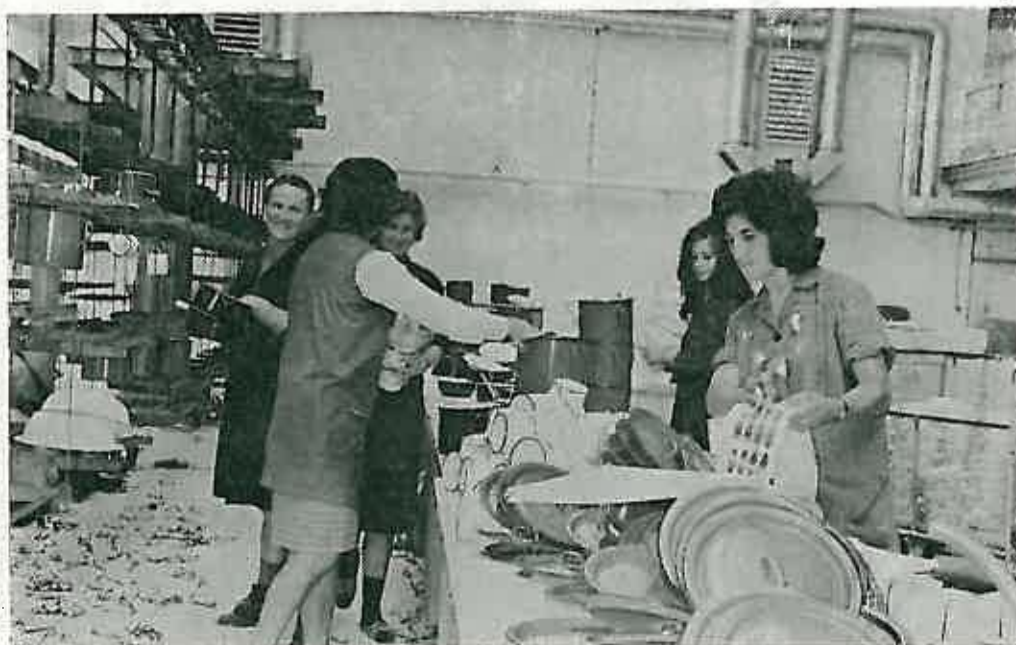
Slika br. 5