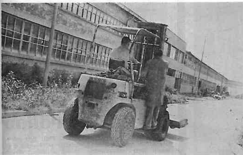
SLIKA BR. 12