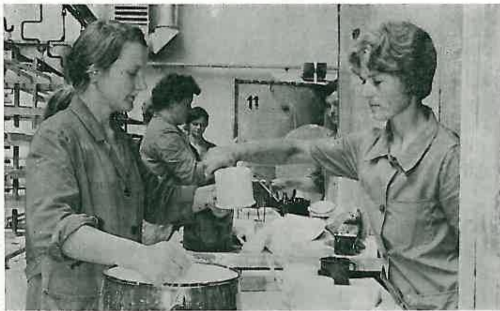
Slika br. 3