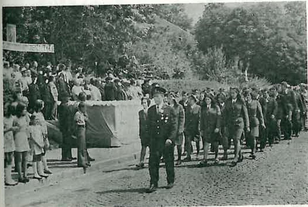
Defile vatrogasnih jedinica Dugog Sela, Sesveta i Zelina u mimohodu ispred svečane tribine