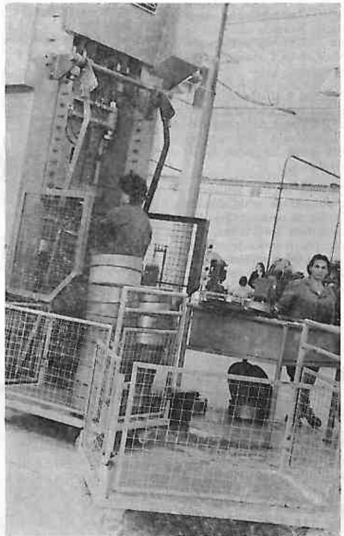
SLIKA BR. 1