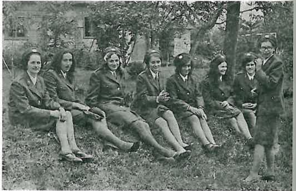
»Protuvatrene djevojke iz Zeline u trenucima odmora...»