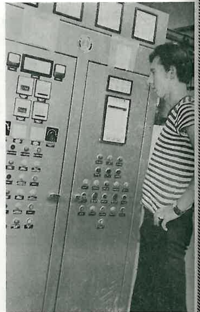
Slika br. 4