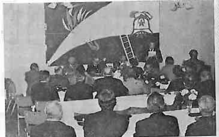
Sa svečane sjednice Vatrogasnog saveza dugoselske općine