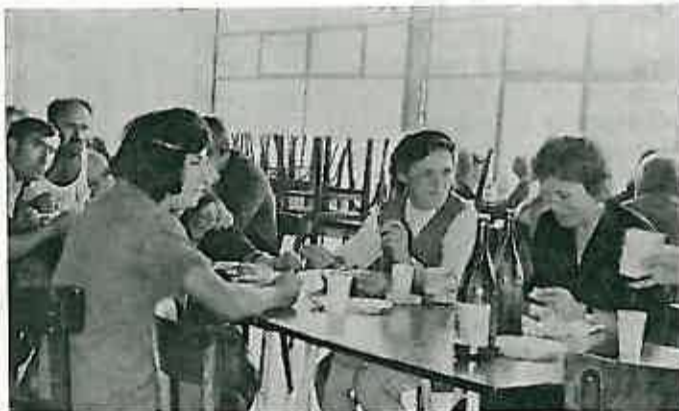
Slika br. 9