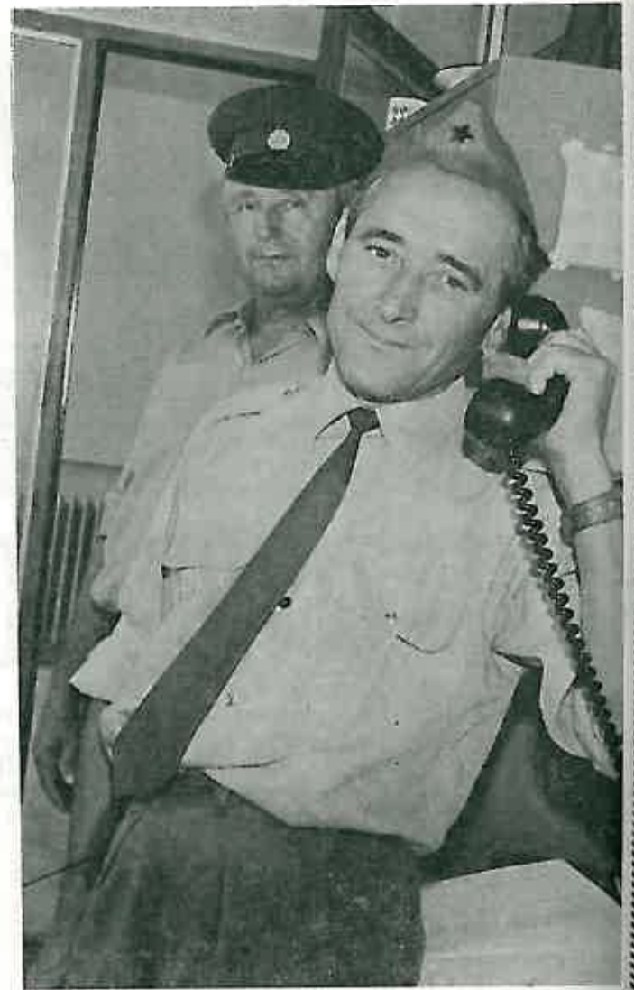
Slika br. 11