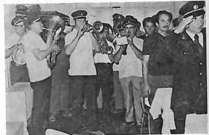
Intoniranje himne pred početak sjednice