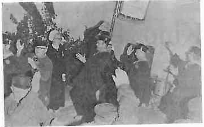
Nizozemski folkloristi u veselom raspoloženju pred svojim domaćinima u Lupoglavu