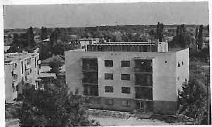
SLIKA BR. 10.