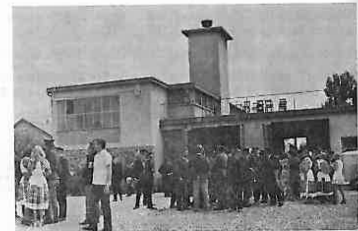
Nestrpljivost sudionika pred svečani minohod