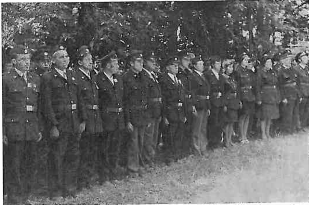
Ravnopravno jedni uz druge: postrojene vatrogasne jedinice djelovale su zaista imponantno