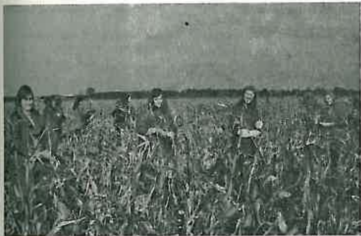
Učenici Osnovne škole iz Rugvice beru kukuruz na »Pilot« — farmi u Ježevu

u se obar e od trud e is- gra- ista lični po- ško- plo- slo- vale, to i eni- naši nim lovi dip- n... ipo- om uno