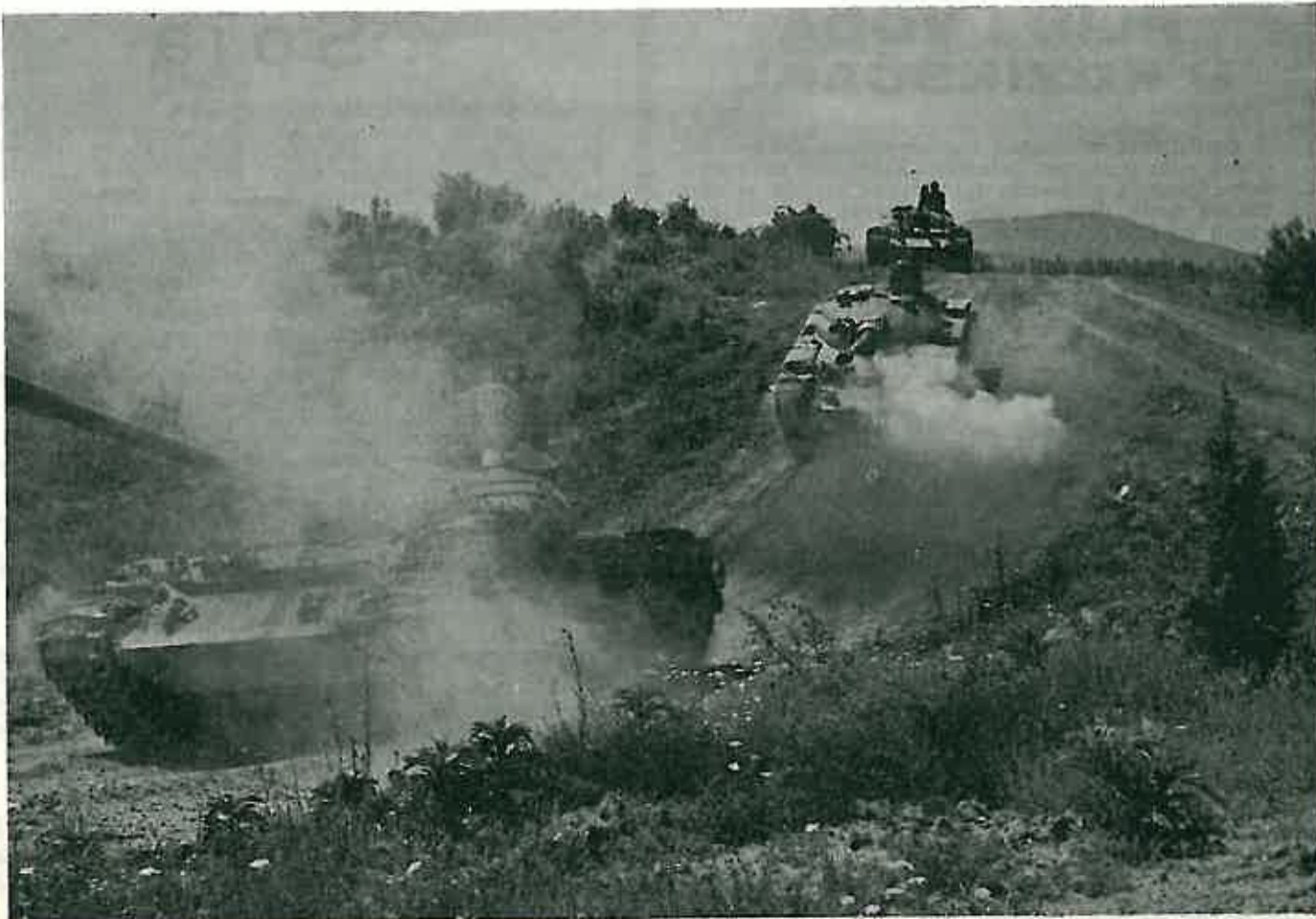
Kolona suvremenih tenkova na jednoj od brojnih vojnih vježbi: tenkovske jedinice predstavljaju posebno efikasnu silu u našoj koncepciji općenarodne obrane

UREDNIŠTVO »DUGOSELSKE KRONIKE« ČESTITA SVIM ČITAOCIMA I GRAĐANIMA SRETNU NOVU 1974. GODINU!