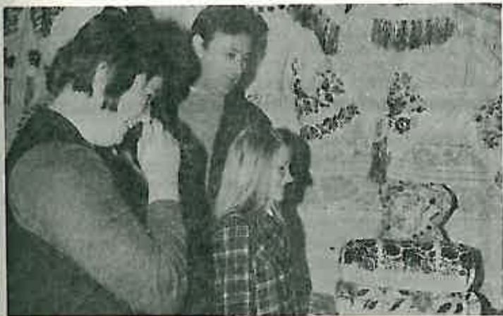
Rukotvorine marljivih Lupoglavki na izložbi