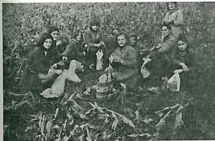
Nakon napornog rada veoma je prijala pripremljena zakuska

Sredinom mjeseca studenoga učenici sedmih i osmih razreda Osnovne škole iz Rugvice, radili su na branju sjemenskog kukuruza na »Pilot« — farmi u Ježevu.