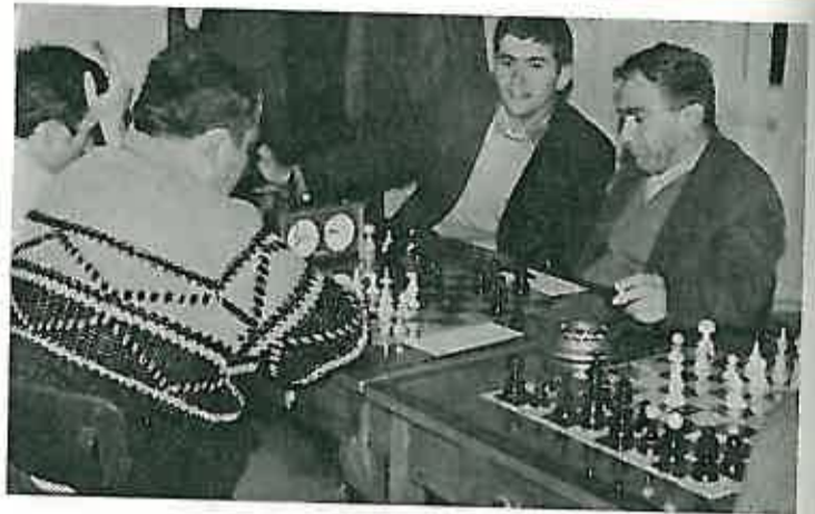
Analiziralo se do kasno u noć...