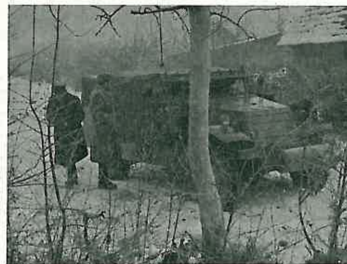
Ovdje je bio smješten štab »crvenih«