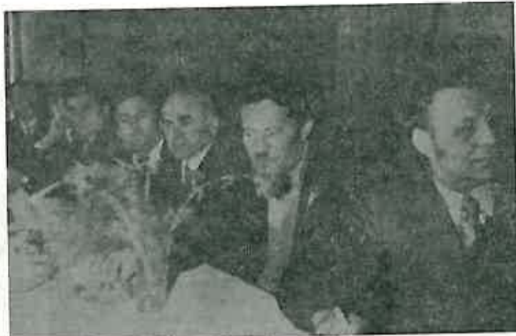
Sudionici svečane sjednice slušaju referat