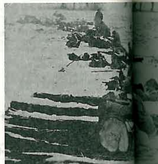
»Crveni« su zauzeli položaje »plavih« i povukli u svoje zadnje borbeno