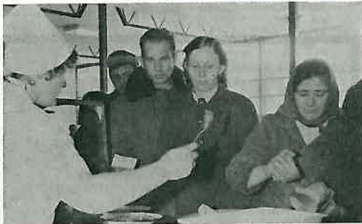
Pred »pultom« gdje se izdaje hrana stvorio se »rep« za vrijeme »gableca«