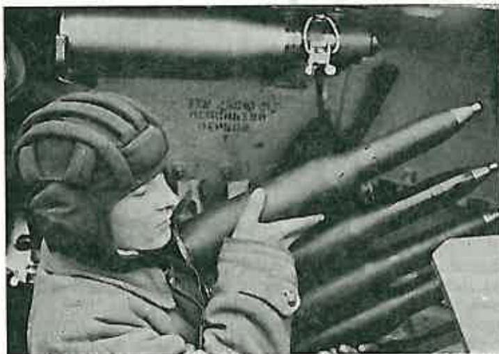
Tenkisti su odigrali posebnu značajnu ulogu: tenkist na redovnom zadatku