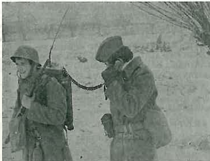
Vezisti obavještavaju s »fronta«