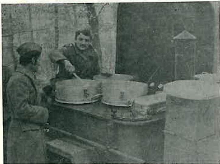
I »crveni« i »plavi« uz — topli obrok