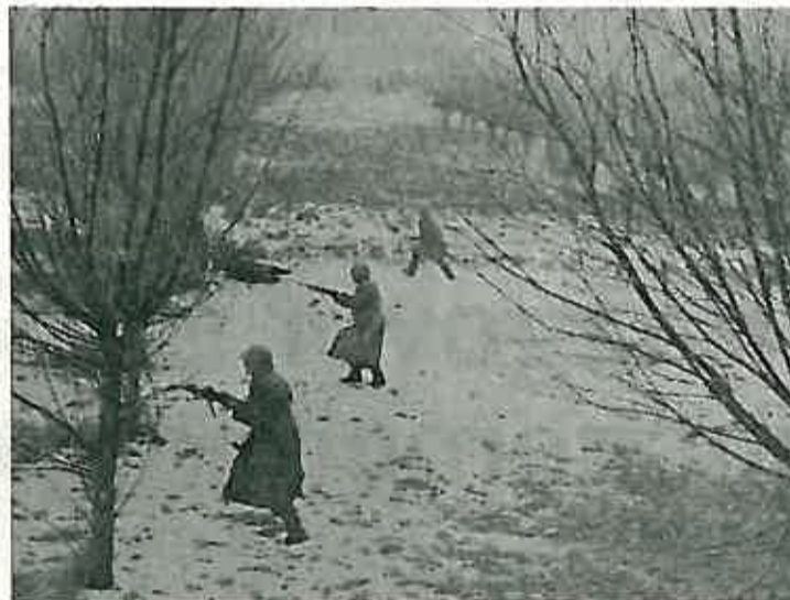
»Plavi« se brane u odstupanju...