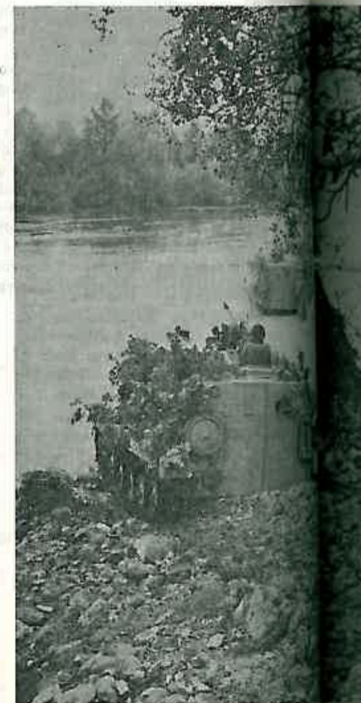
Oklopna vozila »crvenih« forsirajući pri prelasku na »plave«