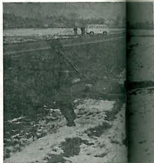
»Plavi« u povlačenju nastoje pokupiti »mrtve« — njihovi su »gubici« uprta