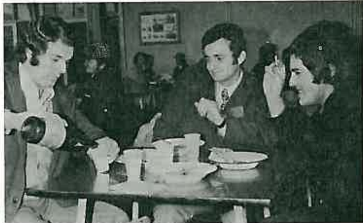
U opao obrok u tvorničkom restoranu prijao je i našim sugovornicima