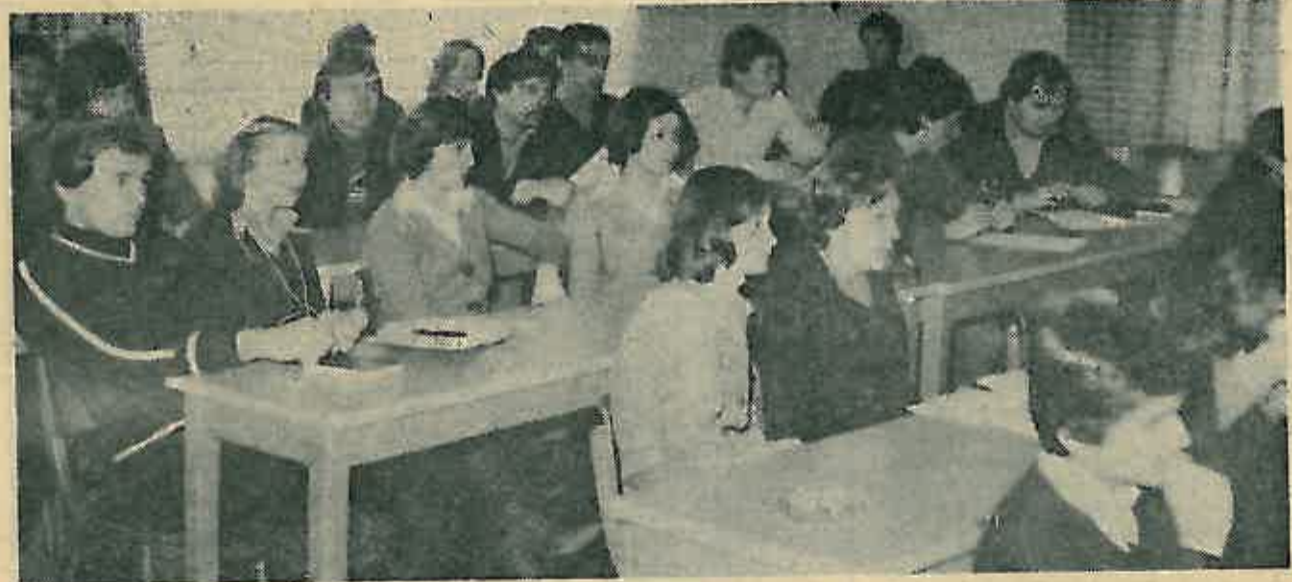
Delegati prate rad sjednice

SSO mora se u svojim akcijama angažirati na temeljnim društvenim pitanjima ne zanemarujući pritom nikad mladog čovjeka i njegove probleme, vezujući svoje akcije uz akcije SK i drugih društveno-političkih organizacija, nastojeći da se problemi koji tište mlade društveno potvrde. Program i aktivnosti najvećeg dijela organizacija moraju se pokla-