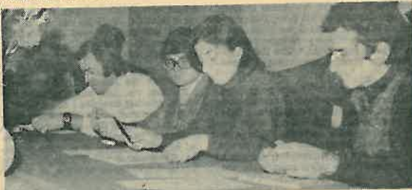
Rukovodstvo izborne sjednice