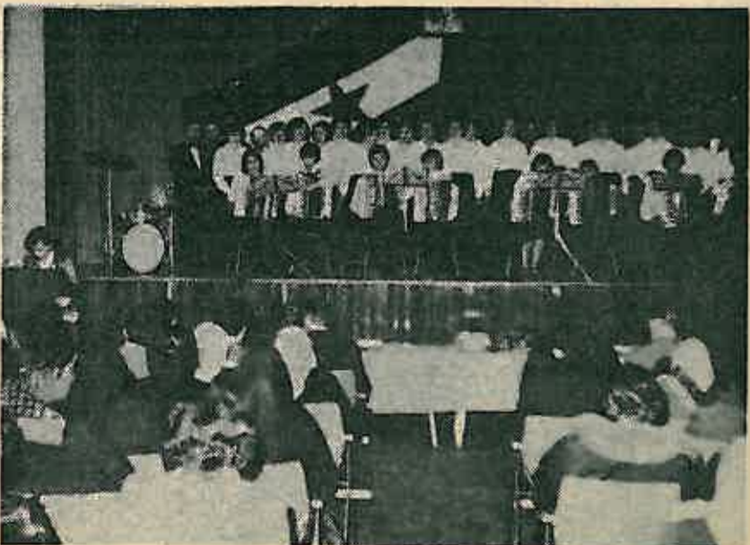
Pracenje programa svečane akademije