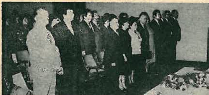
Početak svečane akademije