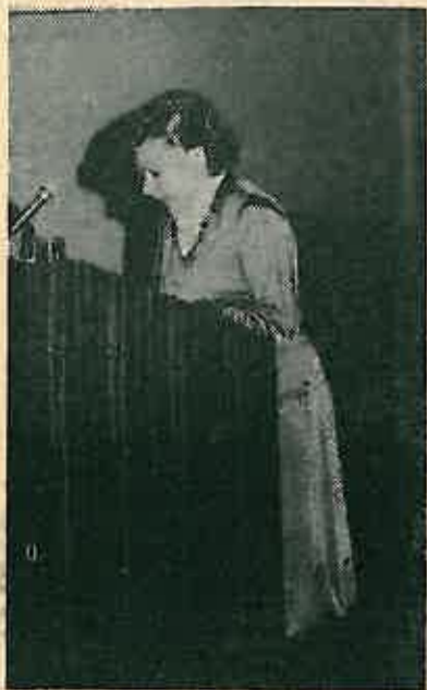
Predsjednik konferencije žena Dugo Selo

(Nastavak s 1. strane) Andrilovac, Kozinščak, Gračec, Stakorovec, Kusanovec, Prikraj, Brckovljani, Lupoglavska Greda, Lupoglav, Prečec, Tedrovec, Prozorje, Hrebinec, Dvorišće, Tvornica posuda »Gorica« i Dugo Selo.