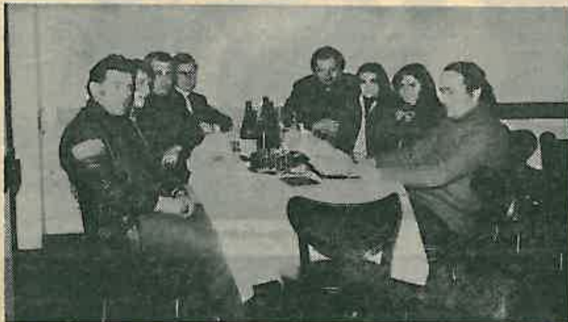
Predstavnici Mjesne zajednice Gračec

Samo mjesto Gračec, koje predstavlja i mjesnu zajednicu, proteže se uz regionalnu saobraćajnicu Zagreb-Bjelovar. Upravo ta saobraćajnica stvara i dosta problema mještanima Gračeca. Cesta koja je opterećena saobraćajem i to pretežno teškim vozilima u samom mjestu, čini sedam velikih krivina što predstavlja poteškoće i za učesnike u saobraćaju, a također i za mještane Gračeca.