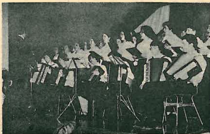
HKUD »Petar Zrinski« iz Vrbovca

Svečanu akademiju upotpunili su prigodnim programom zbor Hrvatskog kulturno-umjetničkog društva »Petar Zrinski« iz Vrbovca i folklorna sekcija KPD »Preporod« iz Dugog Sela.