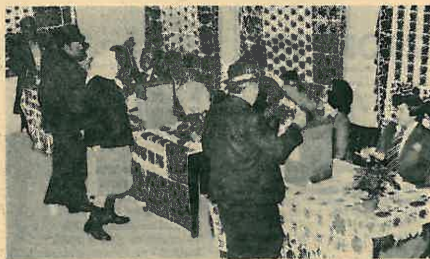
Jeđan od najbolje uređenih biračišta