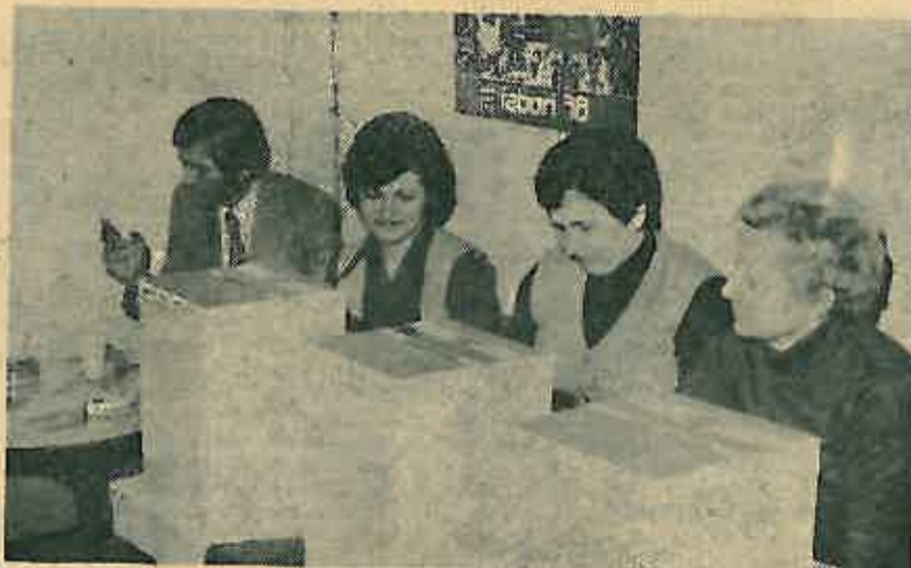
Više glasanja u »Gorici«

DUGOSELSKA KRONIKA — glasilo društveno-političkih organizacija općine Dugo Selo. Izlazi svakog 10. i 25. u mjesecu. Izdavač: Narodno sveučilište Dugo Selo, Ulica braće Bobinec 21-a, tel. 72-319. Glavni i odgovorni urednik: JOSIP HORVAT, Urednik lista HRVOJE MEDIMOREC, Dugo Selo, Lenjinova 12, lektor JOSIP TRNSKI. Uređuje urednički odbor: Ivan Vranić, Hrvoje Medimorec, Marija Belajć, profesor, Moja Crnić, Sijepan Turčinec, Dragutin Jakić, Josip Trupeć i Josip Horvat. Tisak: IBG — tiskara »Zagreb«, Zagreb, Preradovićeve 21-23. Cijena pojedinačnog broja 2,00 dinara. Pretplata tromjesečna 15,00 dinara, polugodišnja 30,00, godišnja 60 dinara (u pretplatu je uračunata i poštarina). Pretplate se šalju na žiro-račun Narodnog sveučilišta Dugo Selo br. 30111-103-8553 kod SDK Dugo Selo. Rukopisi se ne vraćaju.