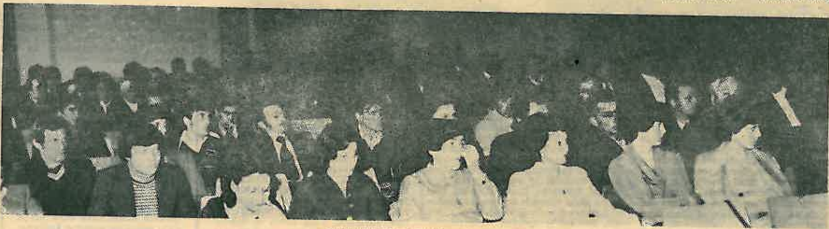
5 godišnjeg zbora radnika u »Kograpu«

te investirat će se, što je i razumljivo na šljunčare u Trsteniku — nabave nove opreme, bager za vadeње šljunka sa dubine preko 40 m, zatim ostatak opreme za eksploataciju šljunka i proizvodnju pijeska i granulata. Predviđa se početi izgradnja i poslovnog prostora za OOUR »Šljunčare Dugo Selo«, te otkup zemljišta za lociranje OOUR-a »Vodovod«, »Plinovod« i »Građevinarstvo« i početak izgradnje garažnog, skladišnog i radioničkog prostora. Najveći dio sredstava već je osiguran, krediti banke, veliki dio će ići iz vlastitih izvora — poslovni fond,