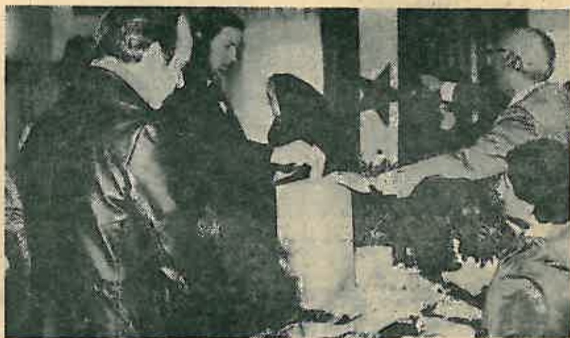
Glasajmo za najbolje