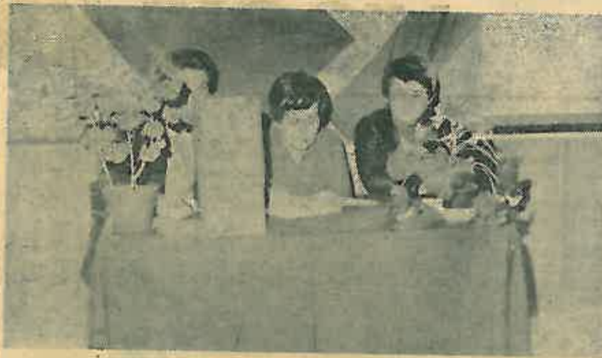
U Vodoprivrednom poduzeću Dugo Selo