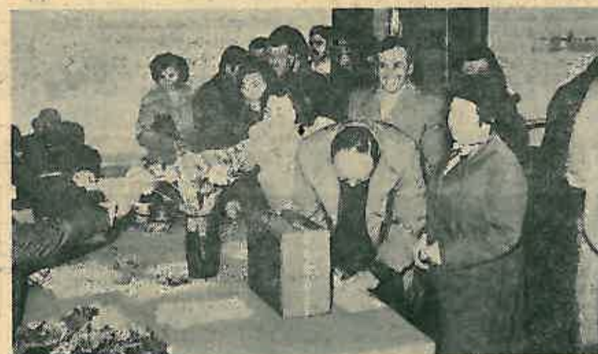
Guzva na biračkom mjestu