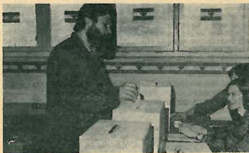
Jeđan od prvih glasača u »Gorici«