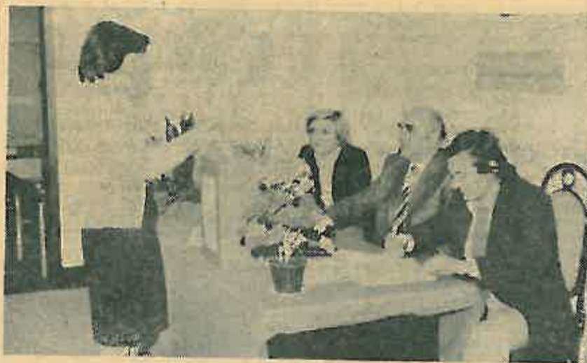
Ovdje je glasalo 100 posto birača