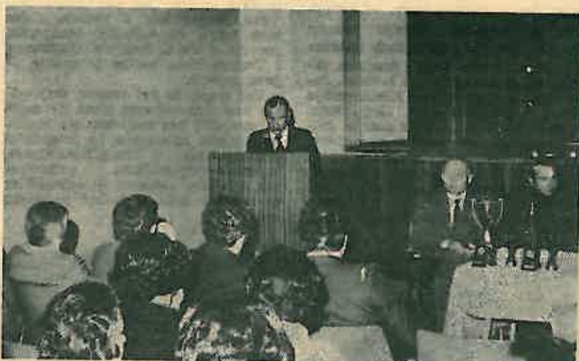
Podnošenje izvještaja o poslovanju

Obračunata amortizacija je u iznosu od 10.098.040 je veća za 9% od planirane za 1978. g. našeg petogodišnjeg plana 1976-80. Kad je spomenut petogodišnji plan razvoja, onda treba istaknuti da iako je plan bio vrlo ambiciozan, s daleko većim stopama rasta nego što su bile predviđene za općinu, Hrvatsku i Jugoslaviju, a posebno za ovu granu privredivanja već 1977. godine ostvaren je ukupan prihod, amortizacija, dohodak, čisti dohodak, osobni dohodak i ostatak dohotka za fondove planirano za 1979. godinu. Što se tiče otvaranje novih radnih mjesta, zapošljavanja koncem prošle godine premašen je već planiran broj radnika za 1980. godinu. Kad se