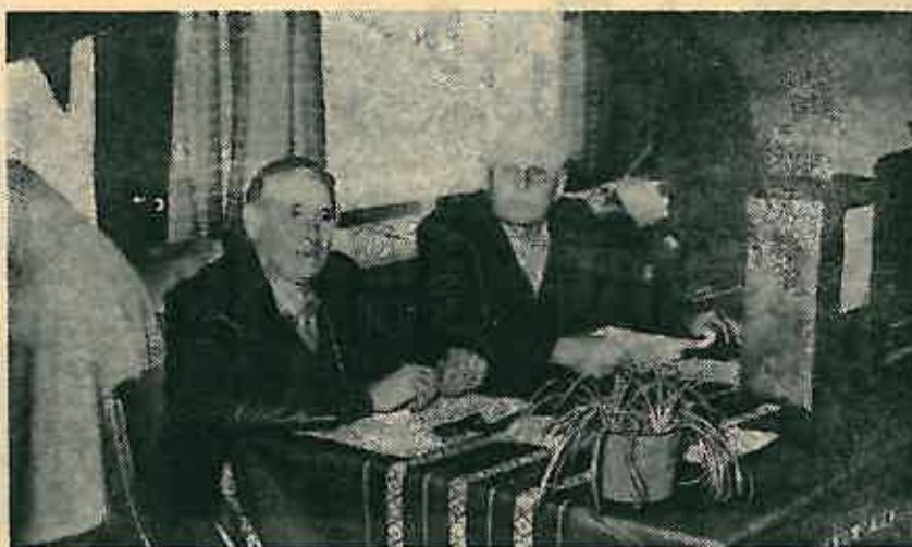
Birački odbor delegacije poljoprivrednika