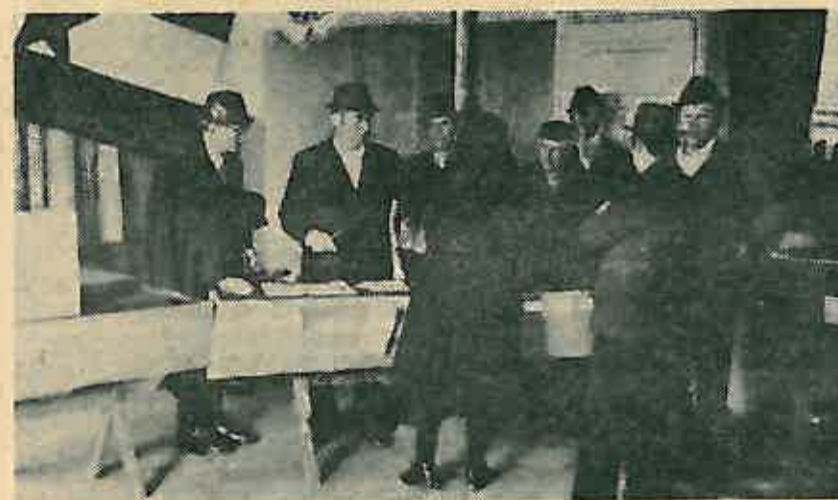
U jutarnjim satima biračišta su oživjela