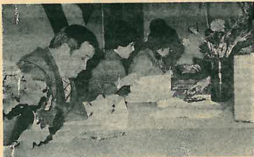
Rad biračkog odbora

novec i Obedišće svoja izborna mjesta zatvorile su nepun sat nakon otvaranja, sa sto postotnim odazivom birača. Ovo je jedan od pozitivnih rezultata koji su uslijedili nakon opsežnih i kvalitetnih priprema. m.