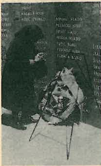
Na grobu palog sina

29. ožujka održana je komemorativna svečanost u povodu 34. obljetnice Oborovske bitke.