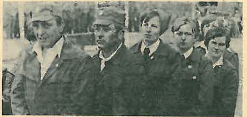
Pobjednička ekipa Gračeca

Na kraju da spomenemo i to da je cjelokupna priprema i održavanje takmičenja uvjetovala radom 8 radnih grupa i uključilo šezdesetak aktivista Crvenog križa i oko četrdeset učesnika osnovnih škola.