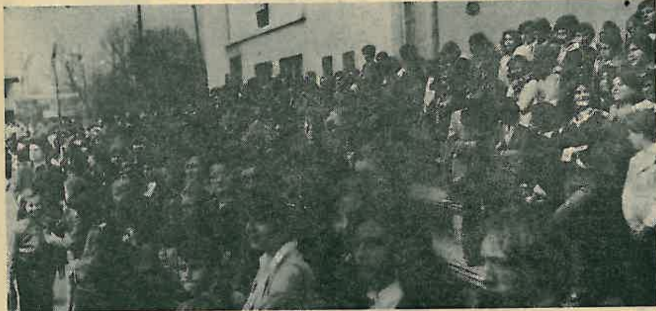
Veliki odaziv građana na proslavu

Drug Krmpotić zahvalio se SUBNOR-u općine Dugo Selo na svestranoj suradnji i zaželio svima zajedno postizanje još većih uspjeha.