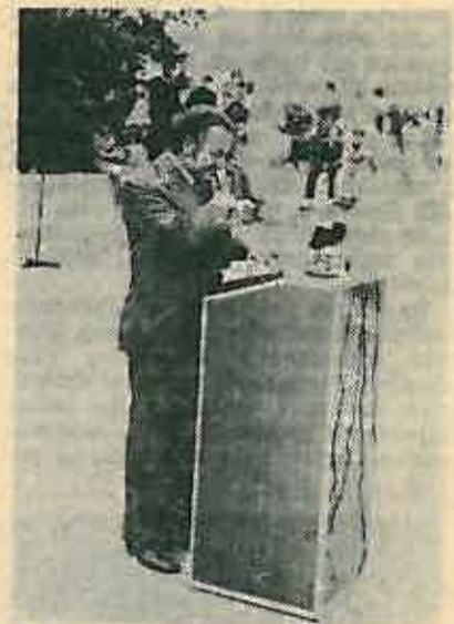
Obecanje za daljnju aktivnost