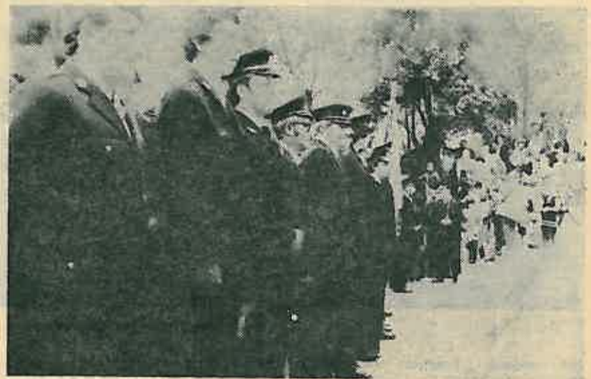
Svečani stroj vatrogasaca