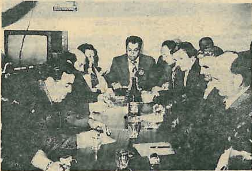
Su svečane sjednice

Istog dana održana je svečana sjednica posvećena godišnjici suradnje ovih Mjesnih zajednica. Predstavnik mjesnih zajednica i kulturno-umjetničkih društava dogovorili su se u radnom dijelu sjednice da se dosadašnja, proširi na polju sve-