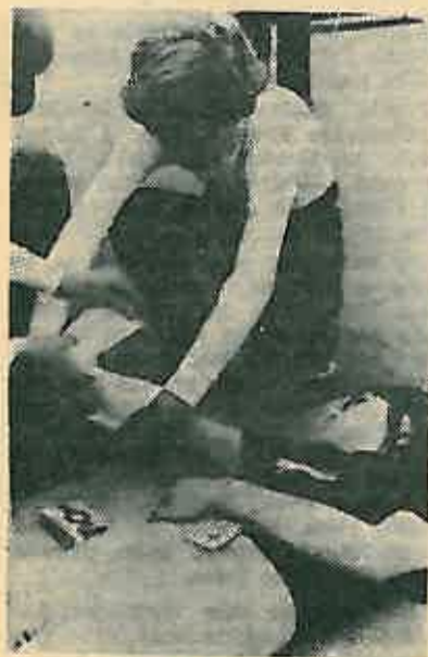
PCK na takmičenju

Teoretski dio takmičenja organiziran je u vidu rješavanja testa. U praktičnom radu ekipe su imale zadatak riješiti dva »nesretna slučaja«.