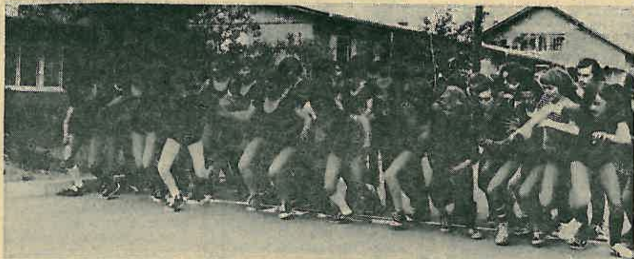
Masovni odziv takmičara iz osnovnih škola