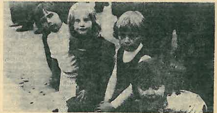
Najmlađi na proslavi

O dočeku i ispraćaju Savezne štafete čitajte na strani 4.