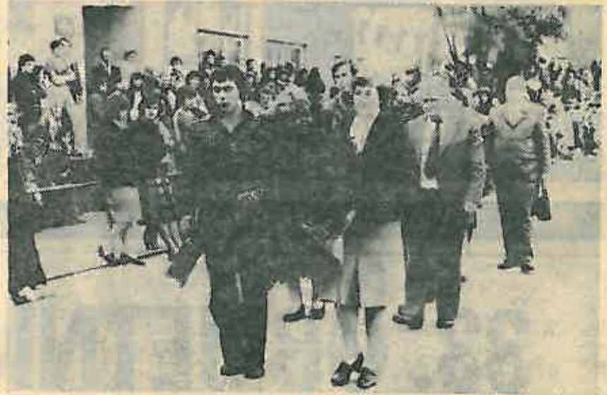
Delegacije odlaze na polaganje vijenaca na spomenike palih boraca