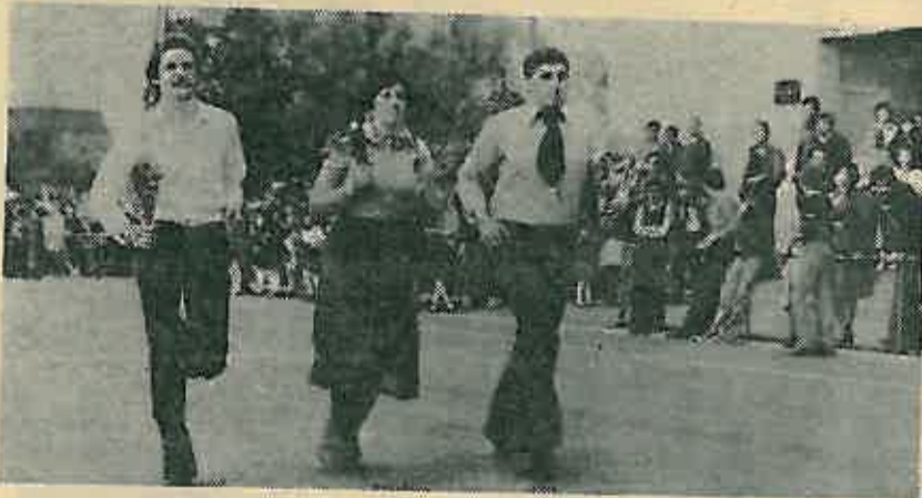
Štafeta »Gorice« dolazi na svečanu tribinu