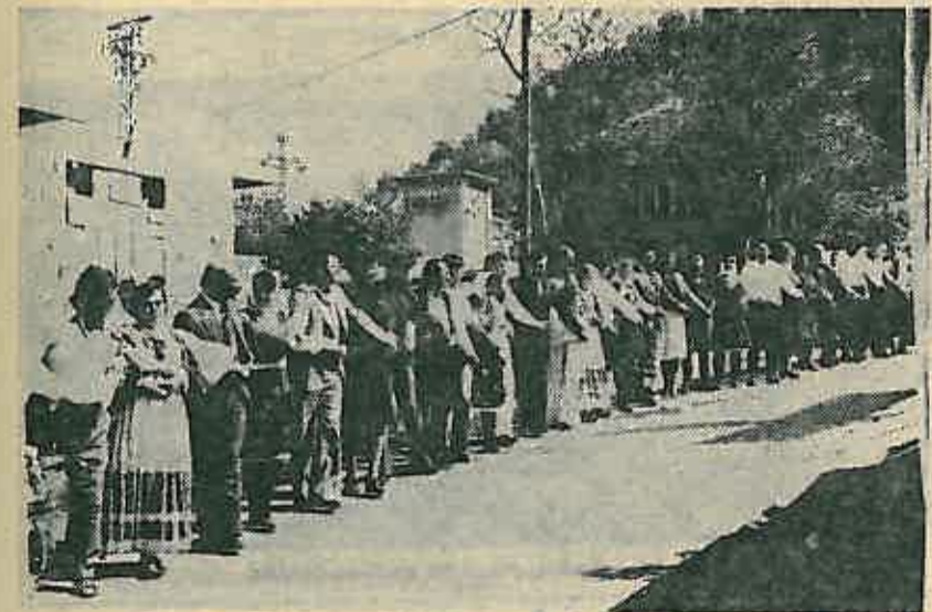
Svi zajedno u jednom kolu

čelvero pojedinaca teško je svrstati u nekoliko novinarskih redaka. m.