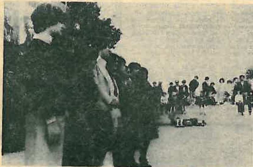
Grupa nagrađenih učenika