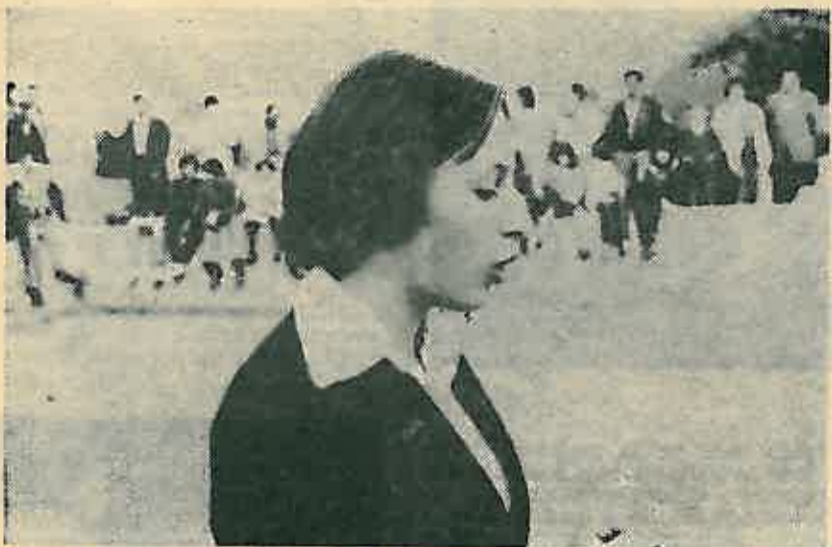
Čitanje najboljeg literarnog rada