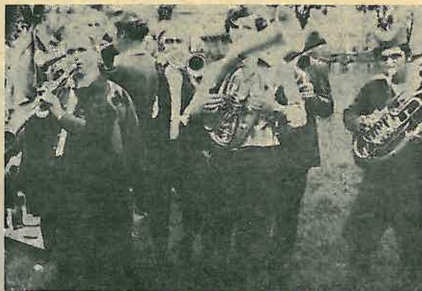
Stalni pratilac — glazba

Uz pjesmu »Druže Tito, mi Ti se kunemo« i »O« drugovi jer vam žao došlo je do tako brzog rastanka braće iz Mionice i Dugog Sela, da bi se