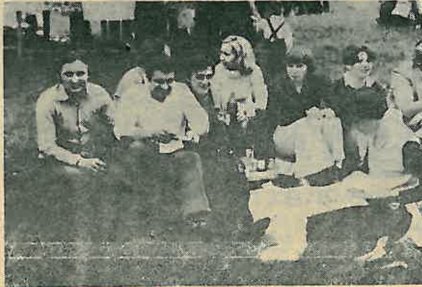
Zajednički izlet u Robaje