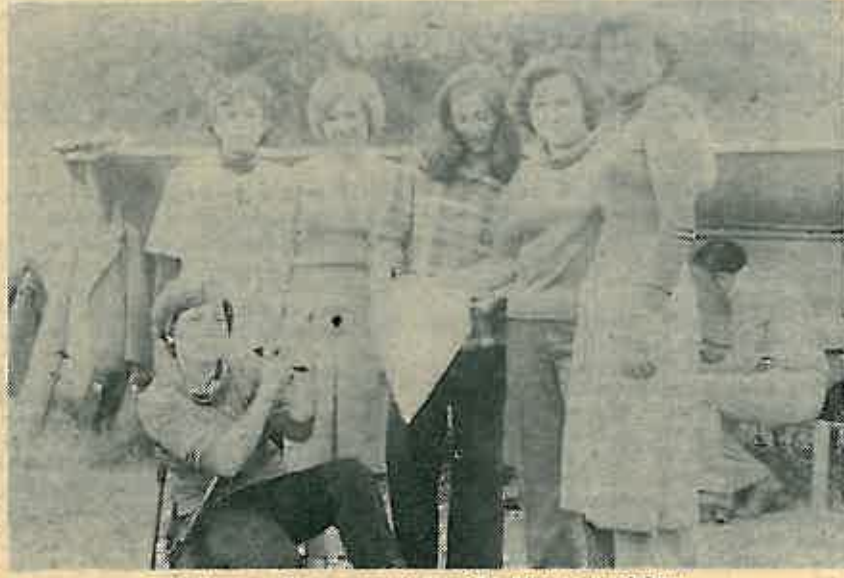
Nakon završenog susreta ženskih ekipa u streljaštvu

redom, sve od polaska iz Dugog Sela pa do povratka 21. svibnja u 23,30 sati.