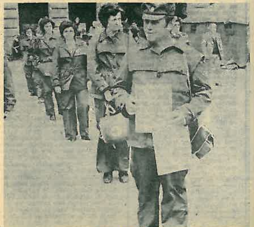
Ekipe CZ Stakorovec