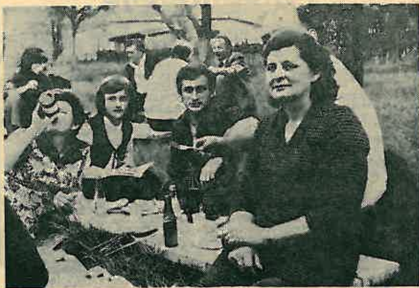
S ručka u Robajama

Nakon završetka sportskog prijepodneva u Mionici lovci domaćini poveli su svoje goste u rezervat-fazaneriju svojeg društva, da bi im pokazali uzgojne mogućnosti svoje fazanerije. Napominjemo da se uzgoj fazanske divljači u fazaneriji u Mionici vrši na najviše moguće prirodni način, kako bi se postigli što bolji uslovi i uspjesi fazana do onog trenutka dok se puštaju u lovište. Na taj način lovci iz Mionice mogu samo djelomično zadovoljiti potrebe