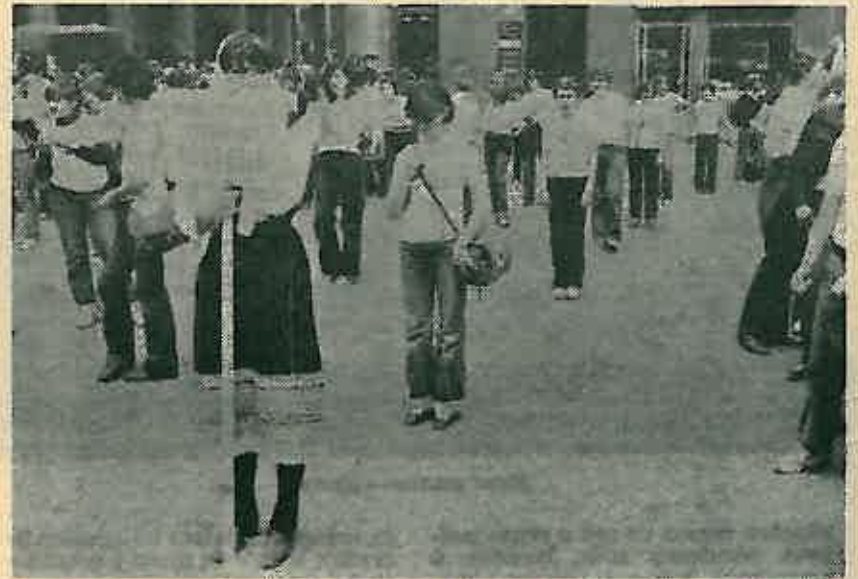
Ekipe podmlatka CK Dugo Selo

Ovu manifestaciju zajedničke suradnje Sekretarijata za narodnu obranu i organizacije Crvenog križa pratili su sa područja Općine Dugo