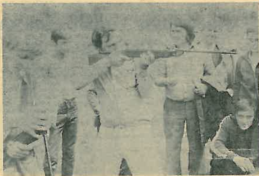
Nastup muške ekipe Mionice u streljaštvu