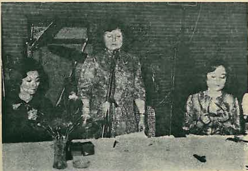
Dodjeta nagrada povodom radnog jubileja

Proteklih godina Zavod je otvorio svoja vrata prema sredini u kojoj djeluje. Danas se u Zavodu pronalaze novi putevi šireg razvoja i proširivanja djelatnosti, što će uz aktivno su uključene u sve pore života i rada organizacije i vodeće su u