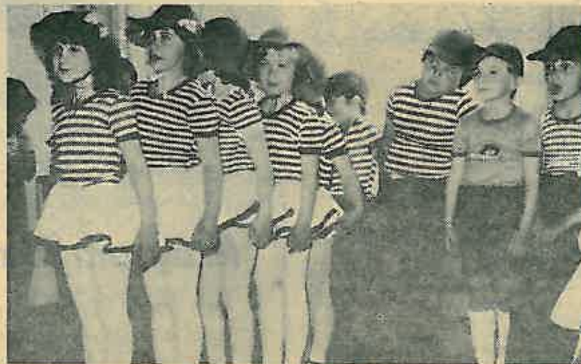
Program u povodu Dana vrtića