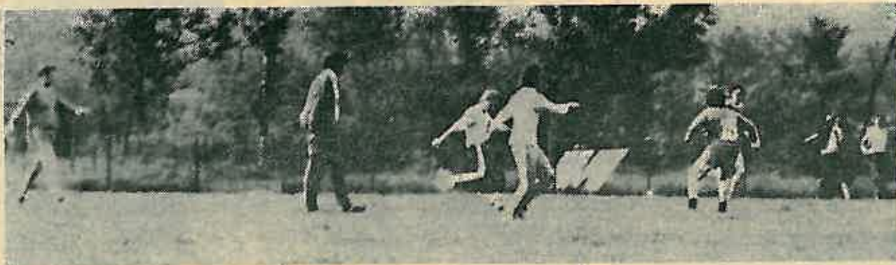
Susret ekipa veterana Mionice i Dugog Sela

Općinska vijeća Saveza sindikata i komisije za sport i rekreaciju upriježile su sportske susrete radnika-sportaša u bratskoj Mionici, Socijalističke Republike Srbije, od 19. do 21. svibnja ove godine.