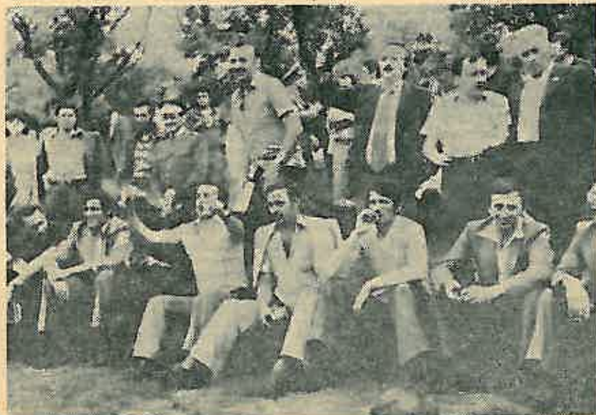
Dovidjenja u Dugom Selu