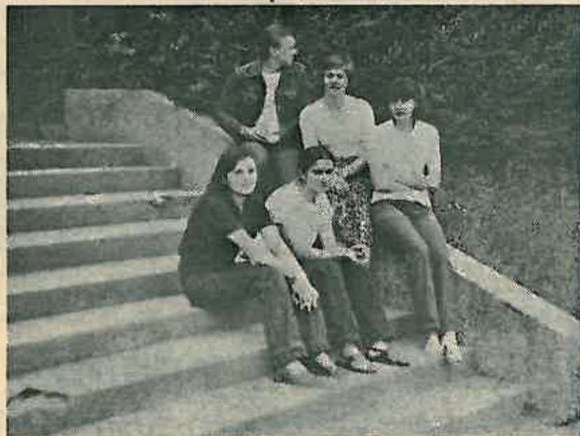
Oni su se prvi puta odazvali

Slijedeći broj »Dugoselske kronike« izlazi 10. rujna 1978. godine