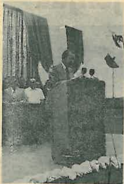
Povelja je izraz volje radnih ljudi naših komun