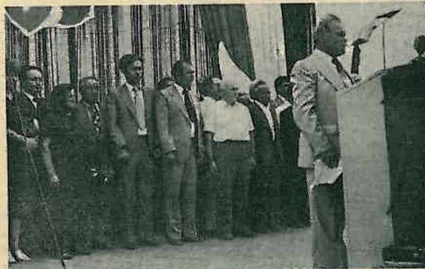
Sa svečanog zbora u Preseki