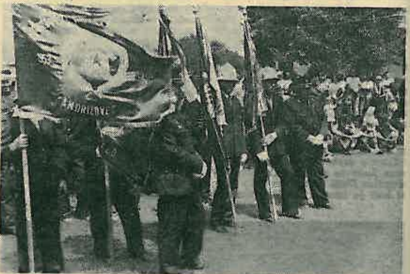
Organizirano prisutna dobrovoljna vatrogasna društva

Zahvaljujući se na primljenoj Povelji drug Petrović je istakao značaj bratimljenja naših dviju općina kao izraz volje građana istaknute kod donošenja odluke o bratimljenju. Drug Pavlović je ukratko upoznao prisutne s naporima koje Mionica vrši u ostvarivanju većeg dohotka, u razvoju novih samouprav-