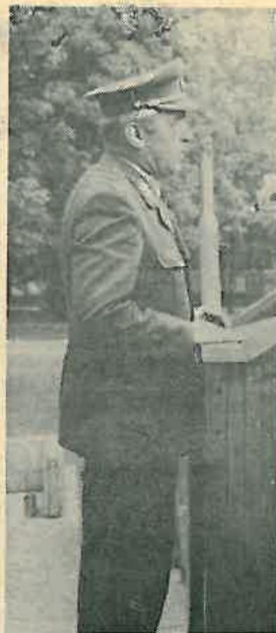
General Kramarić čestita praznik prisutnim vojnicima i starješinama