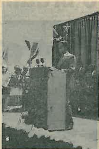
Mlade generacije trebaju gajiti ono što je krvlju stečeno...