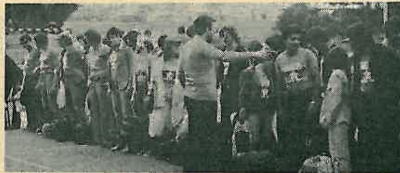
Prije polaska u Sjenicu