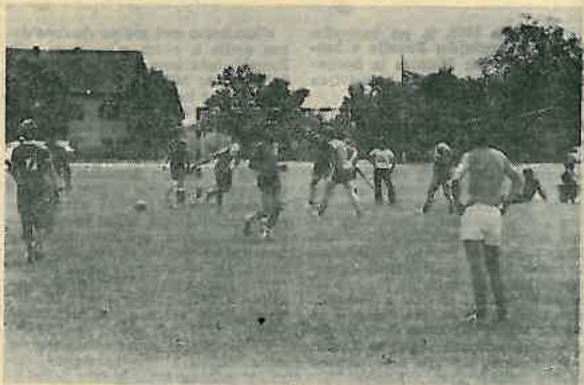
Omladinska sportska olimpijada

svojom krvlju tu povijest stvarali i ovjekovječili.