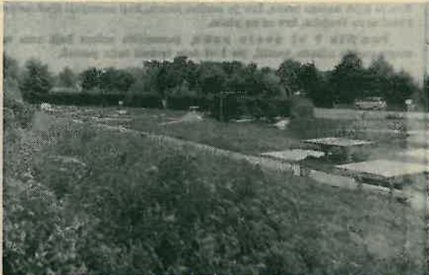
Rekreativni prostor na Martin Bregu

šarkaši kvadrat, stolovi za stolni tenis, te mnogobrojne dječje sprave (ljudjačke, klackalice itd.).