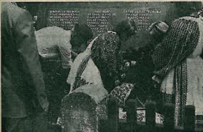
Položanje vijenaca na spomenik palim borcima u Preseki