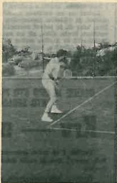
Tenis animira sve više omladine

Ove je godine Skupština općine Dugo Selo donijela odluku da se prostor rekreacionog centra preda u vlasništvo »Sportinženjeringu« koji je ove godine rekreaciju na Martin Bregu upotpunio s novim sadržajima. Nekadašnji bazen, koji već više godina nosi epitet najčišćeg u Socijalističkoj Republici Hrvatskoj, prije izvjesnog vremena dobio je i dječji bazen u kojem se kao i u velikom vrši stalna filtracija vode, te