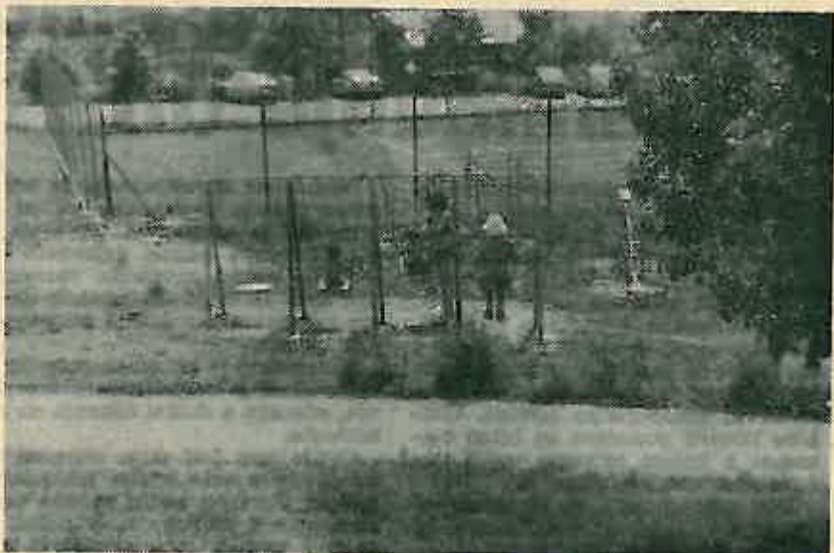
Dječja igrališta uvijek su puna