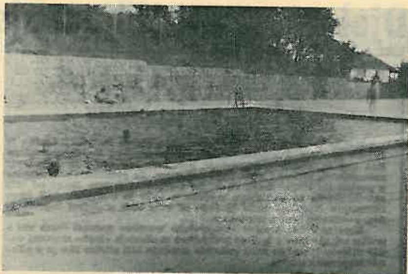
Bazen još uvijek najviše privlači

Prostor oko bazena popunjavaju sportska igrališta od kojih su novoizgrađena dva tenis igrališta svakako najatraktivnija. Uz njih su mali golf, viseća kuglana, bočalište, ko-