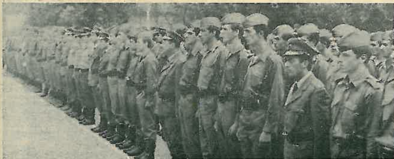
Sa svečanog stroja u kasarni »Zagrebački partizanski odred«