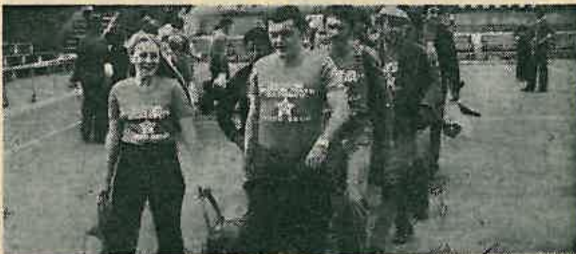
Odlazak s pjesmom