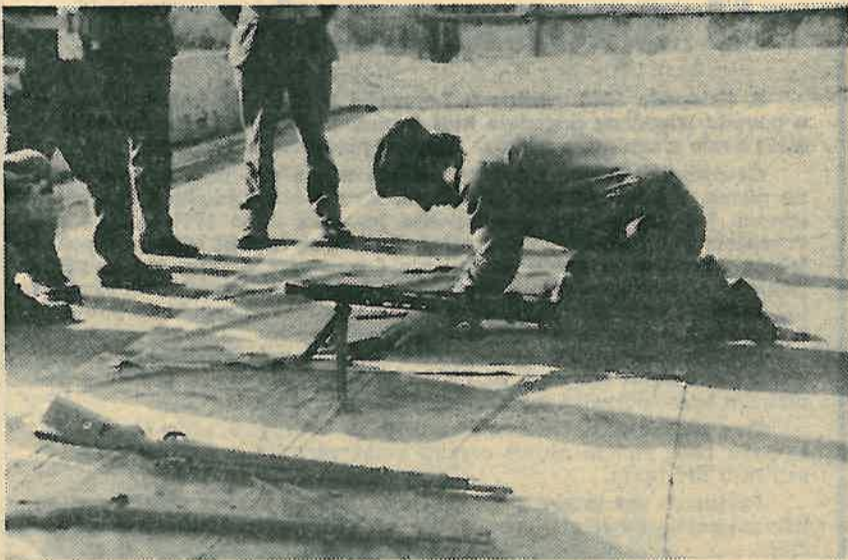
Obuka s puškomitraljezom