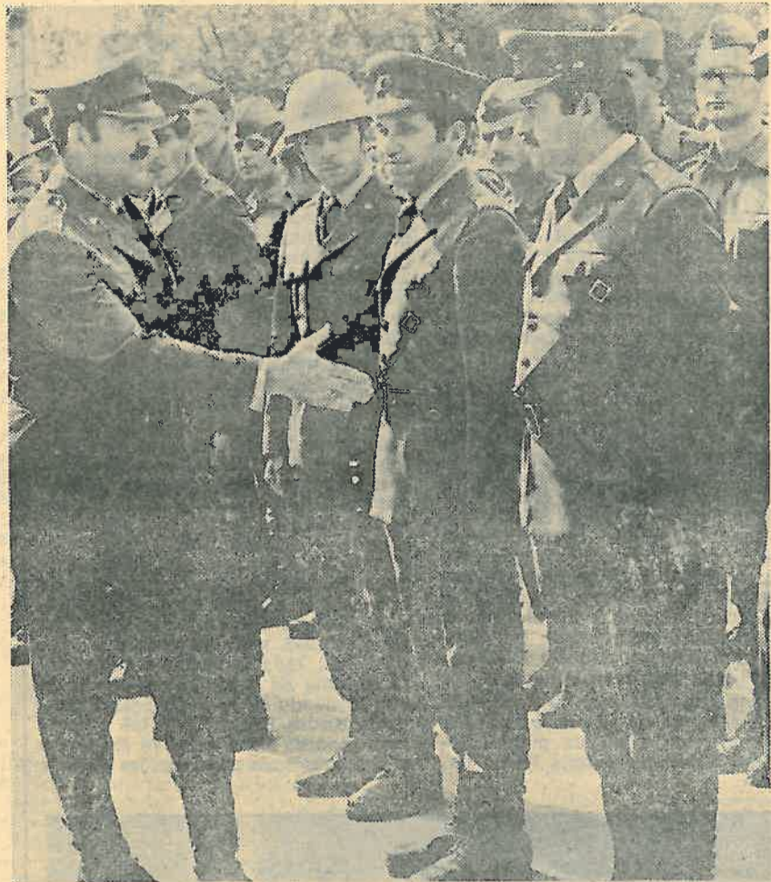
Cestitke na primljenim priznanjima, nagradama i unapređenjima

17. rujna 1978. godine dan 5. kordunaške proslavljen je i na Petrovoj Poljani općina Vojnić. Na centralnoj proslavi učestvovali su pripadnici jedinice Ivana Novaka s recitalom.