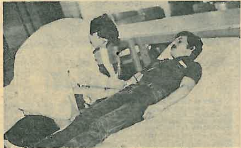
Dobrovoljno davanje krvi — izraz humanosti