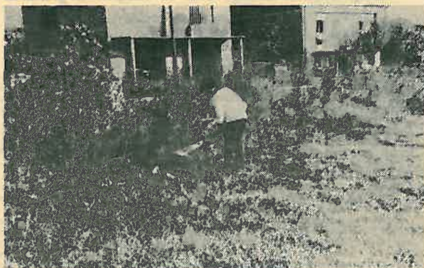
Korov je trebalo sav uništiti