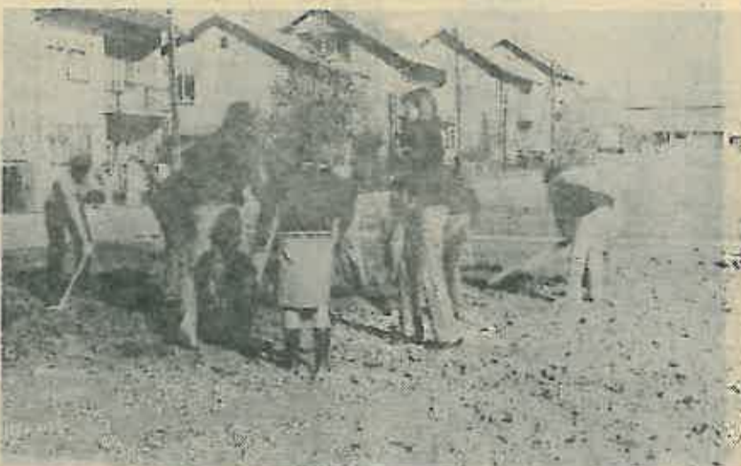
Još malo i gotovo