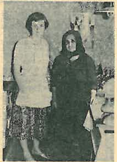
Sve generacije u akciji humanosti