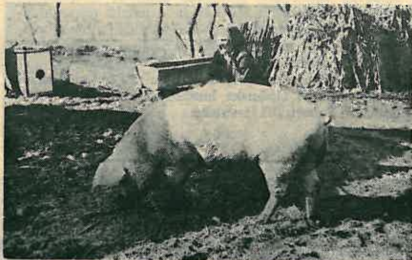
Da li su stočne vage uvijek ispravne.

Ovo je prvi puta da objavljujemo odbornička pitanja, ali u buduću će se tim pitanjima u našem listu sigurno naći više mjesta.