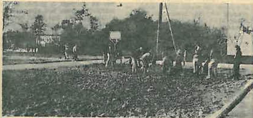
Akcija je počela — neke još dolaze