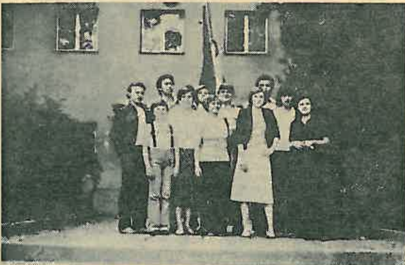
Aktivisti Omladinske organizacije Crvenog križa

Cekala te mama dugo sad su mrtve njene oči, Ugasile se od čekanja da ćeš ipak jednom doći. Sad kroz život idem sama, tata vole me svi. Zašto ti ode, tata moj, zašto me ne voliš ti? U ulici gdje stanuješ sretnem te često. Zašto me ne gledaš tata? Teško je biti sam bez tebe, sestre, i brata. Premlada sam za tugu i s njom se borim, Bote me misli te, vole me, vole svi, samo ne tata ti. Ako nećeš više doći, neću krasti tvoju sreću. Tom ulicom gdje stanuješ, više tala veći proći. Zaplakati će tvoje oči, nek ne bude tata kasno. Zar vole me, vole svi, samo ti čekaš tala, samo me ne voliš ti.