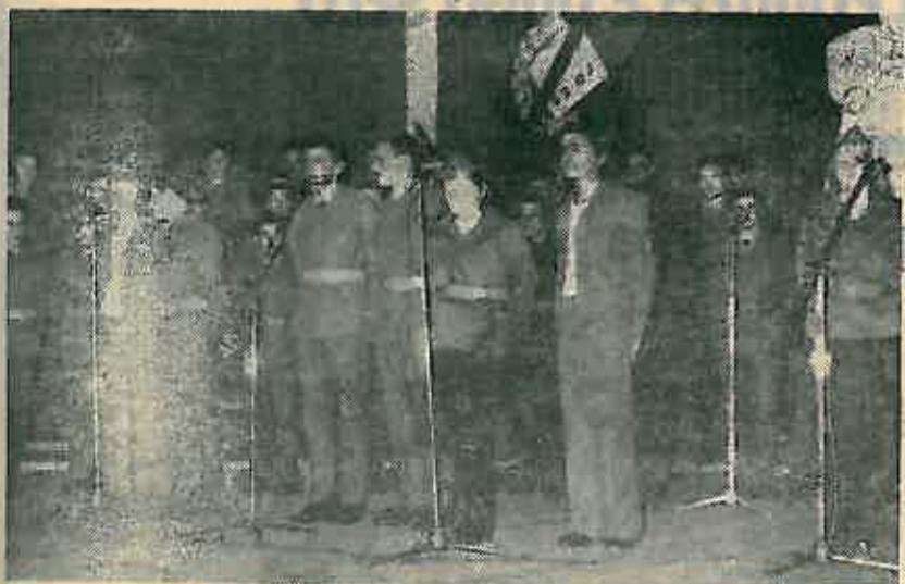
Ovaj je puta pobijedio domaćin

Nakon što su uspješno završili prvi ciklus, mladi iz OO SSO Rugvica, Ivanja Reka, Okunšćak, Sop-Hrušćica, Jezevo i Nart Jakiševac pokazali su velik interes za ovakav način ideološkog osposobljavanja te i ovaj pohajduju u velikom broju.