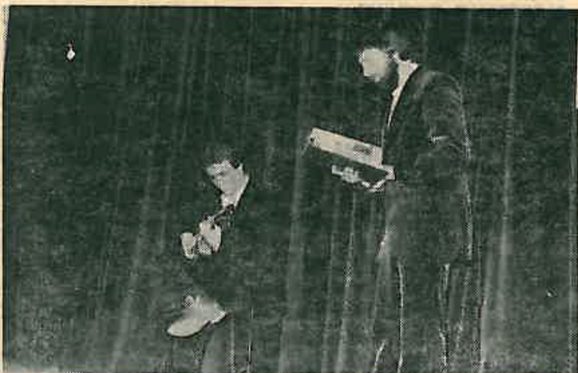
Gosti iz Križevaca