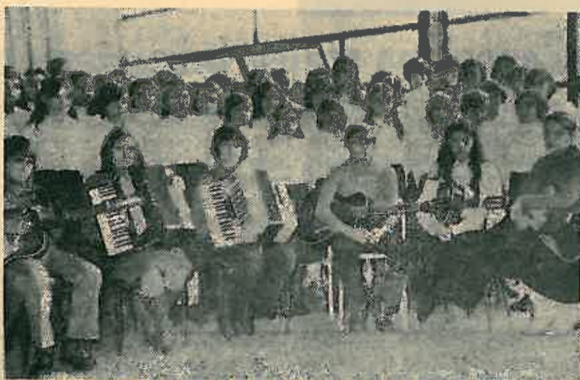
Pioniri u »Gorici«