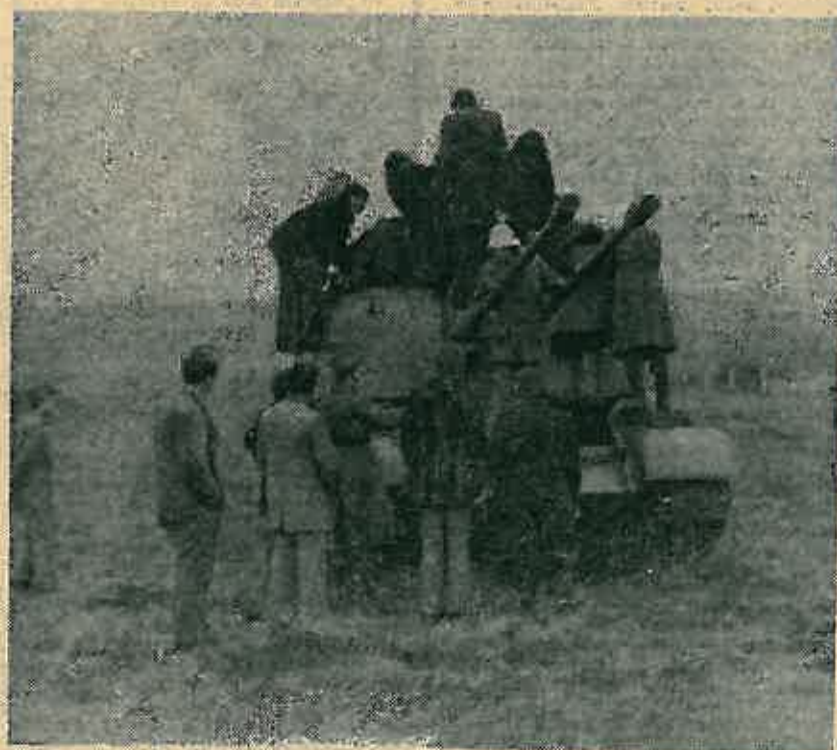
S teletičkog zborna