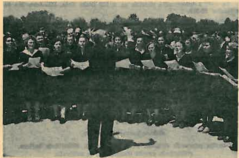
Zborno pjevanje prije dvadeset i više godina