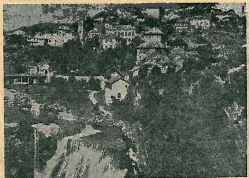
Jajce — povijest Jugoslavije stvarana je ovdje u noći od 29. na 30. studeni 1943. godine