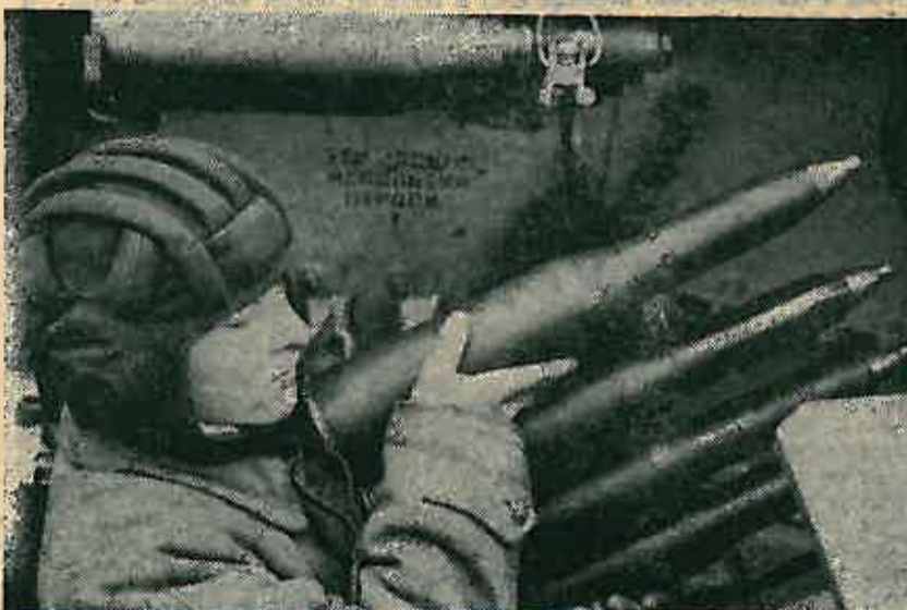
Tenkist na redovnom zadatku