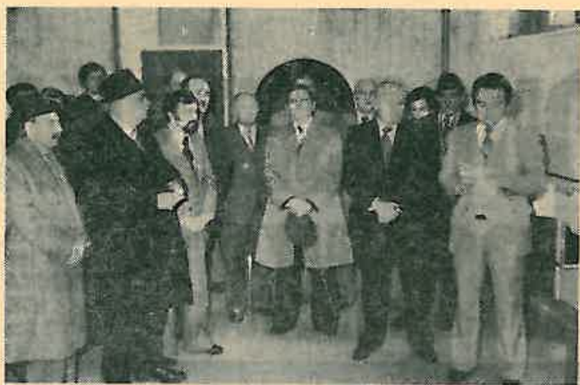
S otvaranja nove pošte