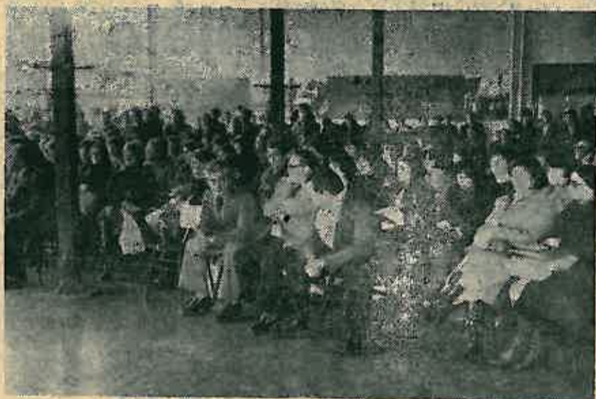
Radnici su sa zanimanjem pratili program