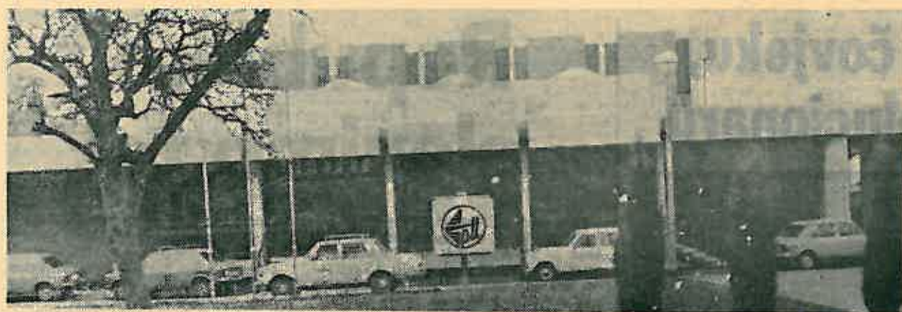
Pogled na novu poštu

Inače naša pošta prekriva područje dvadesetpet sela što predstavlja oko 2/3 naše komune. Ovaj novootvoreni prostor predstavlja mogućnost kvalitetnijeg poslovanja, organizacije radnog vremena i sl.