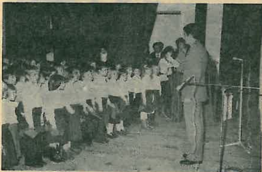
Davanje svečane pionirske obveze

Slijedeći broj »Dugoselske kronike« izlazi 25. XII 1978.