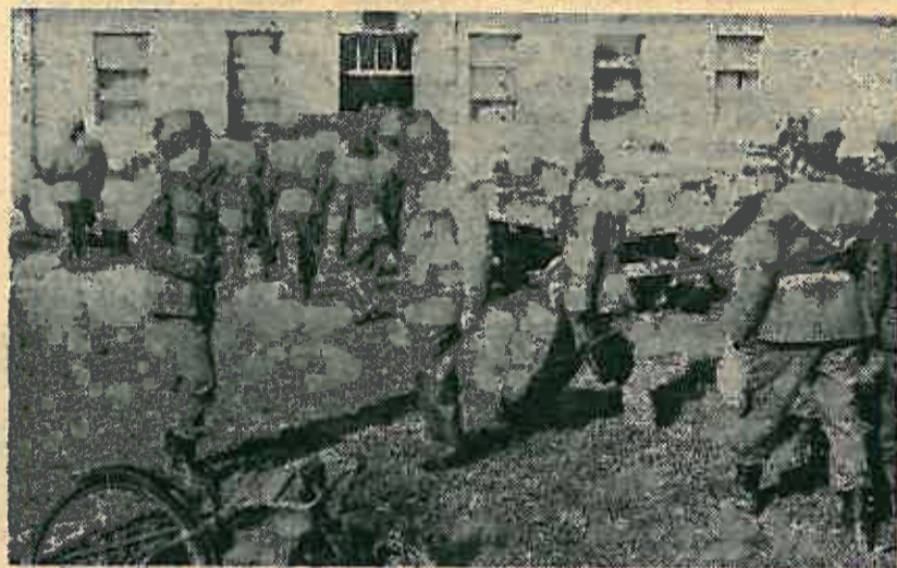
Jedini ce TO na zavrijetku vježbe