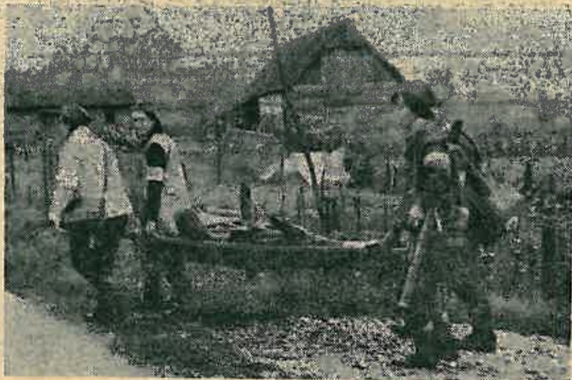
Pomoći nesrećenom drugu