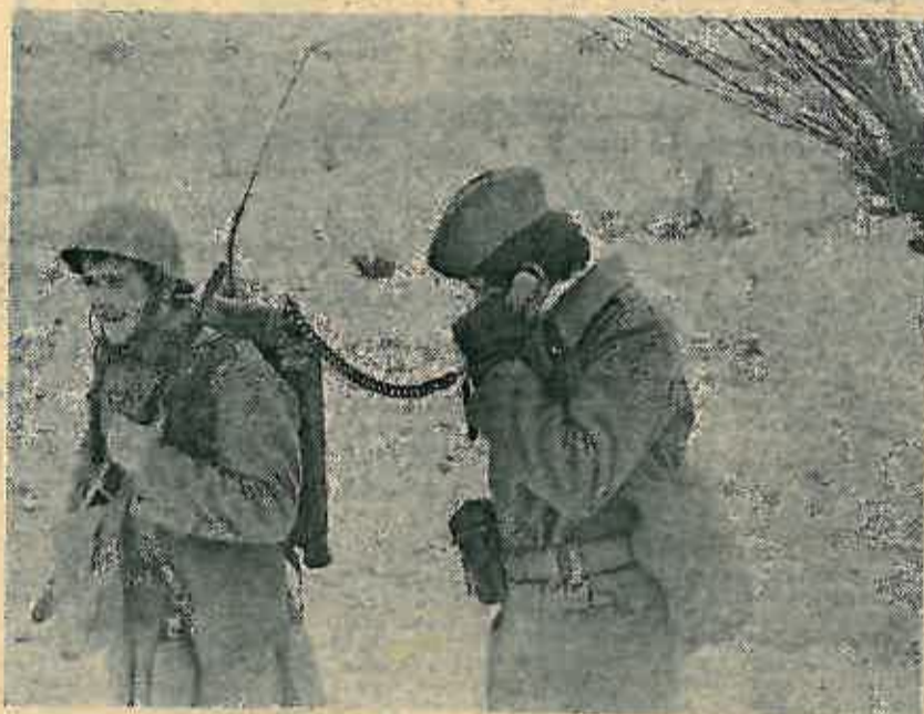
Veza uvijek mora biti uspostavljena

Neka ove fotografije govore o vojniku, stvaraocu i braniocu naše samoupravne socijalističke domovine. m.