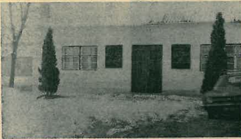
Pogled na spomen-dom i park u Stakorovcu

26. studenog 1978. godine u Stakorovcu je otvoreno spomen-područje posvećeno drugu, borcu, revolucionaru i komunisti Ivanu Valentaku.