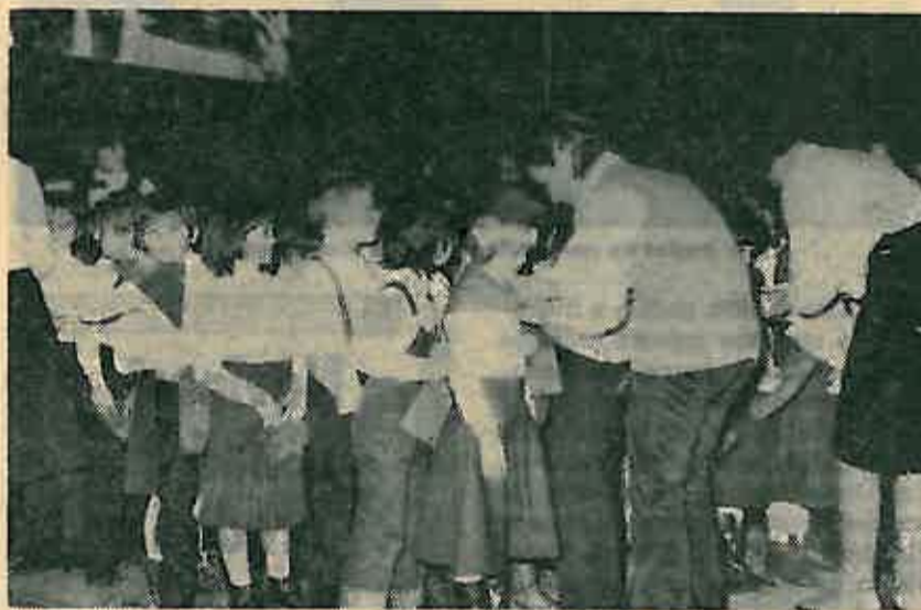
Imam pionirsku kapu i maršam