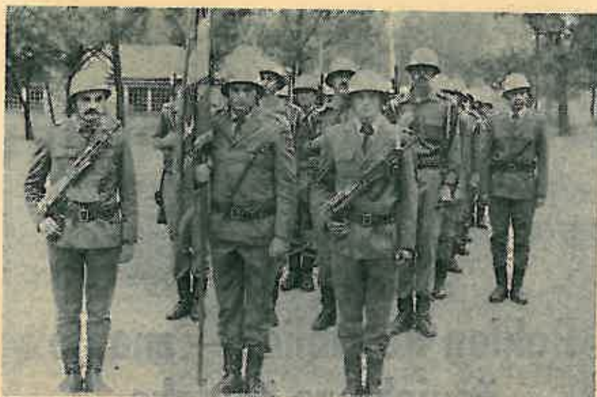
Uz ratnu zastavu