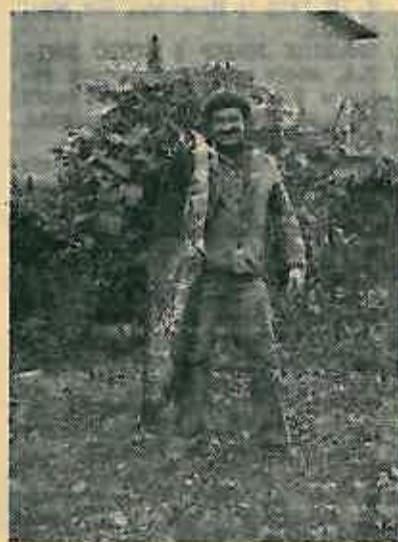
Vedan od ulovljenih somova