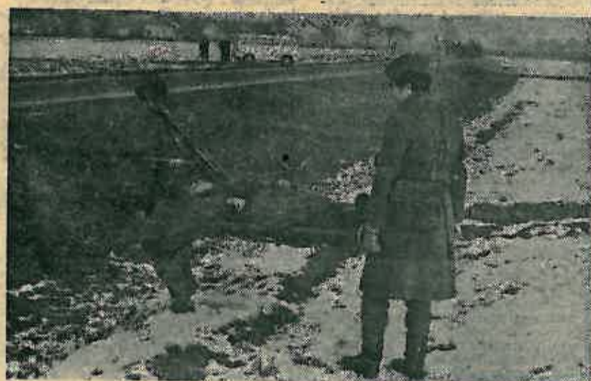
Svi smo mi armija