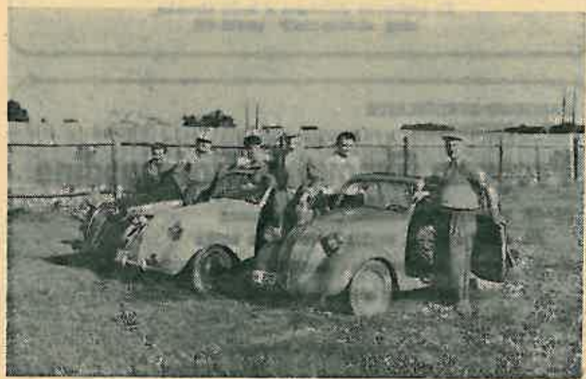
Auto-moto sport bio je vrlo razvijen u našoj sredini