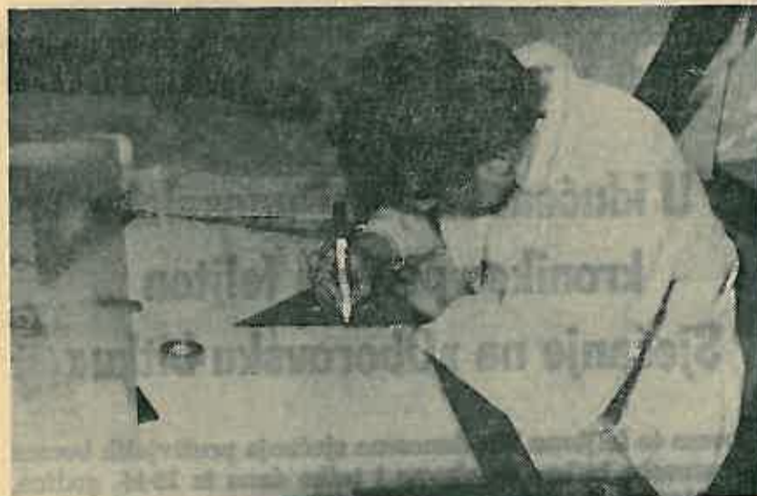
Na radnom mjestu

Svako dana građani mogu dobiti kompletne informacije za objekte svih namjena u poslovnim prostorijama Projektnog biroa u Bobinčevoj 70. U birou radi šestoro zaposlenih od toga tri dipl. ing. arhitekture i tri arhitektonska tehničara. Kada smo ih posjetili radili su na idejnom rješavanju stambenih zlova u individualnoj stambenoj izgradnji. m.