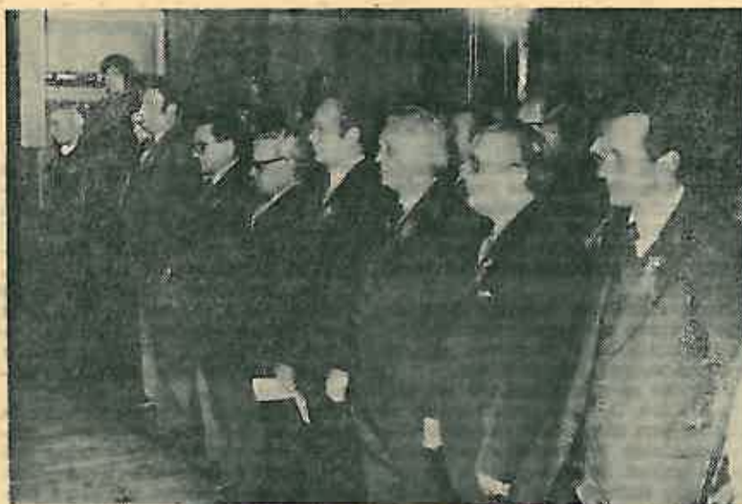
Sudionici svečanosti u Čazmi