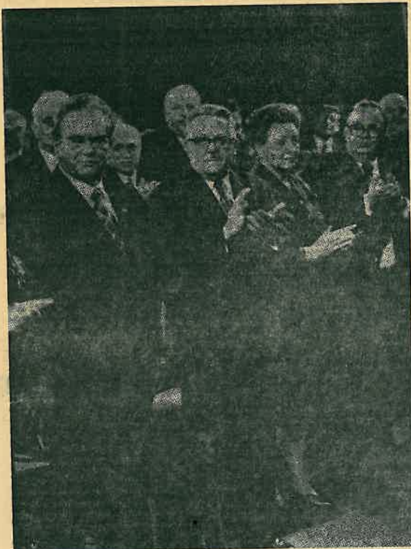
Dugogodišnji saradnici Tito i Kardelj na XI kongresu SK Jugoslavije

Kad smo se drug Kardelj i ja sastali u Ljubljani i poslije u Beču, 1934. godine, on se žalio meni a ja njemu. Pitali smo se što treba raditi da bi jedanput bilo ostvareno jedinstvo i rukovodstva i partijskih redova. Vidjeli smo u tadašnjem rukovodstvu poštene ljude i dobre revolucionare ali onemogućene takvim stanjem i odnosima. Frakcionaške borbe nisu samo nanosile veliku štetu radu Partije nego su isto tako i uništavale najbolje, najrevolucionarnije elemente. I drug Parović i mnogi drugi tako su nastradali.»