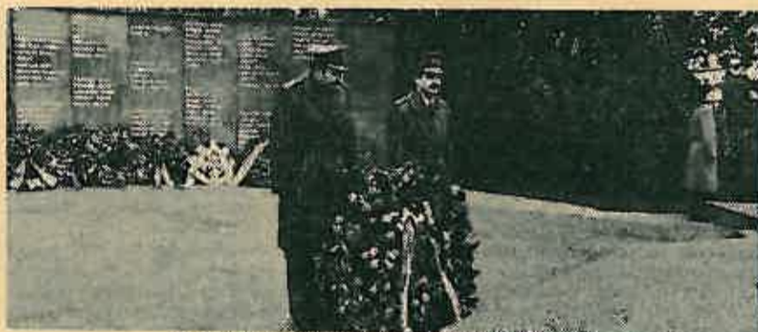
S ranijih komemorativnih svečanosti u Oborovu

Čitajte naš novi feljton u broju od 25. veljače 1979. godine