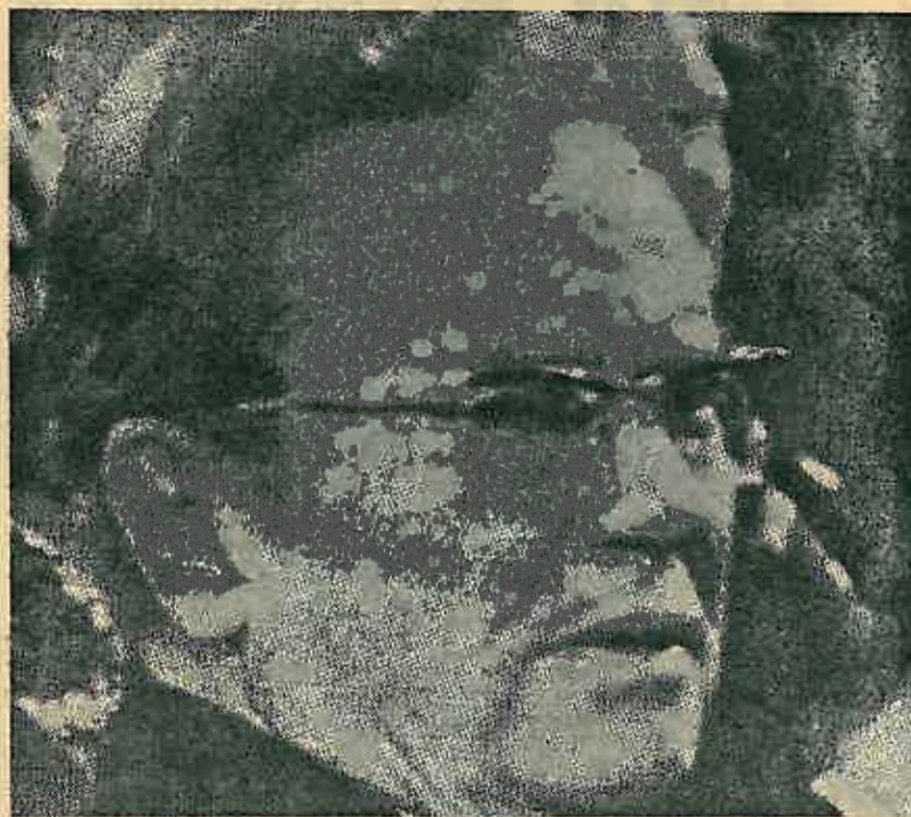
rancija slobode našeg čovjeka i ukupnog napretka naše jugoslavenske zajednice.

Ja vam osobno stavljam na srce da njegujete bratstvo i jedinstvo naših naroda i narodnosti, da raznim aktivnostima i natjecanjima doprinosite njihovom daljem zbližavanju, da učenjem i radom obogaćujete sve vrijednosti našeg socijalističkog, samoupravnog društva. Jer, to je ga-