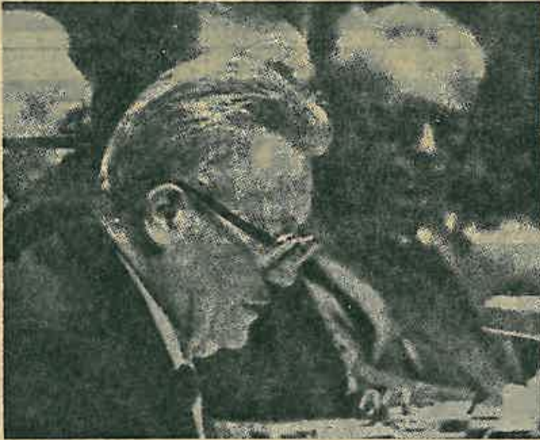
Drug Kardelj predsjedava XI kongresu SK Jugoslavije

Izuzetan doprinos drug Kardelj je dao međunarodnoj afirmaciji socijalističke Jugoslavije, osiguravanju njene nezavisnosti, izgradivanju naše vjnske politike, borbi za ravnopravne i demokratske, političke i ekonomske odnose među narodima i državanja, razradi idejnih i teorijskih osnova politike i nesvrstavanja, kao i prevladavanju preživjelih oblika odnosa u radničkom pokretu, u svijetu i afirmaciji principa nezavisnosti, samostalnosti, ravnopravne i dobrovoljne suradnje i solidarnosti komunističkih, socijalističkih i progresivnih partija i pokreta, nemješanje u unutrašnje stvari drugih odgovornosti partija i pokreta pred svojom radničkom klasom i narodom.