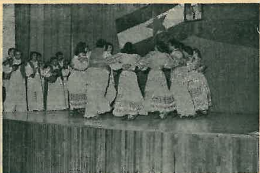
Kroz zvanu Posavinu