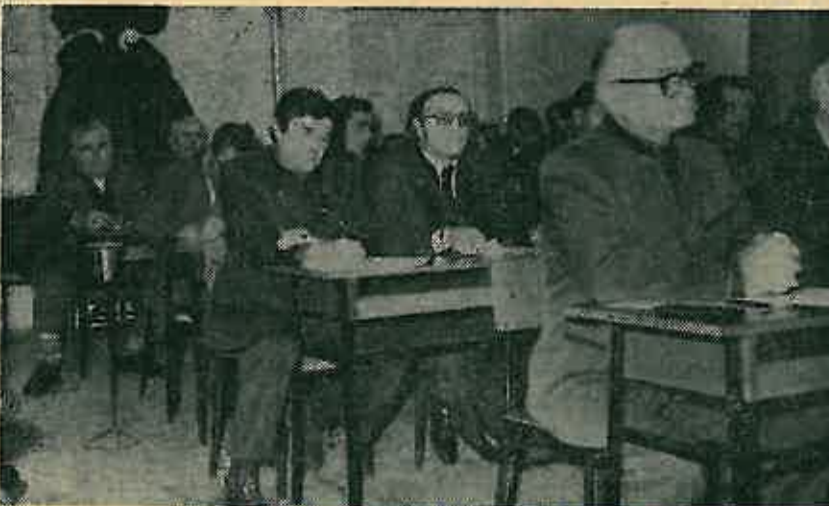
Učesnici godišnje skupštine LD »Patka« Dugo Selo