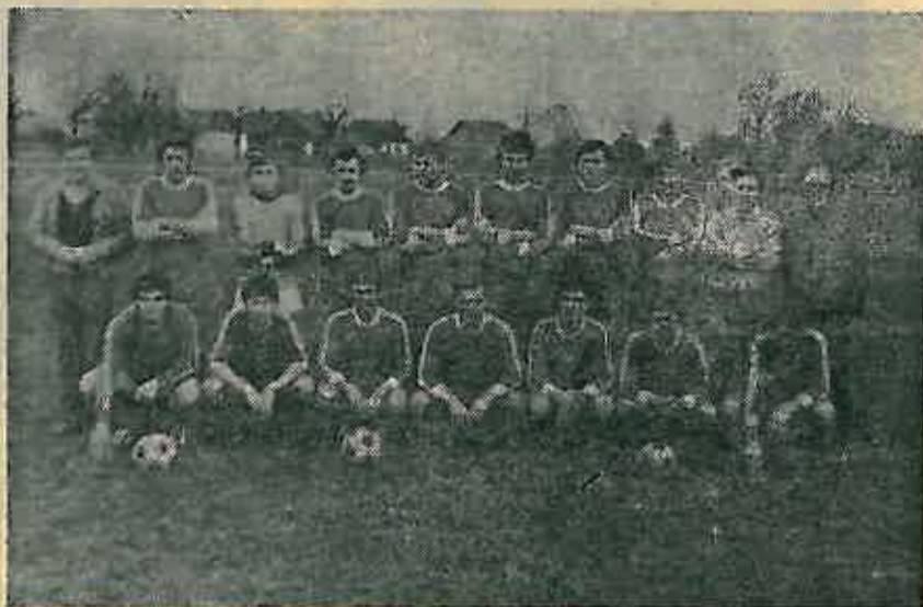
Seniorska ekipa Nogometnog kluba «Jedinstvo»

gu. Jesen 1978. godine nam je bila prva takmičarska sezona u višem rangu takmičenja i ostvaren je vrlo dobar plasman. Osvojeno je treće mjesto, iza NK «Retkovca» i NK «Maksimira». Interesantno je napomenuti da se je u 2. zagrebačkoj ligi nije izgubila niti jedna utakmica na gostovanju, dok se kod kuće izgubilo 50% bodova. Seniori «Jedinstva» su posljednji poraz u gostima doživjeli 16. 10. 1977. godine.