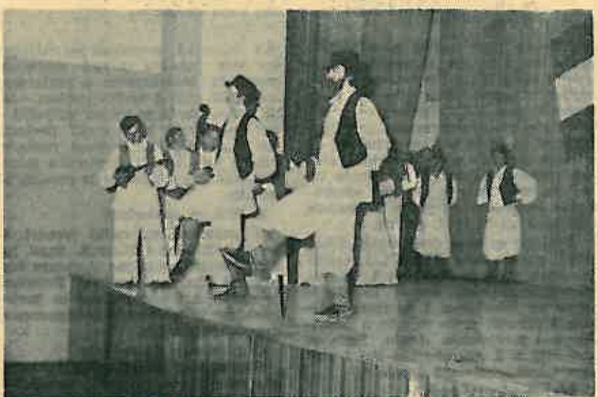
Ples preko noževa i s bocom na glavi