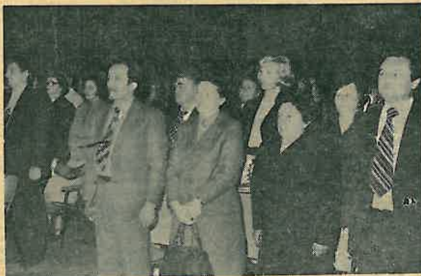
Sudionici svečane — akademije

Svečanom akademijom u Domu JNA 6. ožujka obilježen je Međunarodni dan žena u našoj općini.