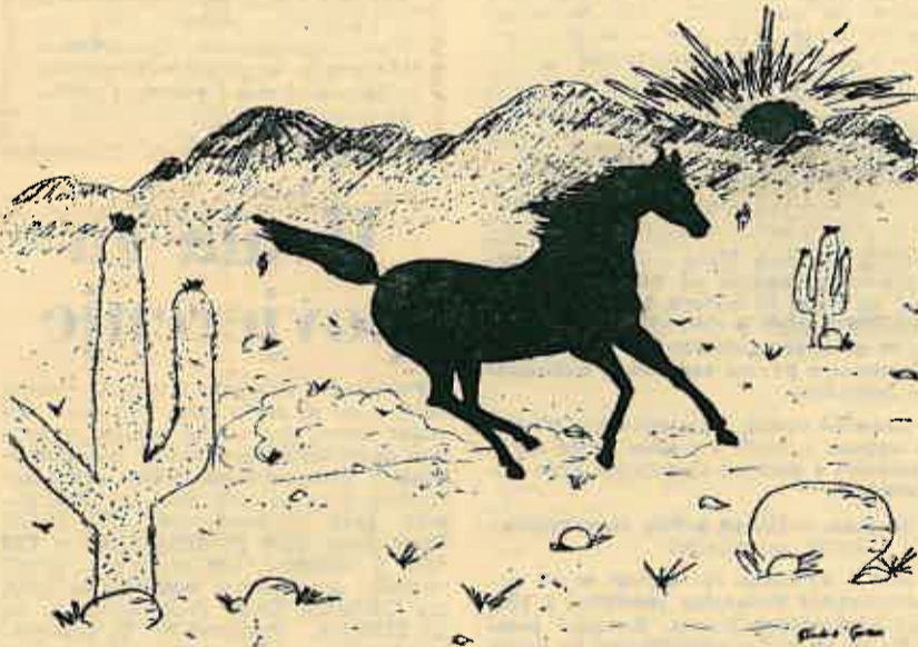
Goran Dukić: »Sloboda«