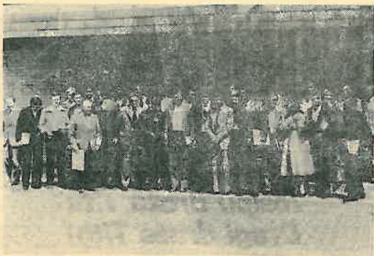
Polaznici Političke škole u Kumrovcu

Sredinom svibnja Politička škola Općinske konferencije Saveza komunista Dugo Selo završila je svoj rad na najsvetijem načinu u rodnom mjestu druga Tita u Kumrovcu. Uz prigodnu riječ druga Muratovića, zamjenika direktora za organizaciju nastave u Političkoj školi SKJ u Kumrovcu, svim našim polaznicima uručene su diplome za uspješan završetak Političke škole.