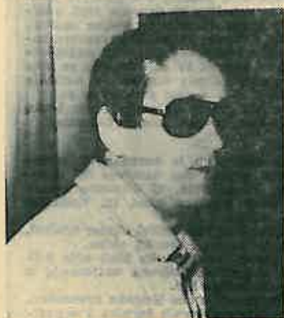
Mladen Kušec, književnik

U ponedjeljak 14. 5. posjetio nas je jedan od najplodnijih književnika mlađe generacije, Zvonimir Majdak, poznat po djelima: »Kuzi stari moj«, »Marko na mukama«, »Kupanje s Katarinom«... Prostorija u zgradi avu-čičište bila je ispunjena učenicima osmog razreda OS »Stjepan Bobinec - Šumski« Dugo Selo, nastavnicima i ostalim gostima. Tom prigodom priredena je i izložba knjiga.