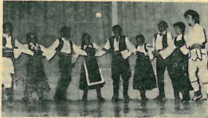
Kulturno-umjetnički program izveden je na pozornici Doma JNA