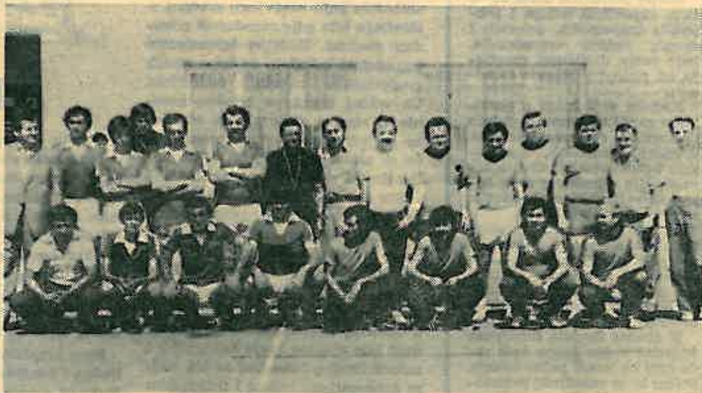
Zajednički snimak sportaša Mionice i Dugog Sela

Gosti iz Mionice imali su sportske susrete sa svojim domaćinima u Dugom Selu iz nogometa, stolnog tenisa, šaha i gaganja glinenih golubova. U ovim sportskim nadmetanjima rezultati nisu bili