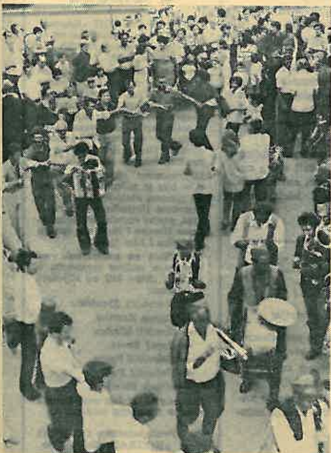
Kozaračko kolo ...