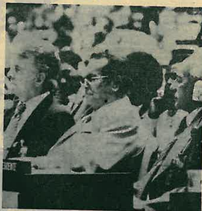
Konferencija nesvrstanih zemalja u Havani dodijelila je drugu Titu — specijalno priznanje

Karavana »Bratstvo—jedinstvo '79« Zagreb—Oborovo