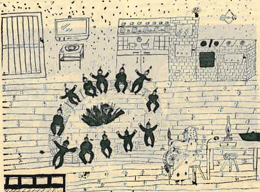
Jasna Dežić — ilustracija: »Šuma striborova«