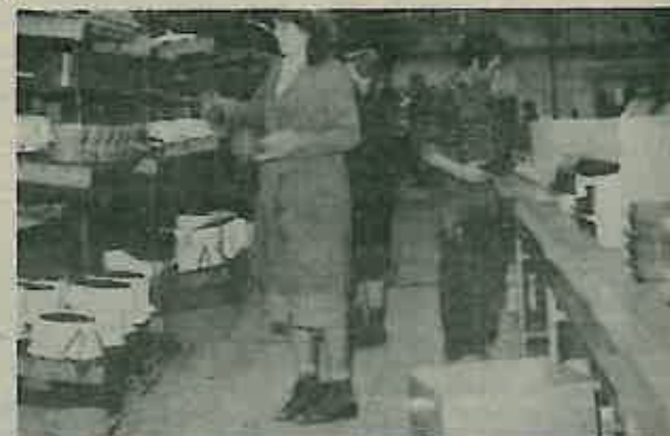
Nakon sušenja u sušari, posude se peče u kontinuiranim tunelskim pećima na temperaturi od 800°C da bi mu se osigurala upotrebna vrijednost, tj. otpornost na kemijske i mehaničke utjecaje, jer je nepečeni emajl topljiv u vodi i lako se skida. Na slici vidimo provjeru još toplog posuda na kontroli kvalitete. Ako posude zadovoljava, kreće u odjel dekoracija gdje mu se obogaćuje estetski izgled. Manje oštećeno posude ide u klasu niže i na doradu.