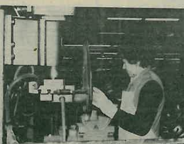
Na odmašćeno posude navare se pripadajući dijelovi, ručke i sl. koje gotova posuda mora imati.