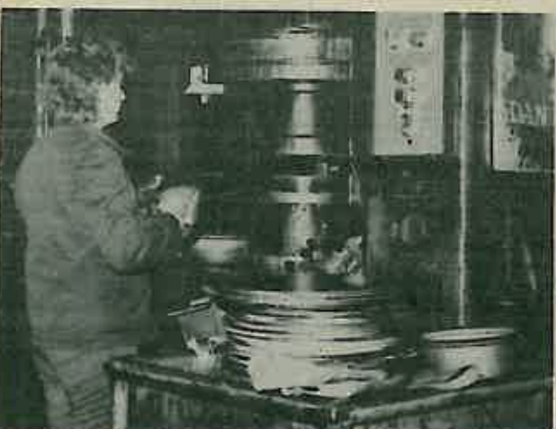
U odjelu vučnih preša, najbučnijem dijelu pogona, izrezani oblici poprimaju željene oblike pod djelovanjem vučnih preša za duboko izvlačenje.