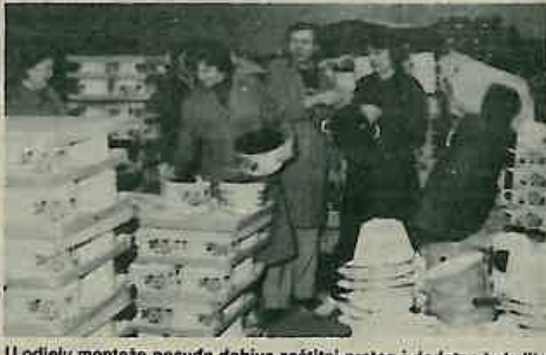
U odjelu montaže posude dobiva zaštitni prsten i dodatne bakelitne dijelove, npr. poklopci »dugmad«, džezve ručke, te se pakuje i sastavlja garniture. Zapakirano posude odiazi u skladište, odakle se isporučuje kupcima u zemlji i inozemstvu.