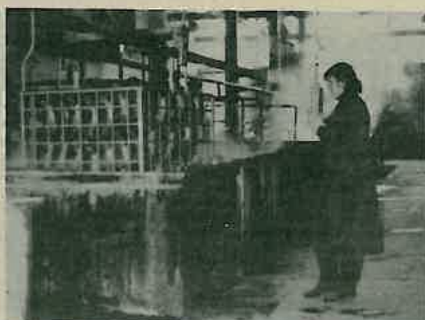
Tako oblikovanim poluproizvodima doraduju se rubovi, a zatim se posebnim kupkama od deterdženta i kiseline u tzv. »bajcu« odstranjuju masnoće i nečistoća.