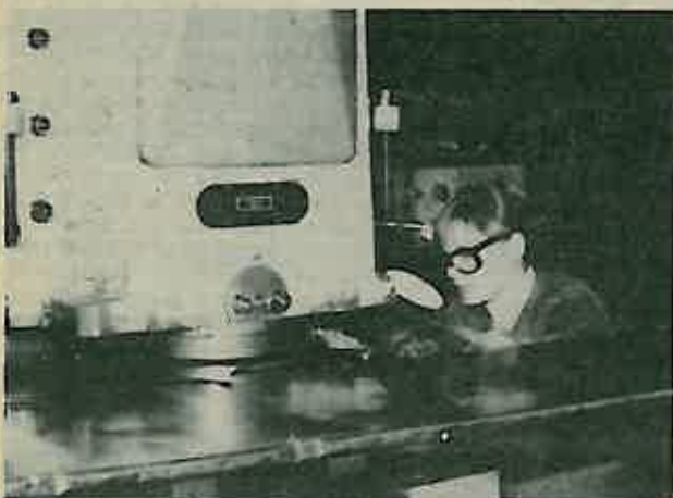
Proces proizvodnje posuda počinje rezanjem čeličnih limova u početne oblike, krugove i kvadrate određenih dimenzija, ovisno o vrsti posuda koje se želi proizvesti.