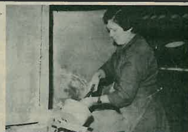
Sada se može pristupiti postupku emajliranja, koje se sastoji od dvije faze. U prvoj se nanosi sivi, temeljni sloj emajla, dok u drugoj fazi nanošenja pokrovnog emajla posude dobiva svoju konačnu boju.