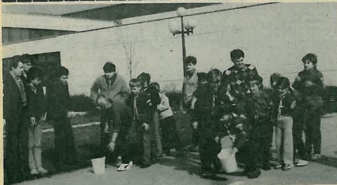
Poletarci uspješno startali

PREDSEDNIŠTVO MO DRUŠTVA "NAŠA DJECA" DUGO SELO