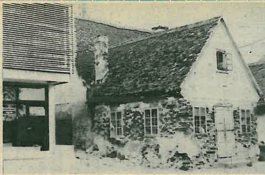
Zar se ove stare zgrade ne bi mogle korisnije iskoristiti