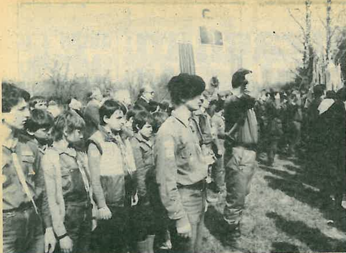
Počasni pozdrav palim borcima