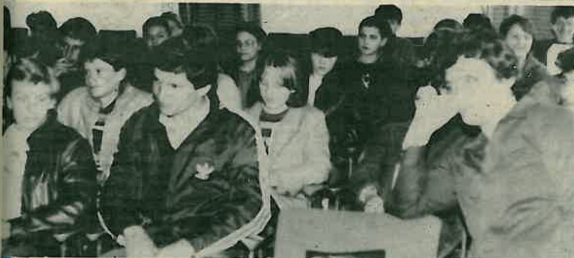
Zadovoljni i predavači i polaznici