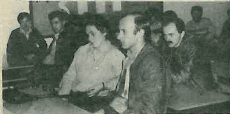
Vanredni sat povijesti

Opća konstatacija: Marš je u potpunosti uspio, tim više što se nije sveo samo na forsirano hodanje već na interesantan dvodnevni program prilagođen mentalitetu mlade generacije. M. S.