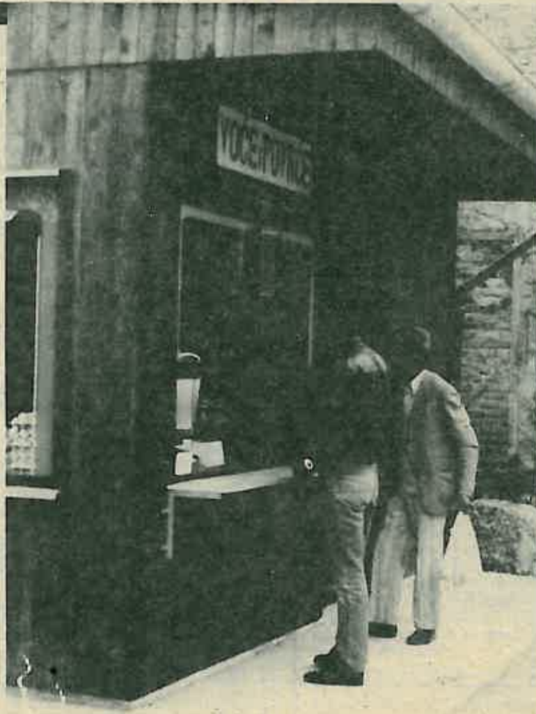
Svjež voće i povrće u novoj prodavaonici