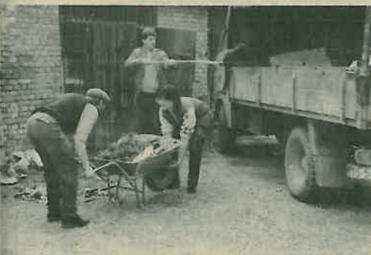
Omladinci Budućnosti svojski su se prihvatili posla i temeljito očistili dvorište Upravne zgrade. Nije se pitao što je «muški» a što «ženski» posao...

Dobrom poslovnim politikom, uz konkretne programe imamo velike mogućnosti za plasman robe na tržištu.