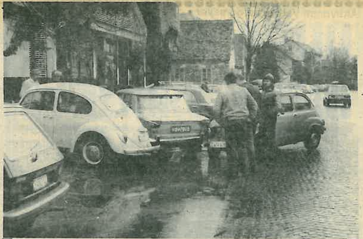
Česta slika s dugoselskih ulica