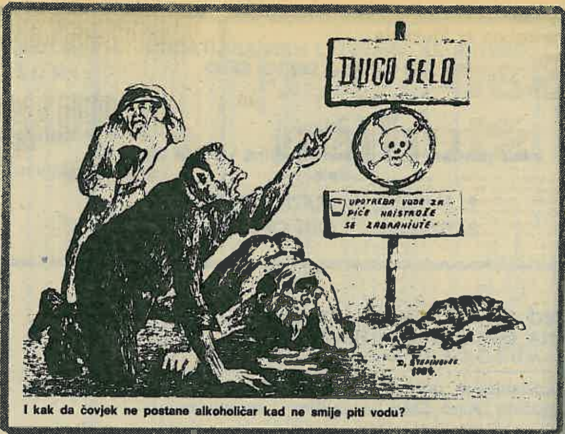
I kak da čovjek ne postane alkoholičar kad ne smije piti vodu?