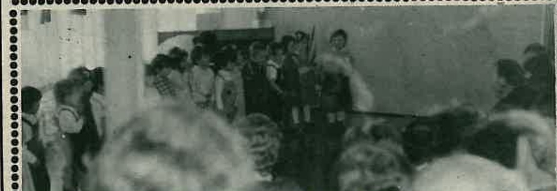
Najmlađa vrtička grupa oprostila se pjesmom od svojih starijih drugova

Ova je djevojka pokušala biti samostalna, a ako vas zanima kako se to radi navratite k njoj, ona će vam to vrlo rado reći... S. P.