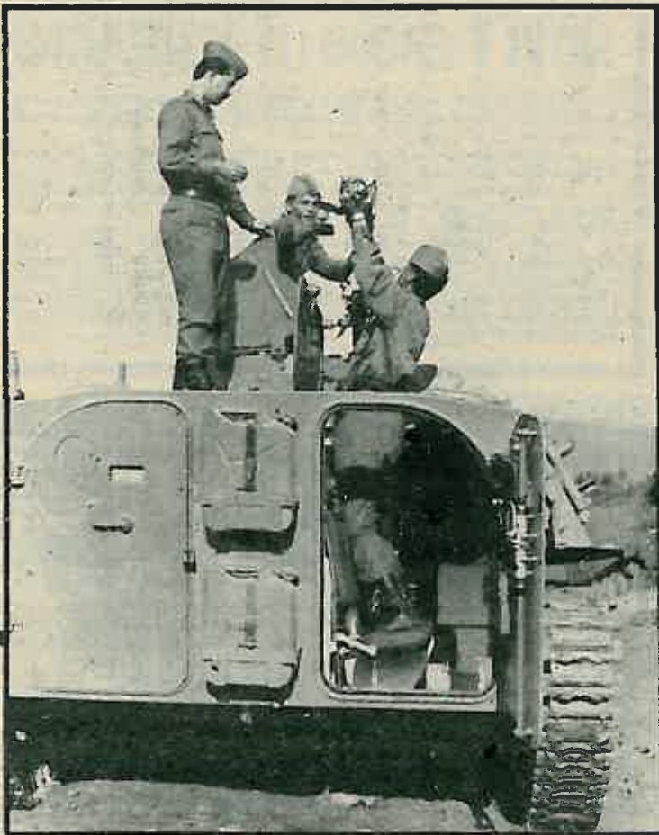
Raketu treba pažljivo postaviti na lansirnu rampu

zbornih kompozicija, među kojima i kompoziciju TITOVO IME koju je uz pratnju vojnčkog zbora i orkestra pjevala LJILJANA ŠECET pod vodstvom DRAŽENA PETRUŠIĆA. Pored navedenih kulturnih sadržaja, posjetilci Lipanjkih susreta mogli su na otvorenom prostoru razgledati improviziranu izložbu poznatog zagrebačkog slikara ŽELJKA HRUSTA, porijeklom iz Ivanić Grada, koji je na licu mjesta slikao posavski pejzaž u čudesnom plavetnilu boje i na taj način privlačio pažnju prisutnih. Bilo je tu i talentiranih majstara koji su vješto baratali kistom, te nekoliko naivaca kipara koji su na licu mjesta izrađivali skulpture u obliku zagorskih seljaka. Već tradicionalne Lipanjske susrete osvježilo je nastup pripadnika kasarne »Zagrebački partizanski odred« koji su svojim kompozicijama pobudili pažnju mnogobrojnih posjetilaca, što je garancija da će vojnici i narednih lipanjkih susreta naći svoje mjesto u programu. M. Č.