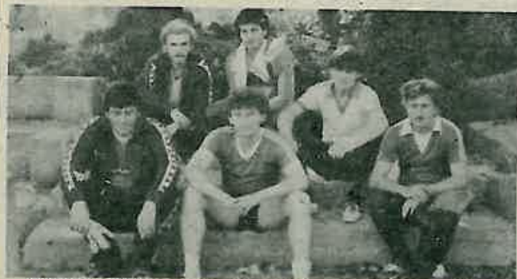
Pokleklji u finišu - ekipa BO "Budućnost"