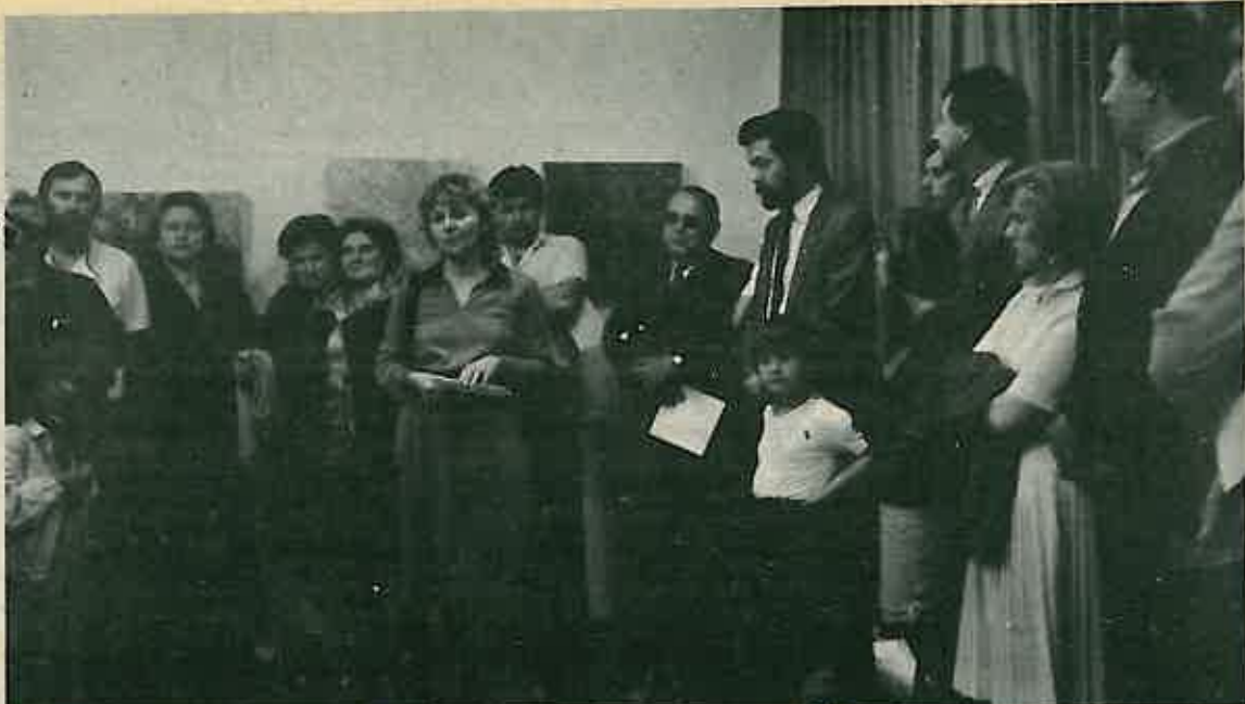
Se svečanog otvorenja izložbe

Možemo reći da je kulturni život Dugog Sela nakon ove Ostojićeve stekao u toj domeni kulturnog stvaralaštva i kulturnih doživljaja širok krug publike.