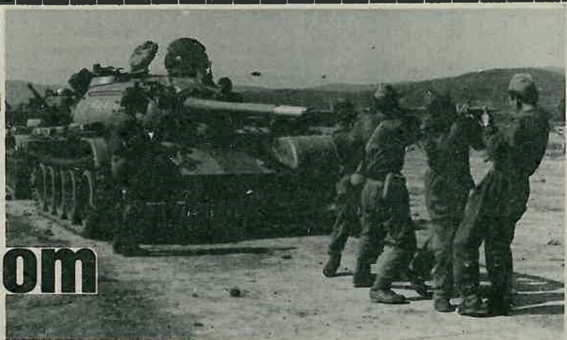
Pregled i čišćenje tehnike, svakodnevni je zadatak posade tenka