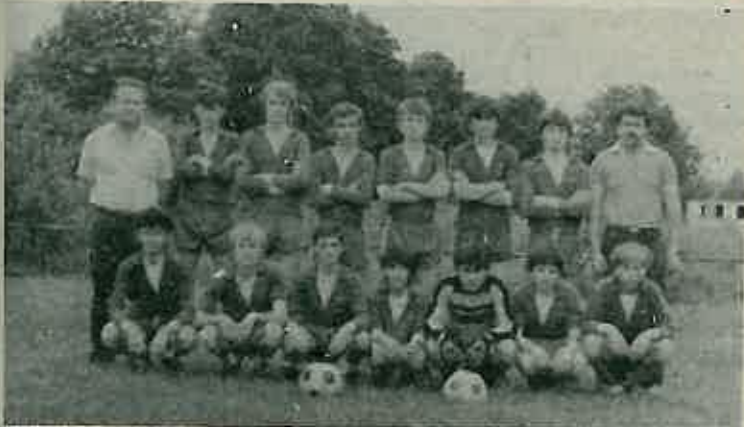
Hoće li ovi dječaci, kada porastu izvući dugoselski nogomet iz krize? - ekipa pionira NK "Jedinstvo"