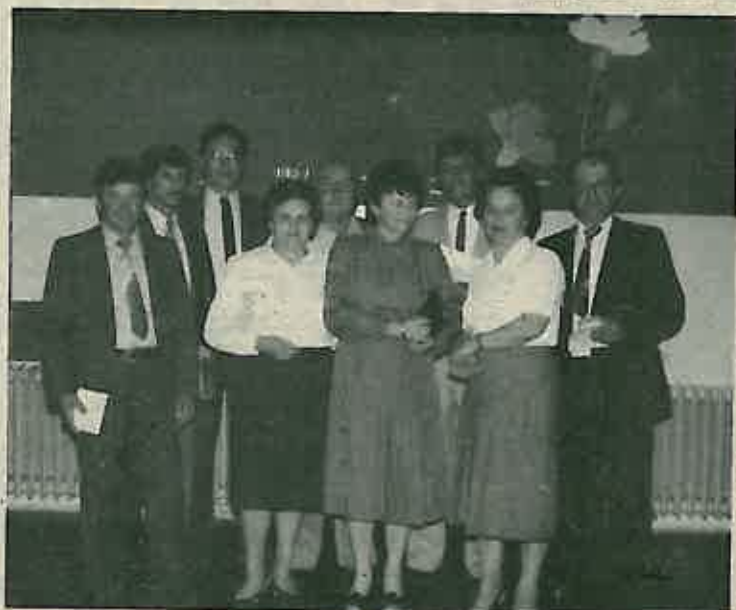
Odlikovani radnici »Gorice«

Na sjednici su uručena odlikovanja 13-orici radnika »Gorice« koje je odlikovalo Predsjedništvo SFRJ