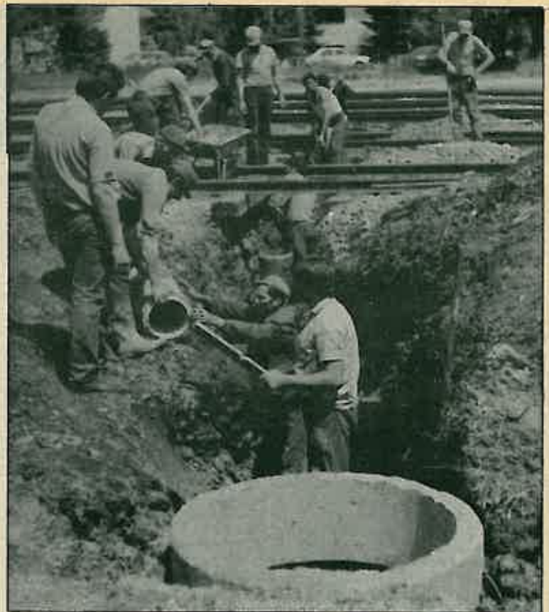
Radnici postavljaju drenažu