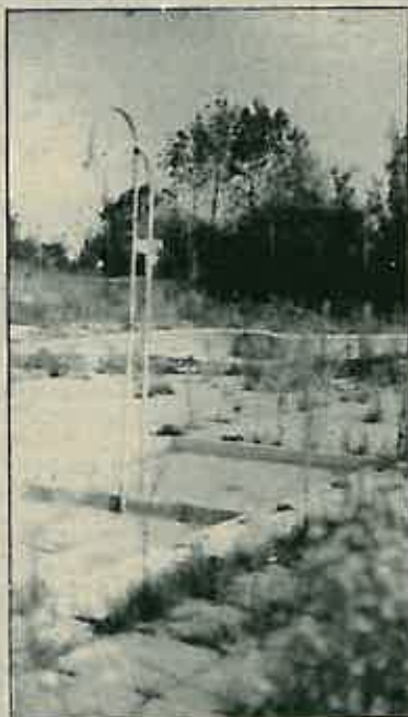
Mora li bazen na Martin bregu izgledati baš ovako???