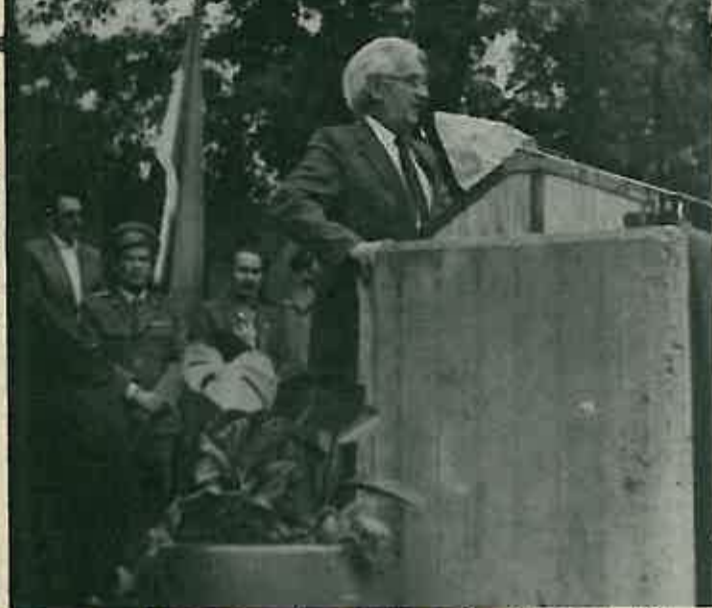
Narodni heroj Miloš Šumonja evocirao svoja sjećanja starješinama i vojnicima.

Ovih dana su pripadnici kasarne »Zagrebačkog partizanskog odreda« u Dugom Selu svečano i radno obilježili Dan jedinice i 42. obljetnicu formiranja 5. Kordunaške narodnooslobodilačke Udarne brigade, čije svijetle i revolucionarne tradicije njeguju i nastavljaju.