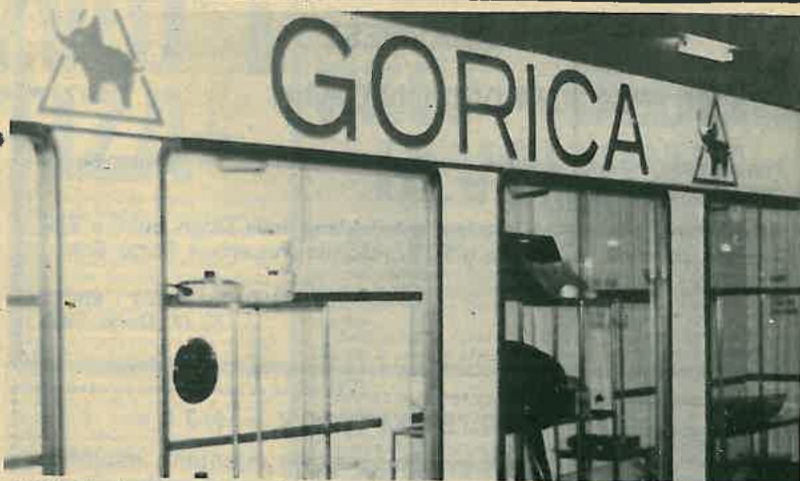
»Goričin« štand na Jesenskom zagrebačkom velesajmu

Sa sajma posebno izdvajamo zanimanje kupaca za naše proizvode sezonskih karakteristika (dimovodne cijevi, koljena, kante za mast, posude većih dimenzija, garniture emajliranih kotlova). Potražnja spomenutih proizvoda koje uglavnom kupuje poljoprivredno područje, potaknuta je sigurno rodom godinom, a