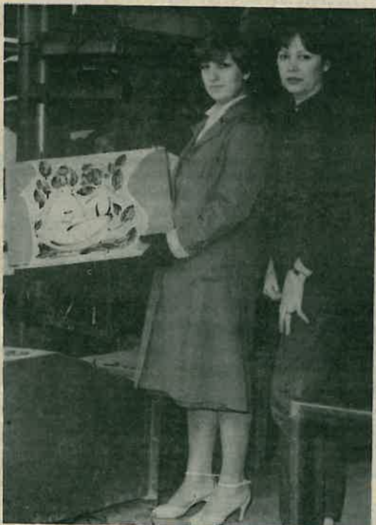
Izložba je prilika da se umjetnost približi i našim radnicima, da upoznaju i drugačije mogućnosti materijala, one, s kojima se svakodnevno ne susreću na svom radnom mjestu.

Oduševljena je idejom o izložbi radova unutar tvornice, jer »je bitno da radnici budu upoznati s rezultatima rada umjetnika koji su stvarali tu, među nama«.