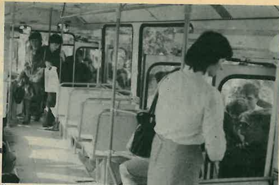
Novna organizacija prijevoza

Revoltiranost i ogorčenost putnika pokazuje da ipak nije sve tako sjajno. U razgovoru sa građanima čuli smo mnogo pritužbi, pa čak i psovki na račun ZET-a. Putnici se najviše žale na slabu organiziranost prijevoza, nesnošne gužve, dugo čekanje i nedostatak nadstrešnica na stajalištima. Uz sve to neugodni zadah sesvetskih industrijskih postrojenja doprinosi općem nezadovoljstvu putnika. Novi terminali ni u kom slučaju ne zadovoljavaju kvalitetom. Građen je na veoma skučenom prostoru, sa cestom jedva dovoljno širokom da se dva autobusa mimoiđu. Osim toga i stajališta su premala, tako