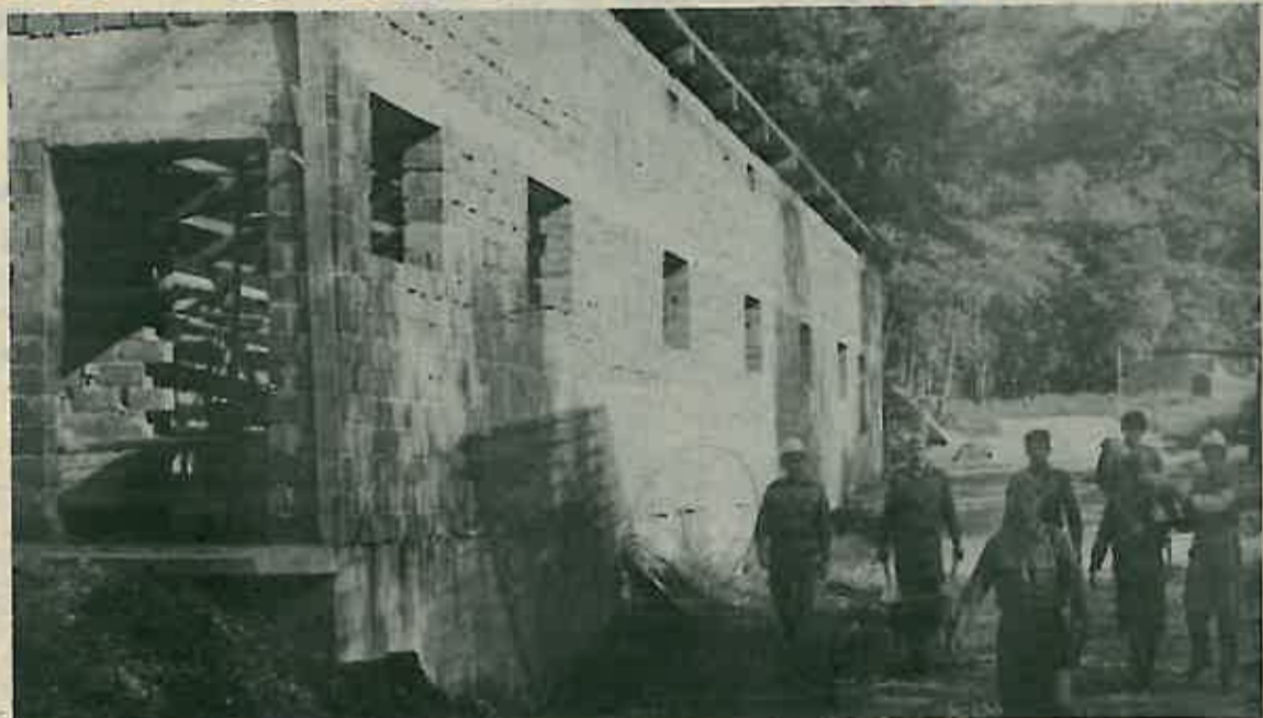
Završetak radova na objektu za tov svinja

Uporedo sa objektom za tov svinja, pripadnici ove jedinice su završili i suvremeno, automatizovano streljište za vazдушnu pušku i obuku strelaca-vojnika i starješina, što će doprinjeti u mnogome osposobljenosti pripadnika ove jedinice. Sa radovima na strelištu za vazдушnu pušku rukovodio je vojnik DAVOR