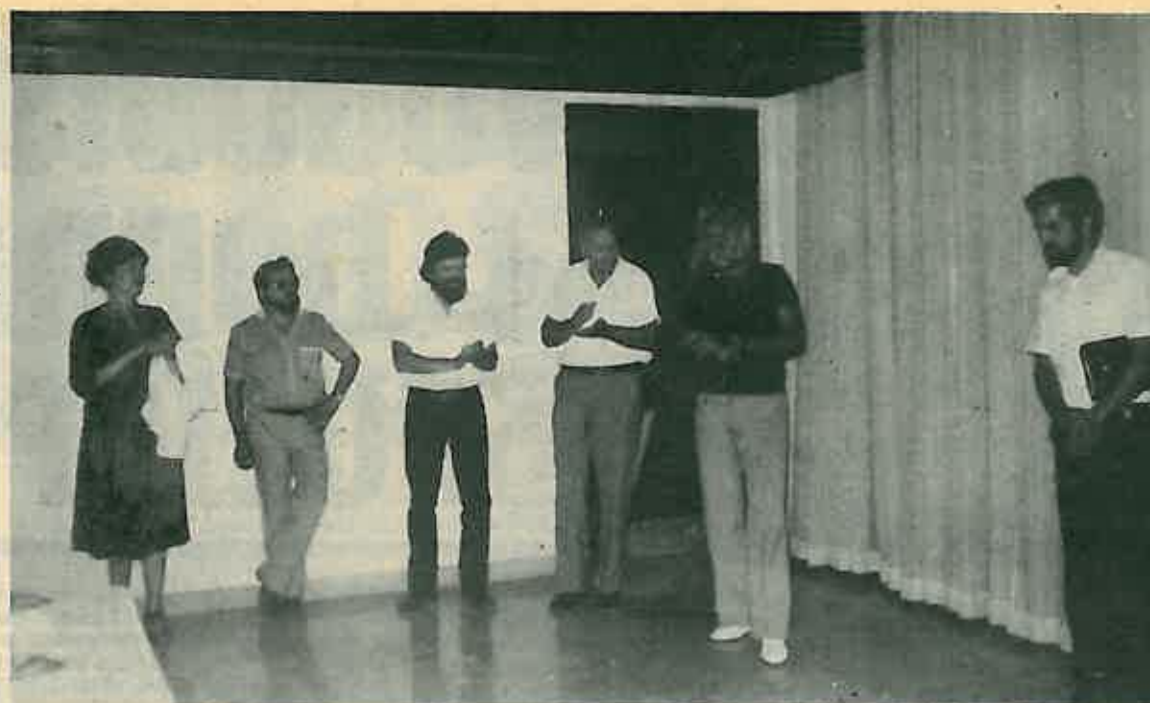
Sa otvorenja -ovogodišnje umjetničke kolonije »Bratstvo-Jedinstvo»