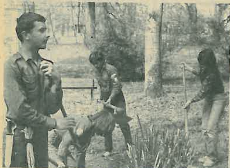
Sa akcije čišćenja parka