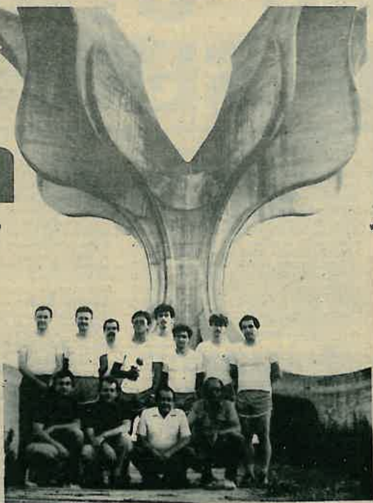
Posrebno priznanje ekipi »7 sekretara SKOJ-a«