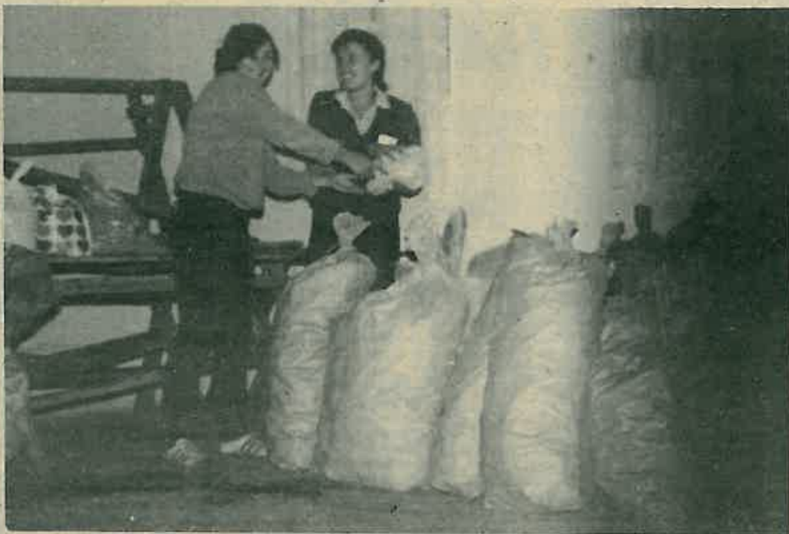
Sabirno mjesto u Ostimu.