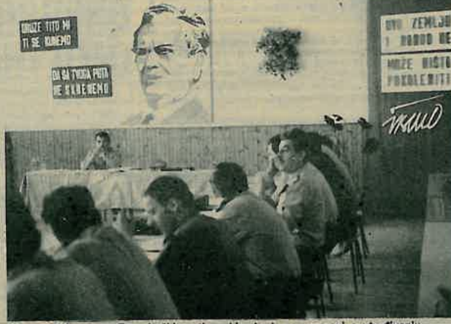
Komunisti kasarne »Zagrebački partizanski odred« na raspravi o utvrđivanju zadataka