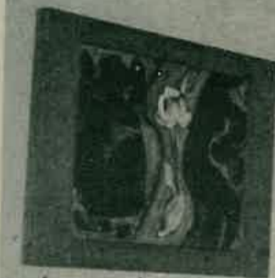
Izložbeni dio Ljerkę Njerš

Svaka izložena slika je specifičnim, sebi svoj-