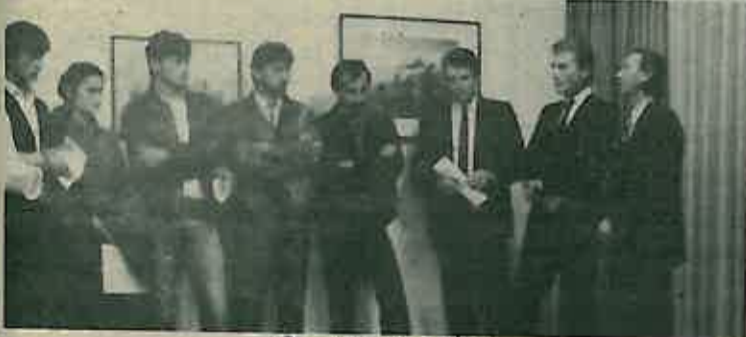
Sa otvaranja izložbe