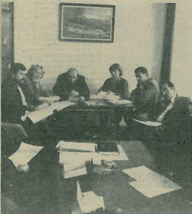
Sa sjednice Predsjedništva SSRNH Dugo Selo