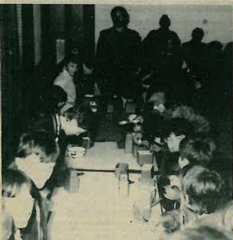
Trbušiću moj gledan li si joj...