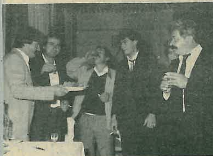
Veselo se već ulazilo u dvoranu

Dugoselskim mališanima došli su za ovu prigodu u posjetu i mališani iz Zeline (njih 34) i mališani iz Vrbovca (njih 31). Bijaše posebno zanimljivo vidjeti dugoselske mališane kako ugođavahu svoje vršnjake iz susjednih općina. A mali Vrbovčani i Zelinčani pozvaše na kraju svoje male prijatelje iz Dugog Sela da im uzvrate posjet - što ovi ne odbiše.