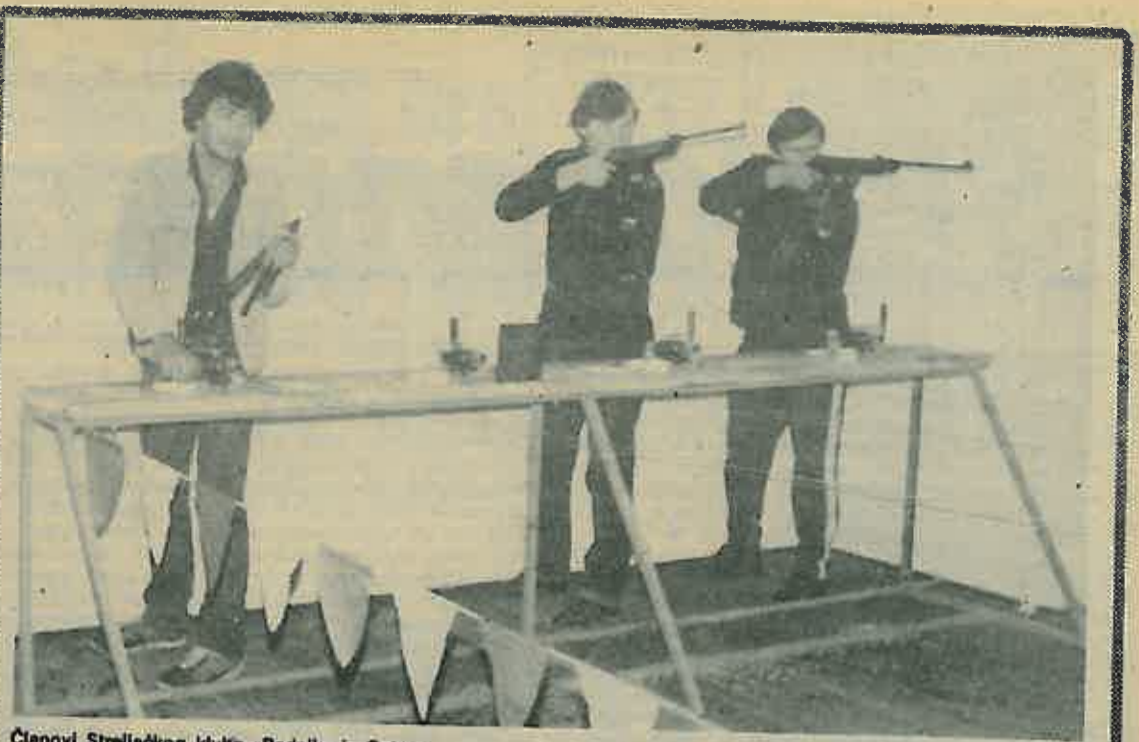
Članovi Streljačkog kluba «Radnik» iz Ostre