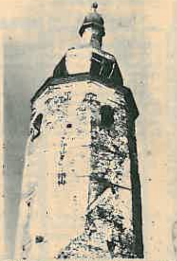
»Starica« – svjedočanstvo o nama i naraštajima sljedećeg tisućljeća

»Komisija u cijelosti prihvaća predložene radove i predlaže RSIZ-u kluturu da se osiguranim financijskim sredstvima sudjeluje u sufinanciranju gore navedenih osnovnih radova (podvukao pisac članka).