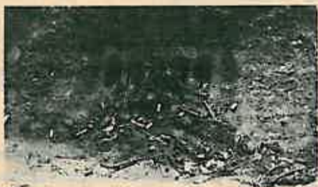
Slivnik – jedan od brojnih naših

Poslije svega jedno je sigurno: takvi i tako organizirani estradni nastupi uistinu nisu potrebni ni Dugom Selu. Oni, sigurno je, umanjuju zanimanje i za one buduće kvalitetnije priredbe.