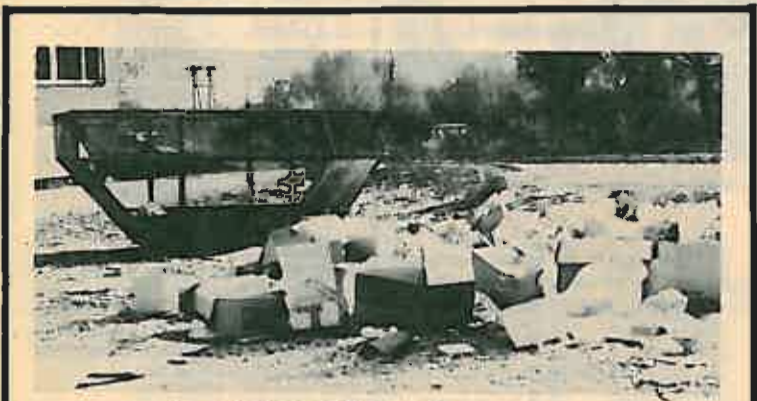
Uočljiv je tu originalan i vlastiti stil

Korisnici ZET-ovog prijevoza shvatili su konačno čemu služi vozni red: da bi građani mogli lakše i preciznije utvrditi kašnjenje autobusa.