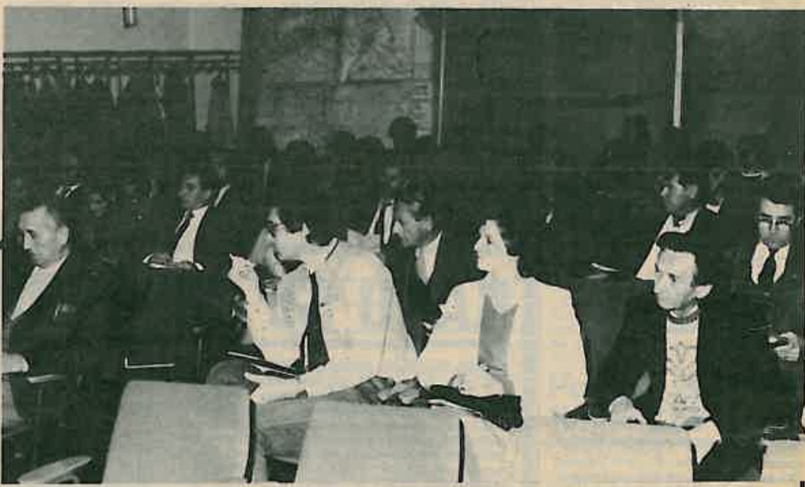
Na sastanku rukovodnih struktura iz privrede i neprivrede općine

Na prvom sastanku je još bilo riječi o prikupljanju sredstava za iz-