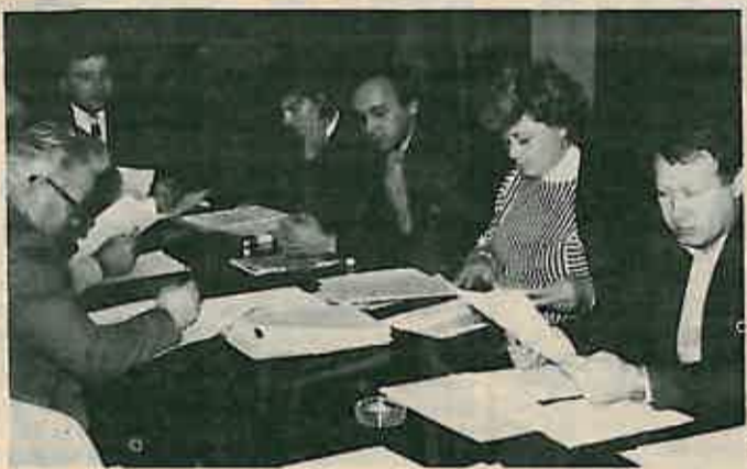
Sa sjednice Izvršnog vijeća SO

Izvršno vijeće SO održalo je u studenome dvije sjednice: 7. i 19. studenoga 1984. g. Na njima je Vijeće donijelo više odluka i prijedloga iz svoje nadležnosti.