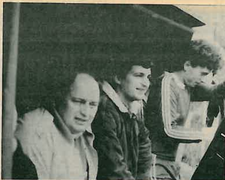
Nakon dugo vremena zadovoljstvo na licu trenera »Jedinstva«

JEDINSTVO 4(1) PRIGORJE (M) 0(0) Dugo Selo. Igračište Jedinstva. Gledalaca oko 250. Sudac Šumić 8,5. Strijelci: 1:0 Belovanović, 2:0 Jularić, 3:0 Bekavac; 4:0 Bekavac