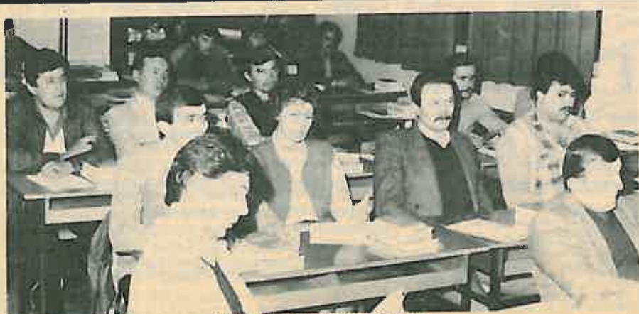
Početak rada Političke škole SK

Predavači i u sindikalnoj i u partijskoj školi bit će društveno-politički radnici, sindikalni i partijski aktivisti te privrednici sa područja naše općine. Otvaranje Sindikalne škole prisustvovao je i predstavnik Vijeća Saveza sindikata Hrvatske.