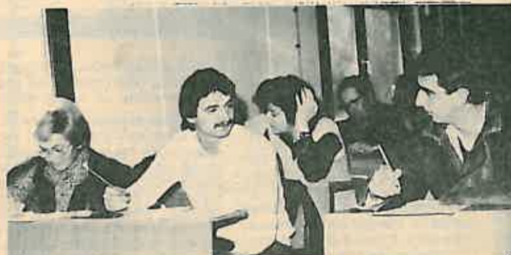
Sa instruktaže za novu evidenciju članstva SKH