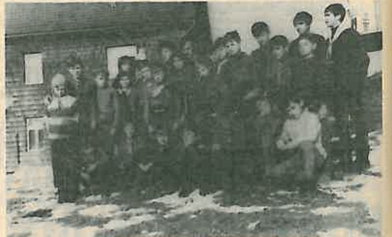
»Skrad '69« – bili smo miadi, nestašni i hrabri