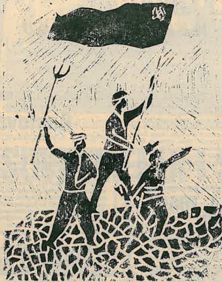
VANJA ŠOHN, VII d