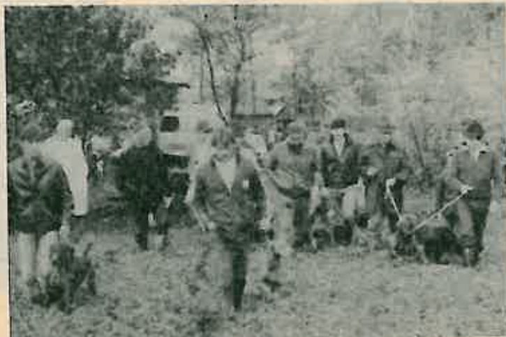
Svaki je pas morao pokazati svoje znanje i sposobnosti