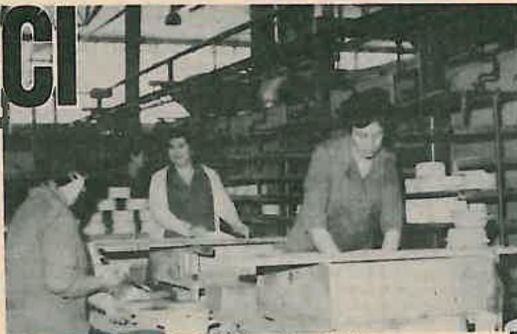
Proizvodnja posuda u »Gorici«

Ukupan prihod OOUR-a Kemijska proizvodnja od 691,4 ml dinara 84% je veći od ostvarenog ukupnog prihoda u istom razdoblju prošle godine. Utrošena sredstva od 495,3 ml dinara 11% su veća od planiranih. I u ovom OOUR-u sirovine i materijal čine najznačajniju