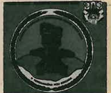
Omot gramofonske ploče

Naša armija, koja je po svom karakteru, vojnoj i društveno-političkoj ulozi neposredni izdajnik Oružanih snaga revolucije, oslanja se prije svega na tradicije narodnooslobodilačkog rata, ne zanemarujući ni pozitivna iskustva ranijih generacija. Vrijednost tradicija iz NOR-a je u tome što su se razvijale uporedo sa razvojem armije u osobenim uvjetima i na vlastitom nacionalnom području, i što u sebi sadrže sve pozitivne vrijednosti iz prošlosti, koje su se kroz dugogodišnje iskustvo afirmisale u životu i postale jedna od bitnih osnova na kojima se izgrađuje vojna organizacija i unapređuje suvremena vojna misao.