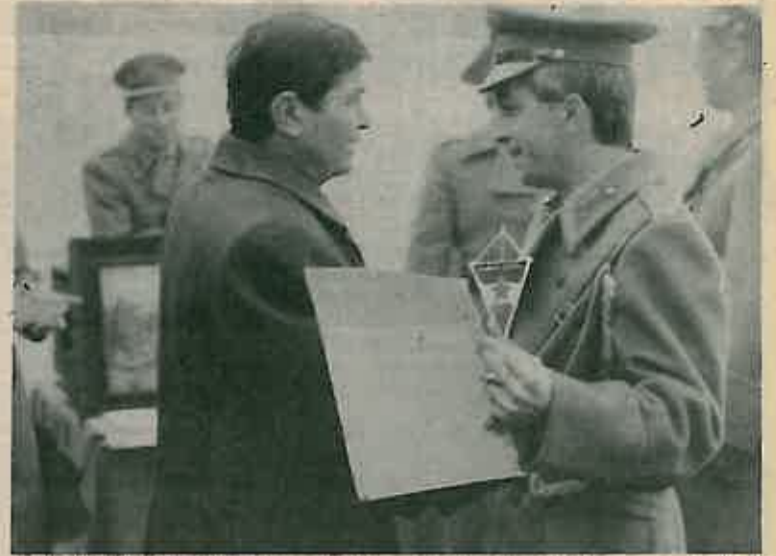
Predsjednik SO Sesvete prilikom uručivanja televizora najboljoj jedinici