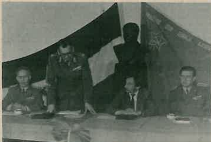
Voditelji susreta novinara Hrvatske

Povodom Dana JNA, 17. prosinca, u kasarni »Zagrebački partizanski odred« Dugo Selo održan je susret novinara Hrvatske, kojeg je organizirala komanda Zagrebačke armijske oblasti.