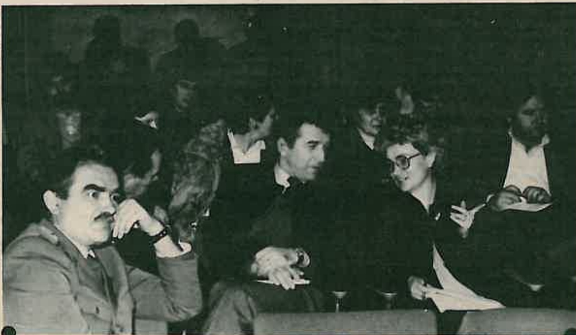
Sa sastanka sekretara OO SK

Dugoselska kronika će slijedeće godine, prije izlaska knjige iz tiska, objavljivati dijelove iz te knjige, koja se u našoj općini očekuje s velikim zanimanjem.