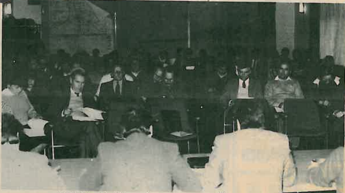
Sa sjednice Skupštine općine

Na kraju su doneseni i zaključci u kojima se prihvaća predložena analiza poslovanja. Ocjenjeno je da gubitci koji su donijeli svoje sanacione programe iste ne ostvaruju, s time da se zadužuje Izvršno vijeće da se uključi u rješavanje njihovih teškoća. Prihvaćena je također i analiza Općinskog vijeća Saveza sindikata Dugo Selo o ostvarenoj raspodjeli osobnih dohoda, tako da se ocjenjuje da nisu prisutna većna narušavanja zacrtanih opredjeljenja u raspodjeli dohotka i osobnih dohoda.