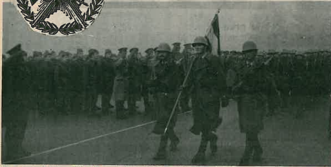
Sa svečanosti Dana JNA u kasarni »Zagrebački partizanski odred«