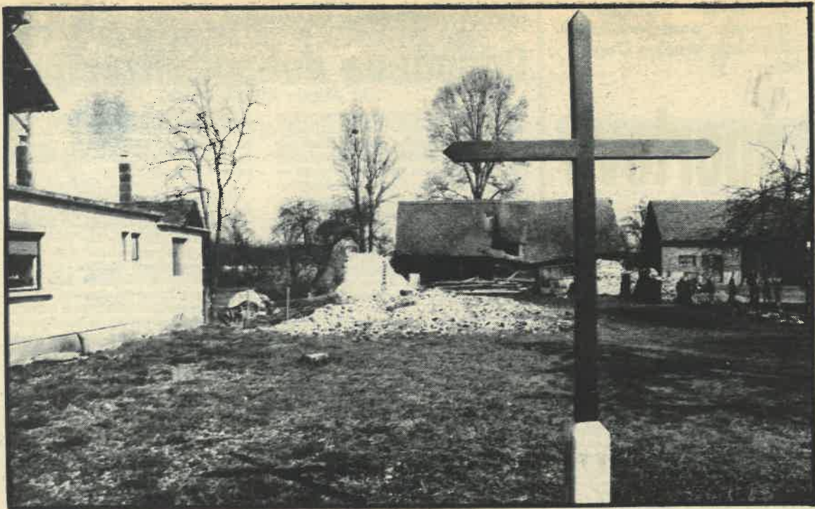
Mjesto gradnje crkve u Sopi