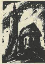
U SUSRET MARTINJU

12. studeni — PRVI GLAS DUGOG SELA (nastup debitanta, nastup »veterana«, izravni radijski prijenos)