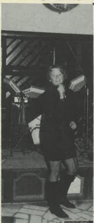
OVAKO JE BILO NA AUDICIJI...