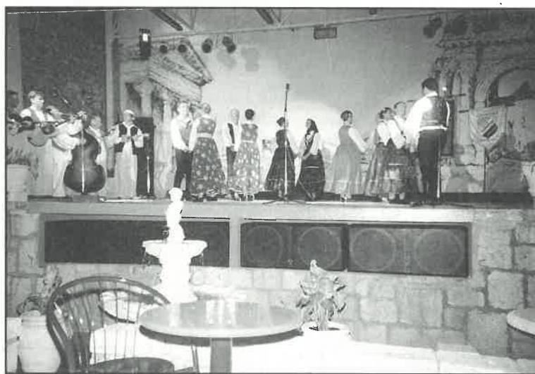
Bunjevački plesovi u izvedbi "Preporoda" među senjskim zidinama