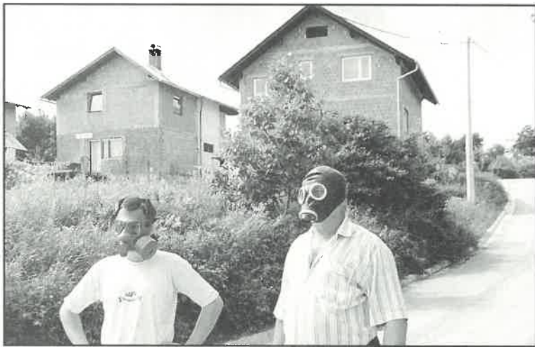
Tamo gdje kanalizacija slobodno otiče za boravak na otvorenom nužne su zaštitne maske

Stanovnici Grgošićeve ulice koja nas vodi s Martin Brega u smjeru Prozorja zvali su nas nakon što je sadržaj kanalizacije preplavio njihovu ulicu. Od kuća sagrađenih iznad njih otpadne vode (sa svim sadržajima uključujući i fekalije) - slijevaju se nizbrdo u očito nepravilnu kanalizacijsku odvodnju. Sadržaj preplavi