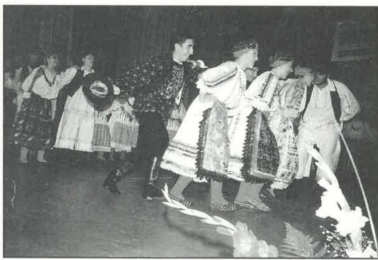
Raskoš baranjskih plesova i nošnji pokazali su u Velikoj Gorici

Nakon nekolicine uspješnih nastupa prigodom događaja u okružju vlastitog grada i okolice, Preporodaši su proteklih dana obišli druge hrvatske krajeve. S nastupa na županijskoj smotri folkloru u Velikoj Gorici donijeli su izuzetno pozitivne kritike. Stručni sud dodijelio im je sve pohvale za izvedbu baranjskih plesova i običaja, posebice za kostimografiju koja je odisala raskošnim bojama, bogatstvom i za taj kraj tipičnim blještavilom. Izvedba je bila kvalitetna, korektna, čak više od toga, no sve te pohvale nisu im donijele prvo mjesto na smotri, koje je i ove godine između osam