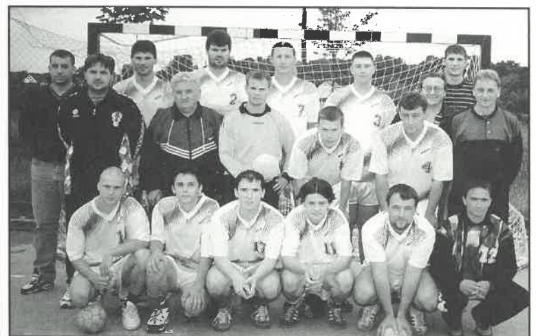
RK «Stančić» - sadašnja ekipa sa članovima uprave

Kao prioritete kojima klub treba stremiti u slijedećih pet godina istaknuti su prelazak u viši rang natjecanja - II Hrvatsku ligu, osiguranje prikladnog prostora za treninge tijekom cijele godine, a posebice rad s mladim igračima kao i imperativ održanja ekipe na okupu. ah