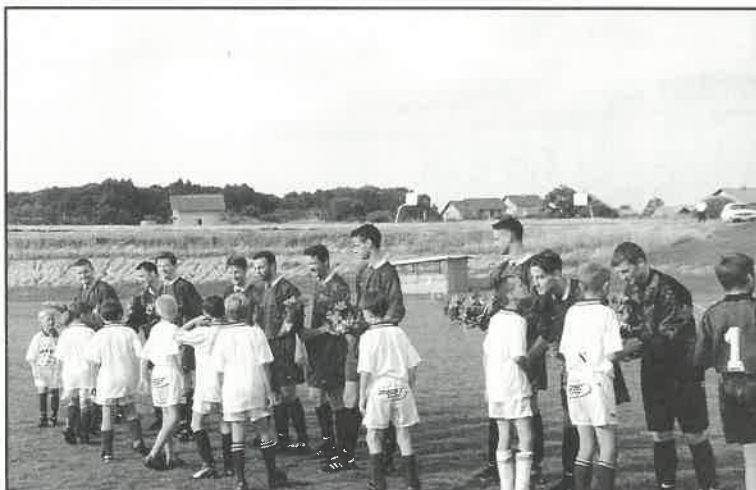
▲ Dugoselski juniori cvijećem su ispratili senirsku ekipu u viši rang natjecanja

Unaprijed poznavajući ishod spomenute utakmice i veseleći se usponu svog kluba, grad je priredio slavije kojem su se pridružili nogometaši i navijači. Valjalo je proslaviti konačan ulazak u viši savezni rang natjecanja - III Hrvatsku