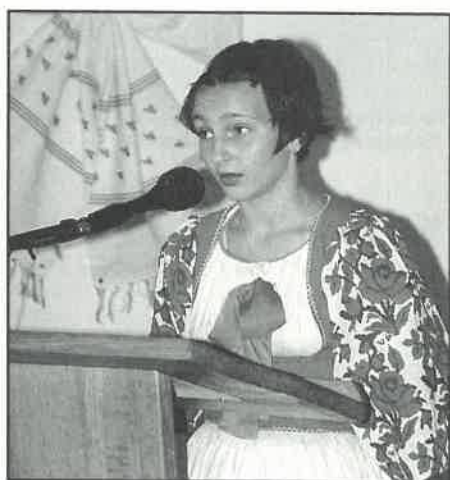
Općinski blagdan - prigoda za domaću reč u izvedbi učenika osnovne škole

izložbi vatrogasne opreme od desetak opremljenih suvremenih vozila pripravnih za svaku intervenciju. Program narodnih pjesama s ovog područja izveli su članovi kulturno-umjetničkih društava iz Lupoglava i Brckovljana. Održana je pokazna vatrogasna vježba, natjecanje u nogometu, lovačko natjecanje u gađanju. Nakon službenog dijela uslijedilo je narodno veselje uz glazbu.