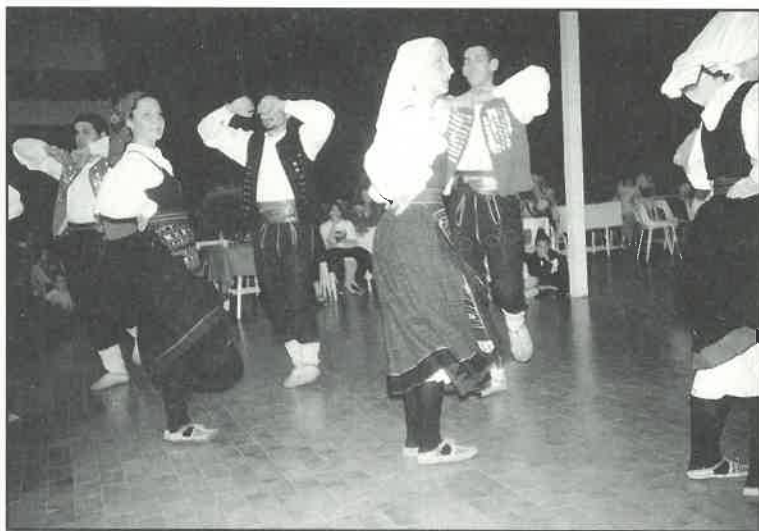
U Novom Vinodolskom otplesali su i ličke plesove

Na smotri folkloru u Oborovu organiziranoj prigodom 25. godišnjice tamošnjeg KUD-a "Posavka", "Preporod" je izveo ličke plesove.