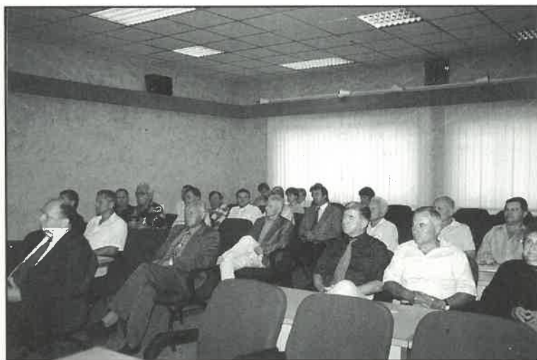
Novoimenovani suci porotnici Općinskog suda Dugo Selo prigodom svečane prisege

Ovih tridesetak časnih i uglednih građana pridonosit će kvalitetnom sudovanju koje odiše pravičnošću, nepristranošću, građanskim i pravnim težnjama - rečeno je prigodom svečane prisege. (nk)