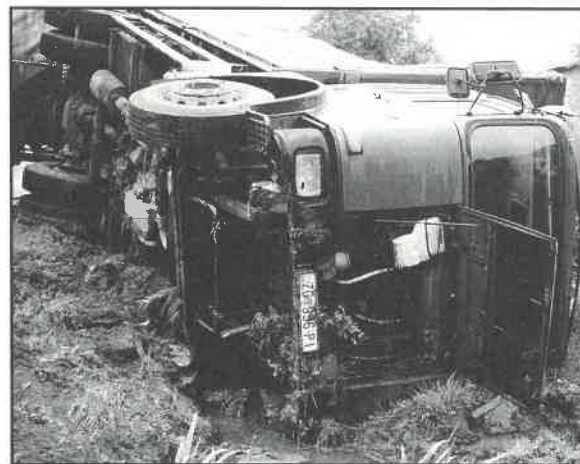
Posljedica neprilagođene vožnje teretnjaka glavnom i preopterećenom prometnicom

I ove godine velik interes za ljetovanje u dugoselskom odmaralištu