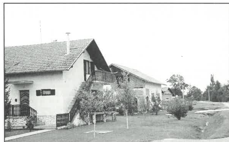
Stanovnici Narta Savskog nagrađeni za uređenje naselja