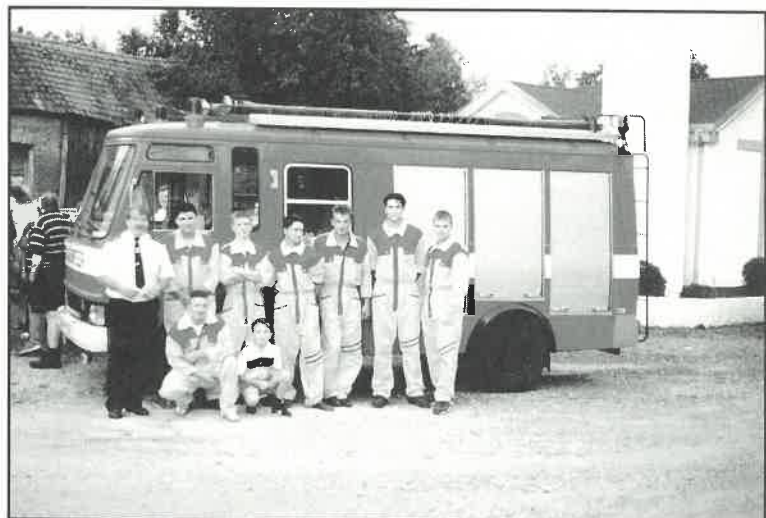
Novopristiglo vozilo DVD Hrebinec bilo je dio izložbe vatrogasnog voznog parka i opreme za potrebe učinkovitih intervencija