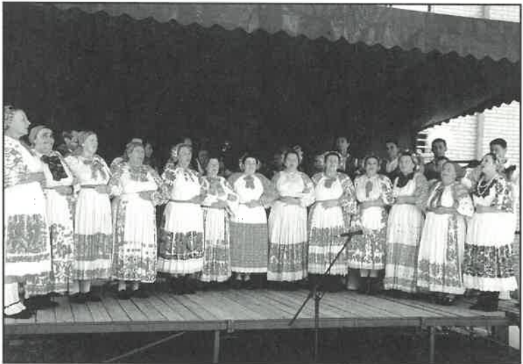
Nastup kulturno-umjetničkih društava iz Brckovljana i Lupoglava