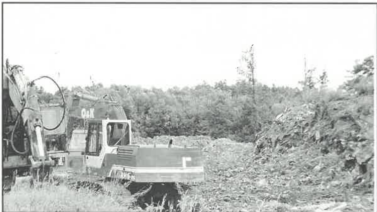
Odlagalište u završnici sanacije

Ovih dana iščezava ružna slika nagomilanog smeća u Rugvičkoj ulici. Pri kraju je sanacija odlagališta. Radove izvodi JVP "Lonja Zelina", uz potporu Hrvatskih voda. Uklanjanjem hrpe smeća onemogućeno je daljnje ispiranje štetnih tvari uslijed oborinskih i površinskih voda, što je pridonosilo zagađenju vodotokova. Usporedno sa uklanjanjem smeća obavlja se sanacija obale vodotoka Črnc. Izvođenje radova financira Grad Dugo Selo.