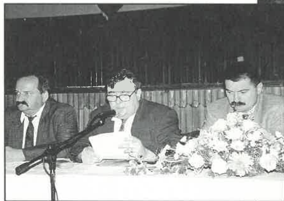
Prigodom Dana općine Rugvica dodijeljeno priznanje Nartu Savskom

Općina Rugvica izabrala je najljepše uređeno naselje na svom području. Tu laskavu titulu do ponovnog izbora nosi Nart Savski, za što je mjesnom odboru dodijeljena i novčana nagrada. Takvu nagradu primili su i vlasnici najljepše okućnice na području općine. Uručene nagrade poticaj su Rugvičanima na veću brigu o izgledu naselja i okućnica. Uz zahvale i druga priznanja općina Rugvica za svoj dan predstavila je projekt nove osnovne škole. (Opširnije na stranici 5.)