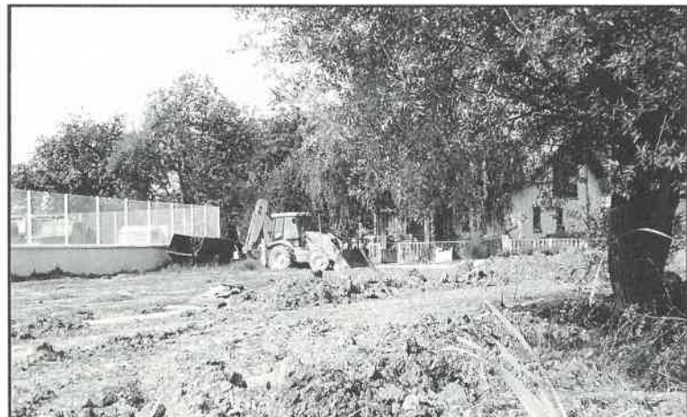
Uređuje se igralište u Kolodvorskoj

U gradu se osjetio nedostatak dječjih i sportskih igrališta. U tijeku je uređenje dvaju košarkaških igrališta sa sjeverne strane školske sportske dvorane. Troškovi za predviđene radove iznose 250.000 kuna. Prostor za igru dobiti će i djeca iz Kolodvorske i okolnih ulica. Doseljavanjem novih obitelji u stambeni centar "Arcus" veći broj djece provodi slobodno vrijeme na ulici i na tržnici gdje silom prilika nalaze mjesto za igru. Uređenje igrališta započelo je u Kolodvorskoj ulici, pored objekta Veterinarske stanice. Nekad podvodni teren već je uređen, zasijati će se travom i postaviti sadržaji za sportske aktivnosti. Bude li sredstava, a za sada je odvojeno 80.000 kuna, na tom će se prostoru postaviti i drugi sadržaji za igru.