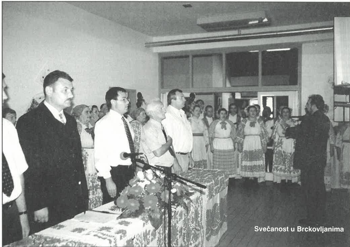
Svečanost u Brckovljanima