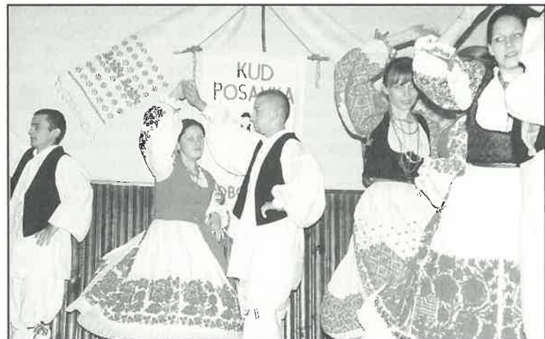
Splet posavskih plesova za Dan općine

Obilježavanje općinskog praznika Rugvičani su obogatili kulturnim programom u kojem je nastupilo KUD "Posavka", izložbom slika Dijane Sočnić, prigodnim tekstovima na kajkavskom narječju, sportskim programom, lovačkim i vatrogasnim natjecanjima, te zajedničkim druženjem. (nhm)