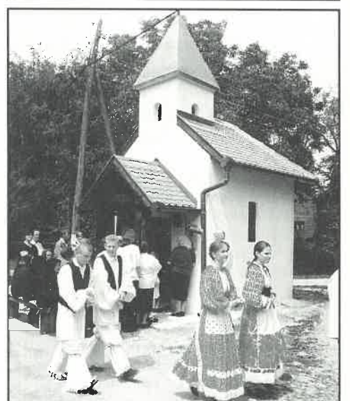
Misa u obnovljenoj kapelici u Novakima Oborovskim

OBAVIJEST! Javni natječaj za prodaju zemljišta na području Općine Rugvica objavljujemo na stranici 7.