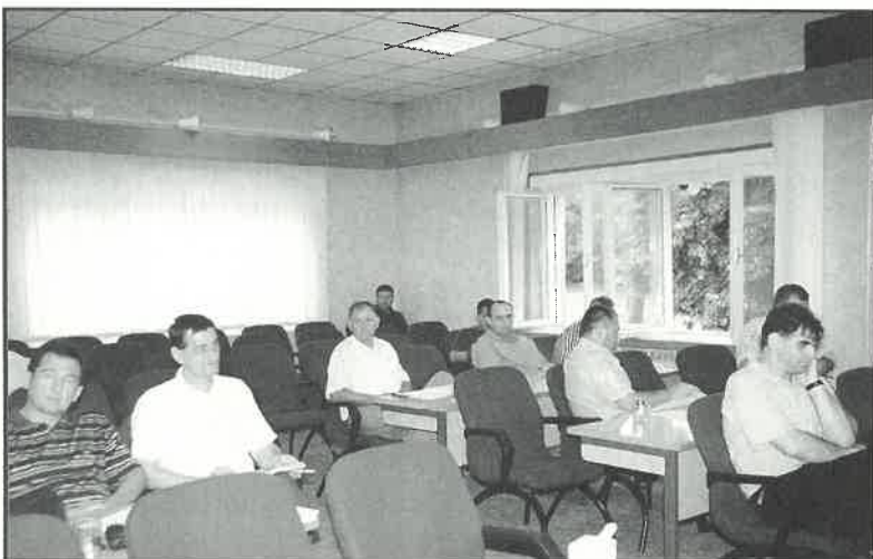
Do kraja rasprave o poslovanju "Dukoma" ostalo je premalo vijećnika Gradskog vijeća za glasovanje

kuna prihoda, najvećim dijelom od prodaje proizvoda i usluga (98 posto), te manjim dijelom od prodaje roba, drugih financijskih i izvanrednih prihoda. Ukupni troškovi i rashodi dosežu 29.538.972 kune, a najveći dio rashoda odnosi se na materijalne troškove (77 posto), u čemu najveći dio otpada na troškove sirovina i materijala (plin, voda i drugo). Troškovi osoblja iznose 3,7 milijuna ili 12,6 posto ukupnih troškova. Iz predočenih