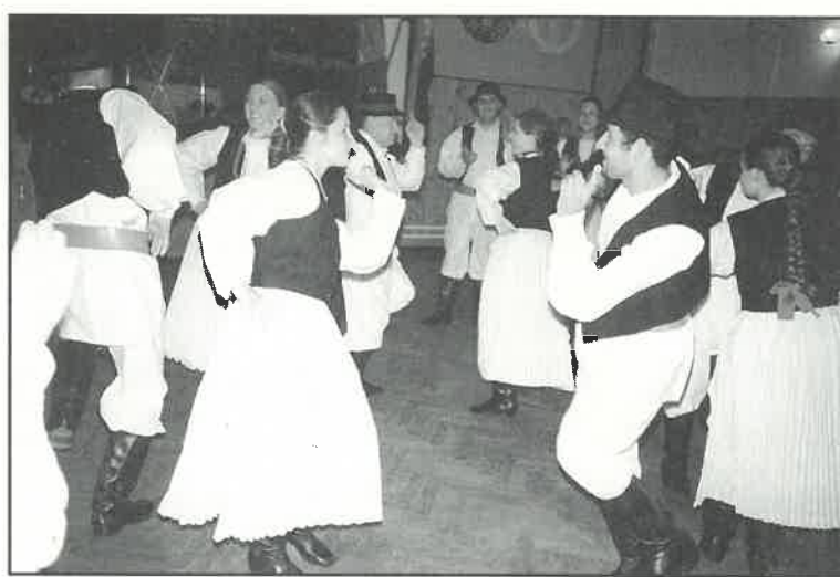
Plesovi iz Hrvatskog Zagorja bili su tek dio cjelovečernjeg programa