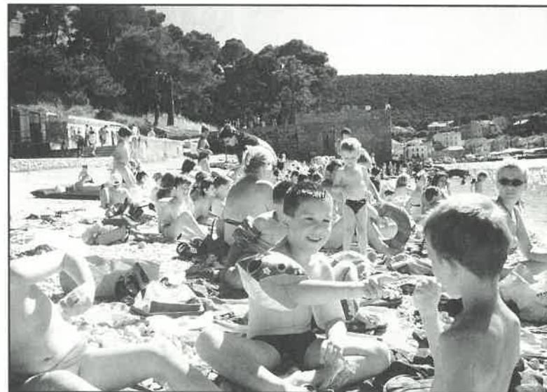
Djeca iz dječjeg vrtića "Dugo Selo" s tetama su u Lošinj provela jedanaest sunčanih dana

U grupama od 12. do 27. kolovoza i od 27. kolovoza do 5. rujna još ima slobodnih mjesta. Upisi su u tijeku do 15. kolovoza kod gđe. Jadranke Sačer u Općinskom sudu u Dugom Selu svakog dana od 9 do 14 sati. ah