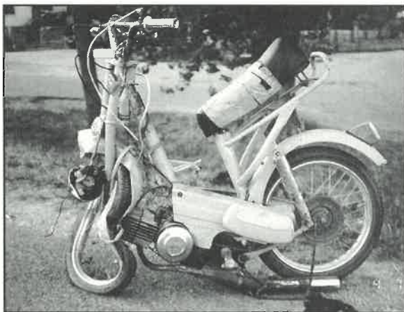
U sudaru maloljetnog vozača mopeda s automobilom kojim je također upravljao vozač bez dozvole nastale su teške povrede i materijalna šteta

Roditelji maloljetnog sudionika u prometu dužni su ga nadzirati. U protivnom će za samostalno upravljanje maloljetnika biciklom ili mopedom na prometnicama snositi propisane sankcije.