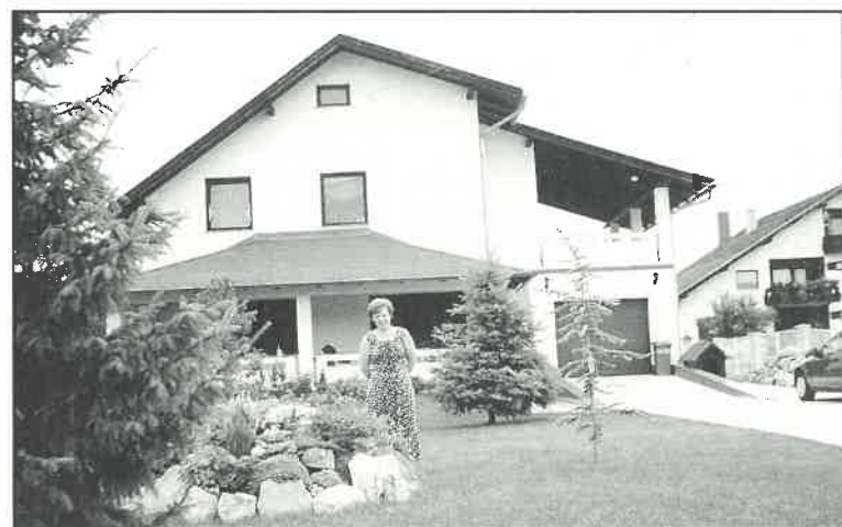
Nagrađena okućnica obiteljske kuće Pasariček u Trsteniku