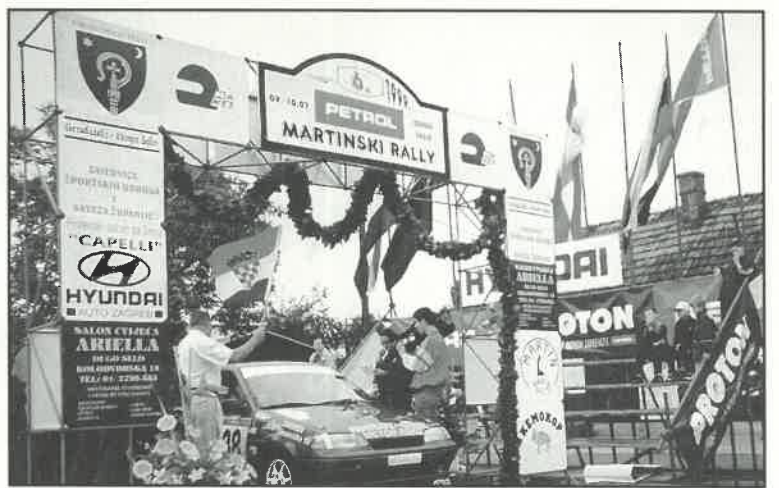
▲ Večernji start 6. Martinskog relija u Kolodvorskoj ulici uz kišne kapi