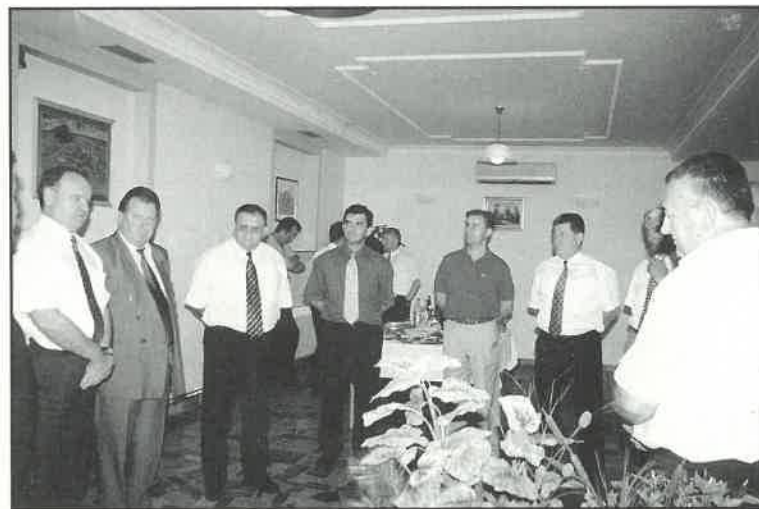
Susret predstavnika grada, općina i Hrvatskih voda na Martinu Bregu