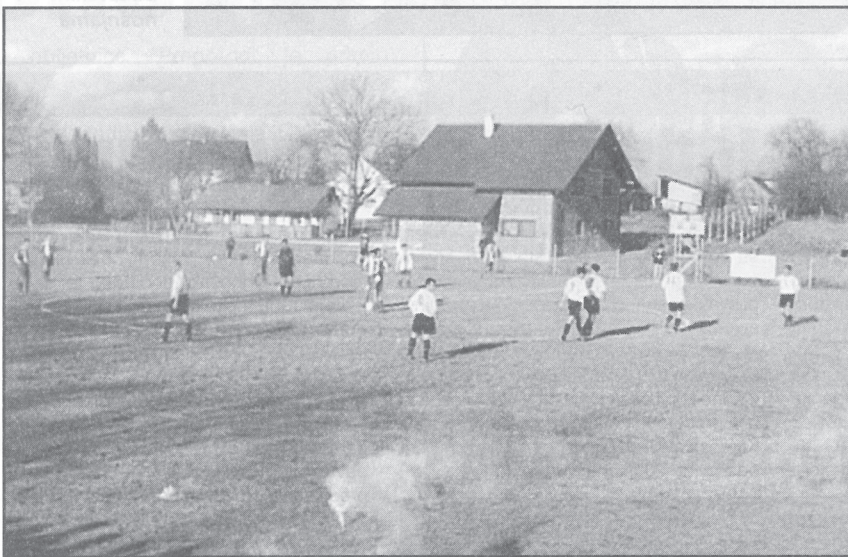
Dobra igra unatoč neuređenog igrališta i okoliša

početkom prvenstva i nedovoljnom uigranošću ekipe. No, ubrzo bodovni neuspjeh je vraćen za tjedan dana na domaćem travnjaku, gdje je pobijeđeno Obedišće. Rezultat 2:1 koji je do kraja bio neizvjestan, pokazao je pravu sliku događanja na terenu. Vrlo tešku utakmicu uz čvrsti otpor gosta. Iako prikazana igra nije bila oduševjavajuća, ipak su se igrači opravdali iskazanim zalaganjem i trudom koji su ulagali u velikoj mjeri. U trećem kolu slijedi gostovanje u Banovu kod ekipe Bana Jelačića i utakmica u koju se ušlo sa namjerom da se ne izgubi. Budući je bila gostujuća i o protivniku se nije previše znalo. Međutim, na svu radost ostvarena je prva iznenađujuća gostujuća pobjeda sa rezultatom 2:0. Uz presudne izmjene igrača koje su omogućile stopostotnu sigurnost strijelaca s klupe, valja pohvaliti obranu na čelu s golmanom Milanom Vešligajom koji su izdržali sve napade domaćina i uspjeli ne primiti niti jedan zgoditak. S ovim rezultatom od dvije