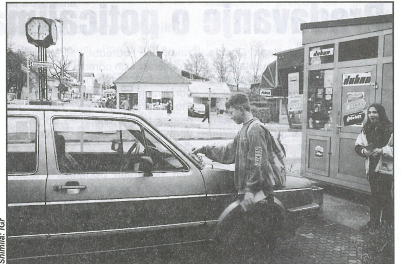
Obilježavanje parkiranih automobila koji otežavaju kretanje invalidnih osoba

akcija u kojoj su djeca, članovi Crvenog križa obilježavala nepropisno parkirane aute. Lecima ružičaste boje, koji su predstavljali upozorenje zbog nepravilnog parkiranja na aute, stavljali su dan prije Dana invalida, dok su lecima žute boje s naznakom "Označeni ste!", predstavljali sam prekršaj vozača i