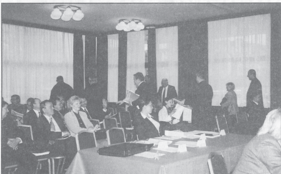
Vijećnici HDZ-a napuštaju sjednicu

Usprkos napuštanju 15 vijećnika HDZ-a tematska sjednica o stanju i pravcima razvoja gospodarstva, poljoprivrede i komunalne infrastrukture koji su sastavni dio Strategije i programa održivog gospodarskog razvoja Zagrebačke županije, a održana 2. prosinca u prostorima zagrebačkog hotela "International", nastavljena je bez odgađanja. No, zbog nedostatka kvoruma, s obzirom da se samo o temi razvoja gospodarstva rasprava vodila od 12 do 15 i 30 sati, zaključci sjednice odgođeni su za 17. prosinac.