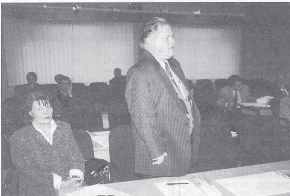
Predstavnicima Udruge upoznali Poglavarstvo s potrebama i poteškoćama invalidnih osoba