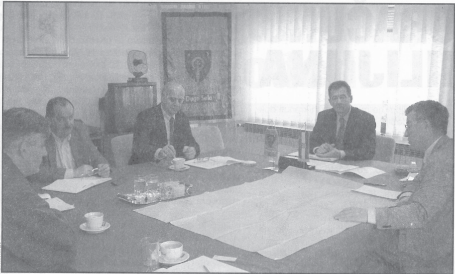
Predstavnici Hrvatskih voda i Dugog Sela dogovorili ubranu aktivnost na realizaciji cjelovitog sustava zbrinjavanja voda za područje Grada uključujući sva naselja

Uvodno je sagledano postojeće stanje u odvodnji s kojom se najdalje odmaklo u naselju Kozinščak gdje je dijelom mreža izgrađena, a za preostali dio naselja izrađena je dokumentacija i pribavljena građevinska dozvola. No, izražena je potreba i nužnost rješavanja odvodnje u drugim, novim i gusto naseljenim dijelovima kao što su naselja Kopčevac, Puhovo, Ostrna, Lukarišće i drugi dijelovi. Stoga je u