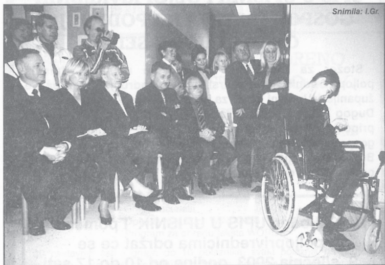
Korisnici Centra izveli program za posjetitelje iz Ministarstva, Županije i Općine